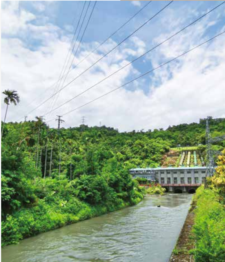
台電蘭陽發電廠

母親的名，叫做臺灣 這裡有我們共同成長的記憶 請您疼惜這款情 來寫臺灣的故事 臺灣很美 人民善良、勤奮、堅強、樂觀 這裡是我們生長的地方 是咱永遠的故鄉