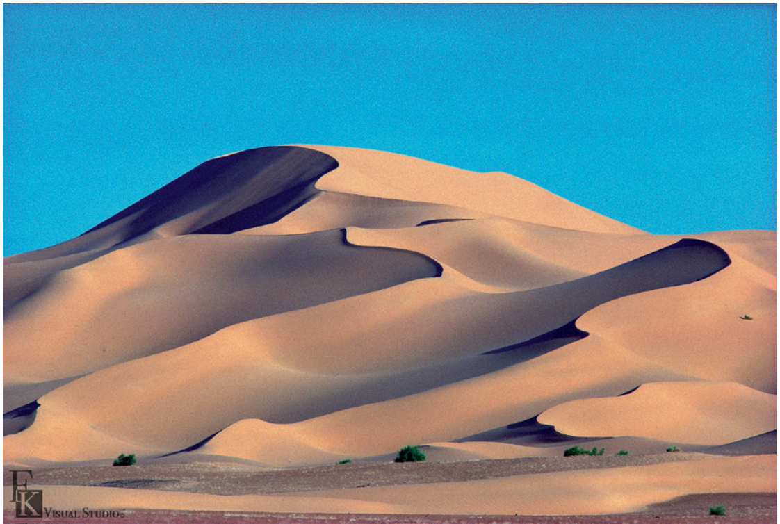
▲ 柯錫杰《自然的韻律》西元 1981 年攝影。

一棵蓊鬱開滿小白花的樹，倚立在一間有著裂痕的房子的白色牆上，茁壯的生命與衰老的破敗之牆，在衝突的張力中構成和諧之美。這是柯錫杰看到此景時如觸電般地按下快門。出乎意外的，幾年後的西元 1985 年它竟成就一樁美好的姻緣，因為樊潔兮從作品中讀出他渴望有個家的感覺，兩人的年齡即使相差 24 歲，但心靈相契，一起開展出敦煌舞蹈，又穿越千年的敦煌文化發展出超越敦煌舞蹈的「舞想·VU·SHON」。他們在生活上、創作