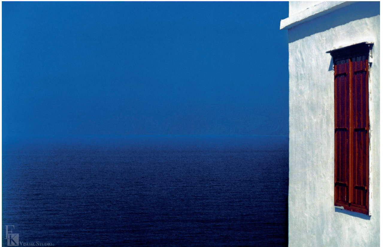
▲ 柯錫杰《等待維納斯》西元 1979 年攝影。

佛是「溺水三千，只取一瓢」，那一瓢已涵容整個天地，是純淨、素樸、寬闊、寂靜、神秘、原始等能量匯萃而出的空靈無染的境界。