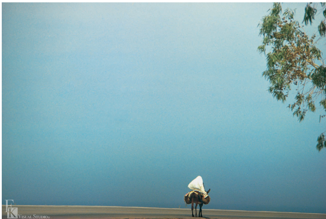
▲ 柯錫杰《行》西元 1979 年攝影。

西元 1979 年的流浪生涯，柯錫杰深入異國他鄉，是他對新視覺的探索，更是對「心視覺」的尋繹。他的攝影猶如脫胎