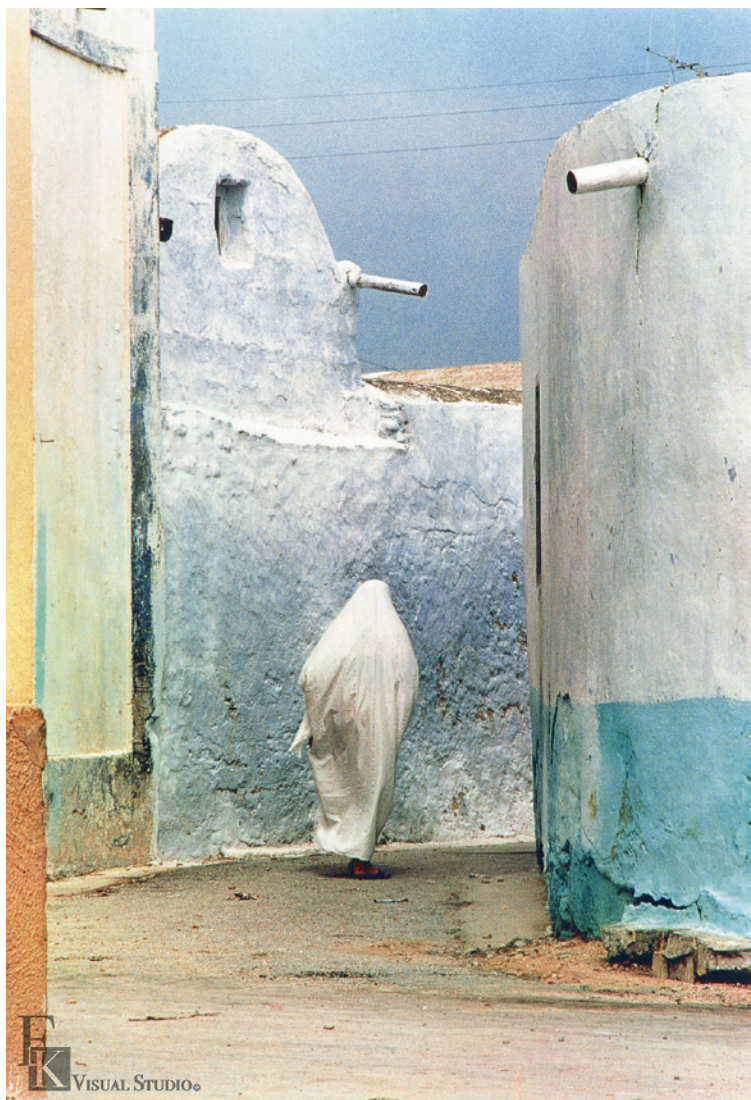
▲ 柯錫杰《白衣》西元 1979 年攝影。

這顆天涯孤星，以他的「攝影之眼」所呈現的「心象攝影」，的確流露著孤絕又簡潔的美感，他的作品彷彿是一位漂泊