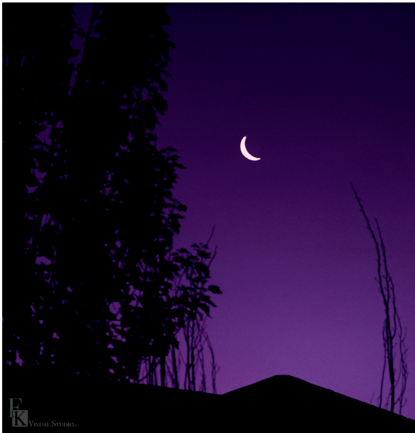
▲ 柯錫杰《敦煌之晨》西元 1986 年 攝影。