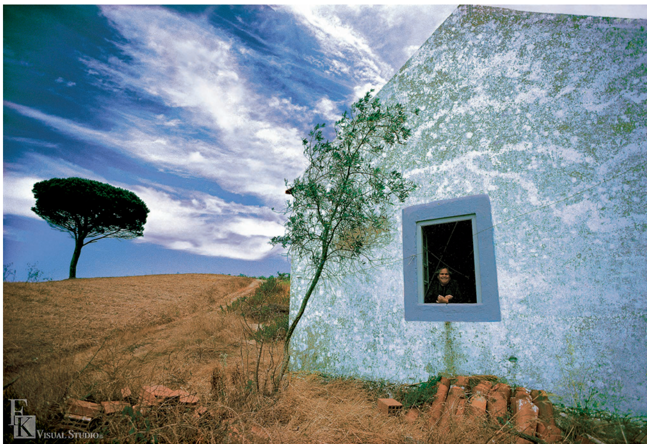
▲ 柯錫杰《老祖母瑪麗亞》西元 1979 年攝影。