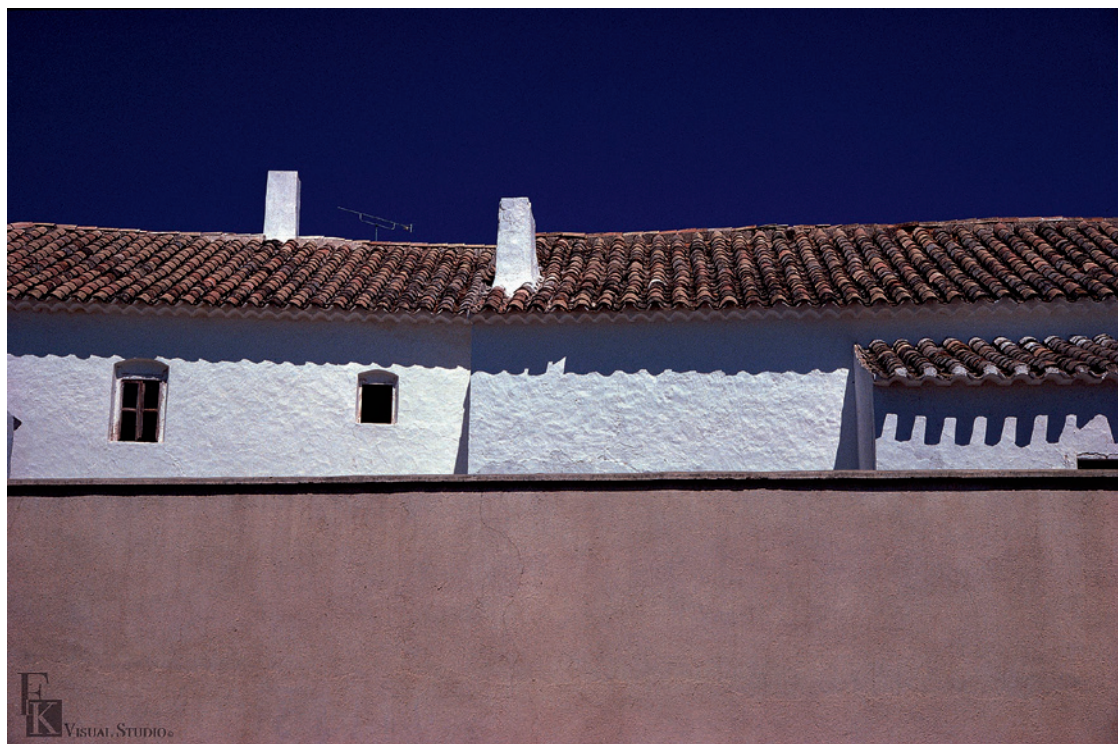
▲ 柯錫杰《兩支》西元 1979 年攝影。

為何柯錫杰總能採擷到天地中最自然獨特的景呢？外在現實的景色無法改變，然而在他的鏡頭框景中卻又如繪畫般超越了外象。他那種「刪繁就簡」的本事，彷彿