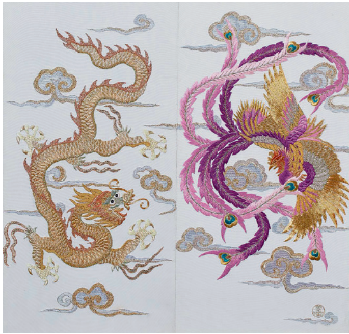
▲ 《天上人間 - 赤龍紫鳳》。特殊媒材與創新針法融合應用，呈現龍騰鳳躍的立體層次。