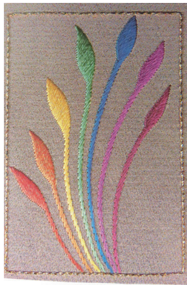
▲ 輪廓繡是最基本的重要技法之一。此鳳尾的紋樣，即運用輪廓繡由細漸粗到加寬，一氣呵成、勻稱流暢。