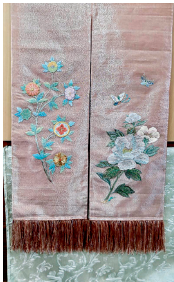
▲ 此繡作分別於民國 108 年赴泰國清邁及民國 109 年中華民國文化部人間國寶特展中展出。技法包含盤金繡、緞面繡、長短針繡、結粒繡、螺鈿等各式。

轉彎，讓其他班長錯失受訓機會，大家心生不滿，也將矛頭指向劉千韶，她莫名成了箭靶，原本的同儕好友皆對她不理不睬、冷漠以對，形同職場霸凌般的冷暴力，讓年紀不到 20 歲的劉千韶傷心不已。不能辭職，因為家裡需要這份收入，而且她也真心喜歡這份工作；但又無人可傾訴，所有委屈辛苦只能自己承擔。她告訴自己，公道自在人心，只要問心無愧，其他一切隨緣。當然，支撐她堅持下去的力量就是刺繡，由於產品供不應求，有些高難度的工作都由她負責完成，時間壓力與品質要求缺一不可，她心無旁騖，將所有心力全投注在工作之中，同儕之間的冷戰氛圍，似