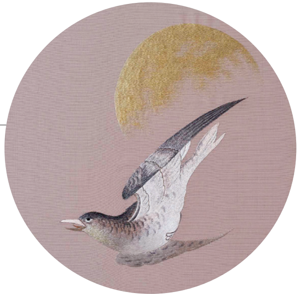
▲《歸鄉》。完成此繡作時劉千韶年僅 20 歲，聰穎早慧，藝術天分展露無疑。

「繡」，即藉由繡針，引金、銀、絲、棉等各式線材，將圖案繡至布料上的一門技藝。刺繡最初的目的是為了「禦寒」，因古時人們生活貧苦，遂以棉線縫製圖案