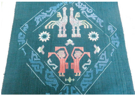
▲ 技法包含人字亂組繡、三本人字亂組繡、編織繡、管繡……，其中的編織繡法是按經、緯線穿梭交織程序進行編排繡做，繡面變化豐富。