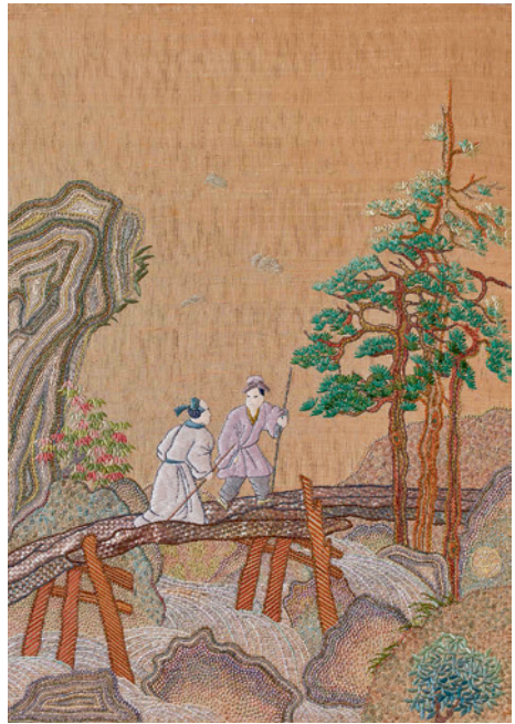
▲ 《過雨看松色》。綜合各式技法，在傳統之中注入創新的精神及元素，曾獲日本美術大賞比賽入選獎項。

繡、刻鱗繡、管繡、長短針疏密繡、網繡等創新技法，突破傳統框架，作品尊貴雅致、質感非凡。尤其稀有的帝王紫染料，是以特殊骨螺所製成的礦物性染料，可出現 6 色漸層，層次變化豐富多元。此作原為龍與鳳兩幅獨立繡作，後來組合成為對屏，描述人間追求圓滿生活的象徵。