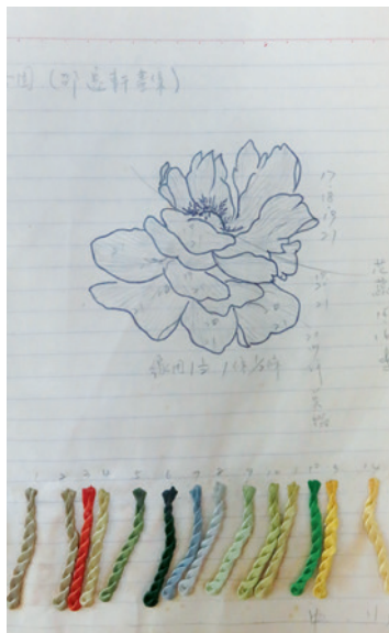
▲ 劉千韶早期學習刺繡時的手繪圖稿。