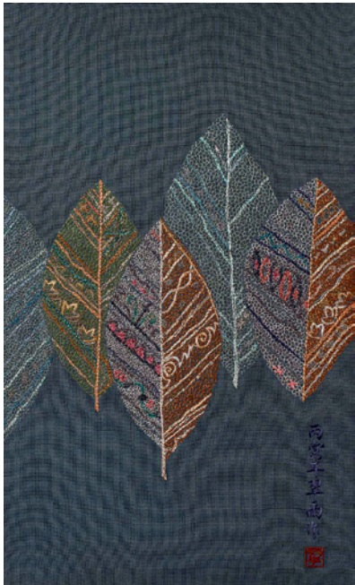
▲ 《蛻變》。運用不規則網繡針法表現葉脈的纖維，以跳脫傳統刺繡的綿密感，表達其穿透性與現代氛圍。