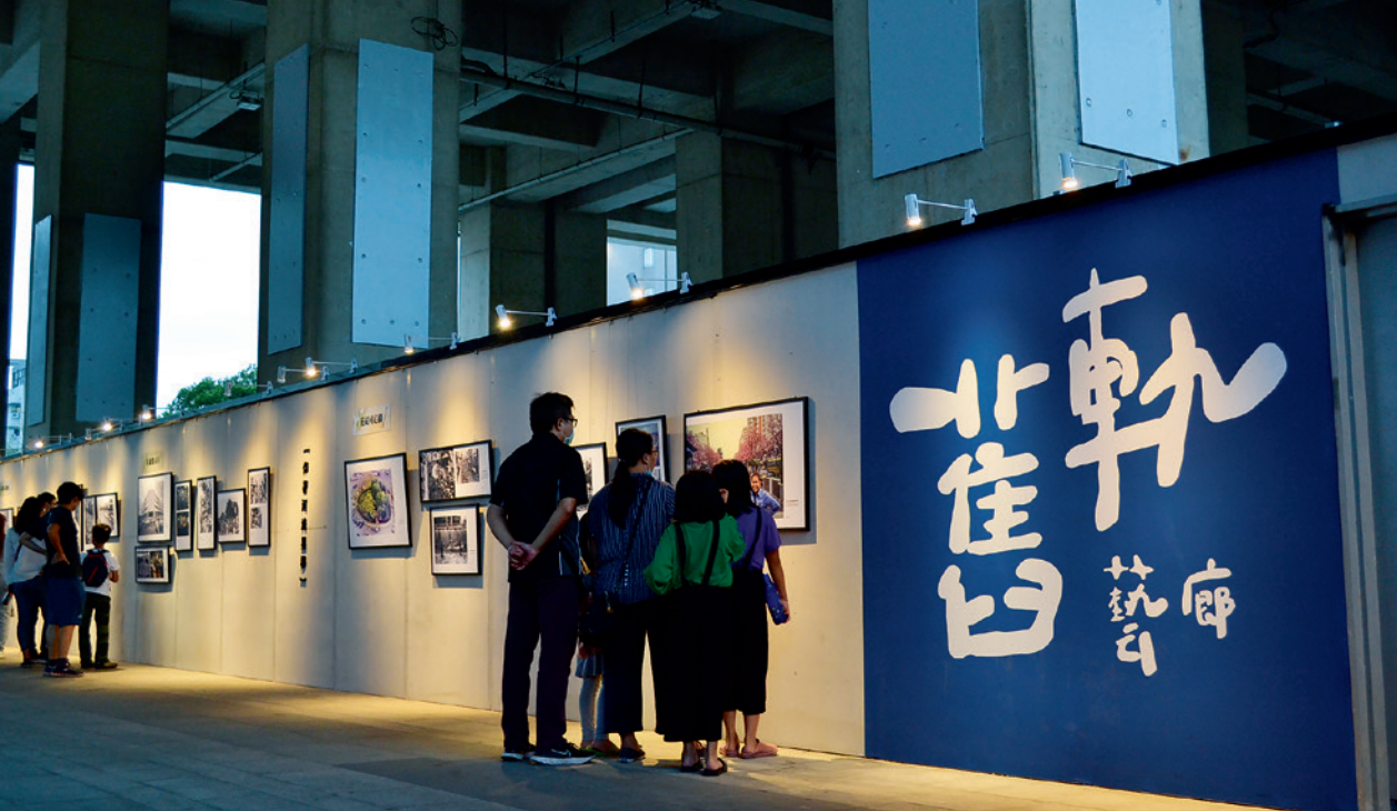
▲ 鐵路高架橋下變身為「舊軌」藝廊，一幀幀「影」藏著臺中歲月的老照片，彷彿讓人走入了時光之旅。

裡外籍移工的聚會之所，這裡已逐漸變成表演者的舞台，成了鬧熱的假日市集，更成了臺中市民的散步好去處。於是大家很悠閒的攜家帶眷，三三兩兩來此喝個露天下午茶，也可以邊看表演邊在車站市集裡尋找好物，這裡變成了飲、食、遊、購、樂的好去處。