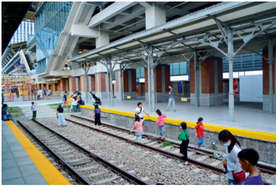
▲ 舊鐵軌變成大小朋友的平衡木，當月台不再迎送南來北往的火車和旅客，舊鐵軌也成為臺中市民的新樂園。