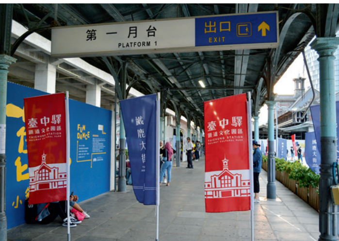
▲ 昔日的月台，如今變成了表演愛好者了「排練區」。