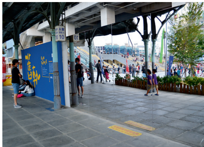
▲ 舊月台上大片的鏡子讓愛秀的青春男女可以盡情地揮灑，也將行人的身影變得有趣。