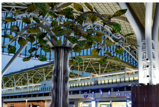
▲ 「臺中車站」在霓虹燈火的映照下更顯明亮。

中的地景。這座世紀風華的車站乘載著層層堆疊的百年時光，並將其衍生而出的歷史文化風情以光陰隧道的閃亮片段留在臺中的城市「記憶」裡。如今，這座已經行駛超過百年的列車，正以全新的面貌重新出發，即將邁入下一個百年經典的起點。🌀