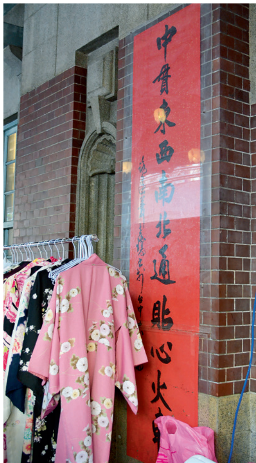
▲ 臺中火車站舊站入口，書法家揮毫的大紅楹聯還完好如新，但昔日旅客穿梭的門廊如今已變成假日市集。

和官署建築間區域為中心作為規劃方向，讓車站自此之後成為城市的中心。戰後，隨著經濟快速發展，因應城市人口聚集的效應，以及日後捷運、高鐵、臺鐵捷運化等工程的需要，臺中鐵路高架捷運化工程也在民國 98 年開始動工，同時於第二代車站的東北側規畫第三代臺中火車站的新建工程，新站體於民國 101 年 9 月興建。