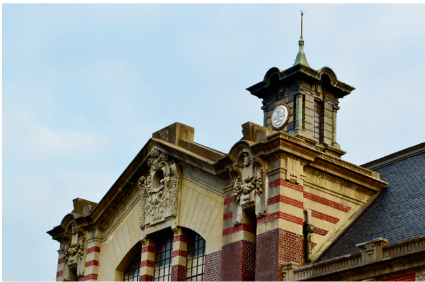
▲ 臺中火車站舊站為後期文藝復興式建築，其建築主體和外牆為紅磚造，有突出屋頂天際線的中央塔樓，十分華麗，凸顯車站建築的特殊與醒目標誌性。

飾表現；車站入口雙柱和站內的空間立柱亦有繁複變化；屋頂為洋式木構造急斜屋頂，屋脊設有突出屋頂天際線的中央塔樓，亦稱鐘樓，十分華麗，凸顯車站建築的特殊與醒目標誌性。為配合建築本體，正面前側後期加蓋的長廊形成連續性的秩序，木造簷廊下的木柱也仿西洋柱式，基座、柱頭及橫樑接頭均有裝飾並以鑲嵌方式構成，做工極為精細。整個車站建築在裝飾細節上更出現許多本土元素，如柱頭、山牆的香蕉及鳳梨等圖案，皆是表現臺灣風土物產特色之裝飾元素。第二代臺中火車站與當時的臺灣總督府（今總統府）同為後期文藝復興風格的「辰野式」建築。所