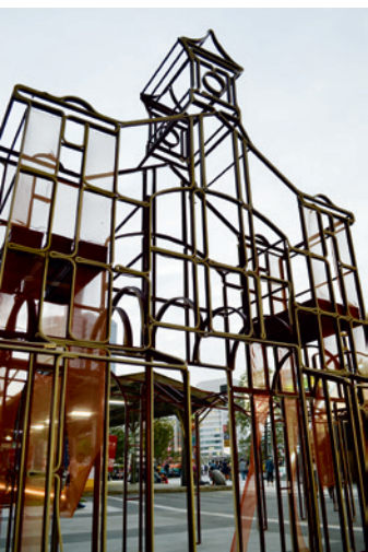
▲ 新站與舊站的交接之處，矗立著一座以舊站站體為模型的鋼架創作。

中的地景。這座世紀風華的車站乘載著層層堆疊的百年時光，並將其衍生而出的歷史文化風情以光陰隧道的閃亮片段留在臺中的城市「記憶」裡。如今，這座已經行駛超過百年的列車，正以全新的面貌重新出發，即將邁入下一個百年經典的起點。🌀