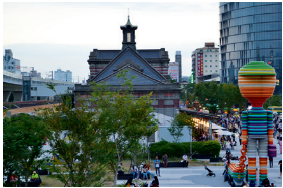
▲ 臺中火車站舊站為五光十色的街景增添幾許典雅的西洋風情。

軌上玩起走平衡木的遊戲，當月台不再迎送南來北往的火車和旅客，舊鐵軌也正成為臺中市民的新樂園。