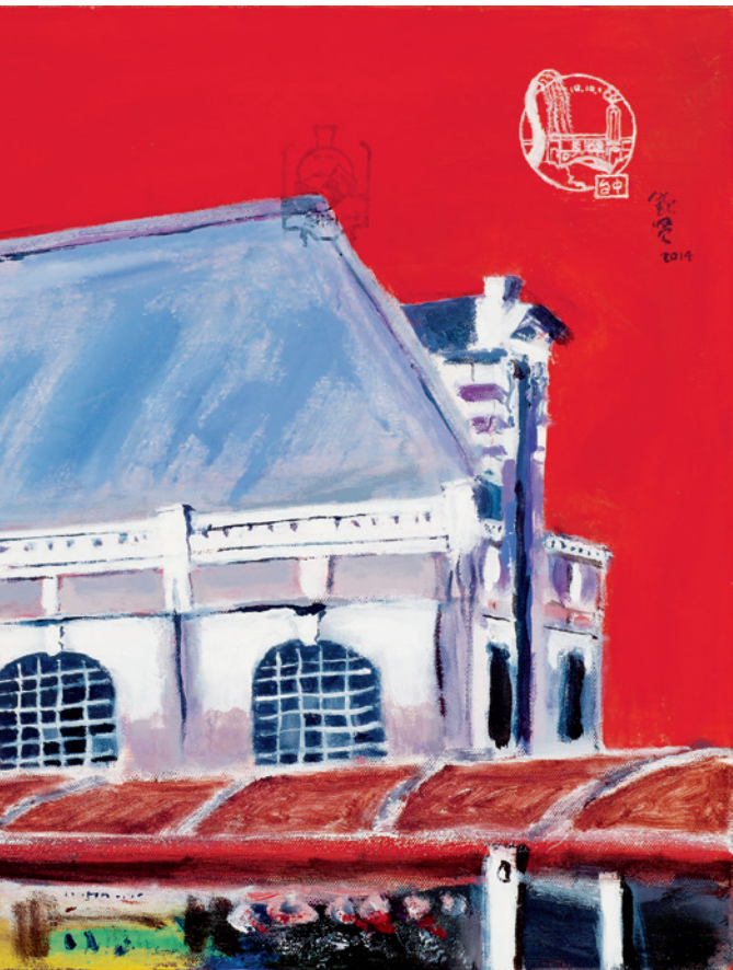
▲ 臺中火車站經歷一世紀的風霜，更顯穩重。（李欽賢繪）。

臺中火車站自西元 1905 年 5 月誕生，遠在臺灣縱貫線鐵路通車之前，係為配合臺中豐原至彰化二水間鐵路通車而興建，原稱「臺中停車場」。臺中火車站屬於木造洋風建築（位置在今日車站的西南側），站區還興建了火車頭的機關庫，雖年代久遠卻有幸留下歷史的影像，與今日碩果僅存的臺鐵「海線五寶」－談文、大山、新埔、日南、追風 5 座木造車站的樣式有相近之處。且第一代臺中火車站經歷了西元