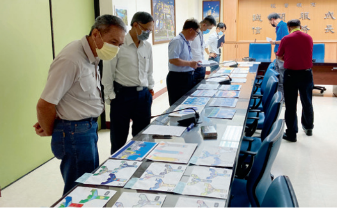
▲ 南部發電廠評選畫作。

代瑰麗的摩天輪；更有屬於高雄最美的大海靜靜波濤，如同電廠靜靜地守護著高雄夜晚燈火的璀璨；有孩子們最喜歡的寶可夢精靈球，是他們純真童年最美好的歡樂時光；有化身為火箭、鉛筆與飛魚的煙囪，也有充滿海洋生物的奇幻世界；有一年四季不同的景色，彩繪著電廠煙囪春夏秋冬不同的風貌。