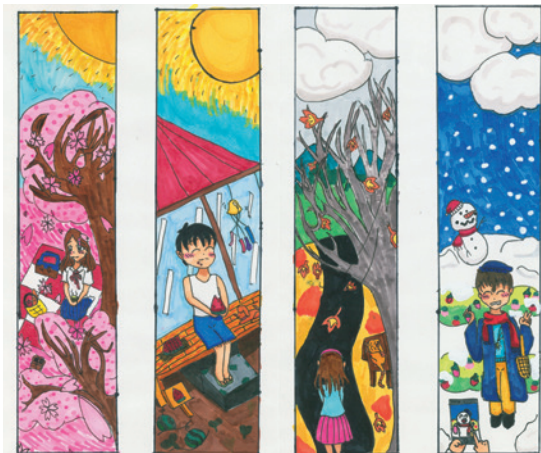
▲ 電廠煙囪的彩繪，讓孩子發揮他們無限的想像力。