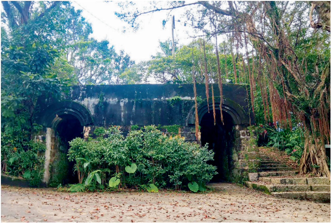
▲ 位於基隆南邊的獅球嶺砲台，現已是人跡罕至的古蹟。