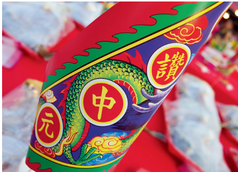
▲ 基隆中元祭是紀念先民如何弭平族群間衝突，喚醒族群命運共同體的體認。