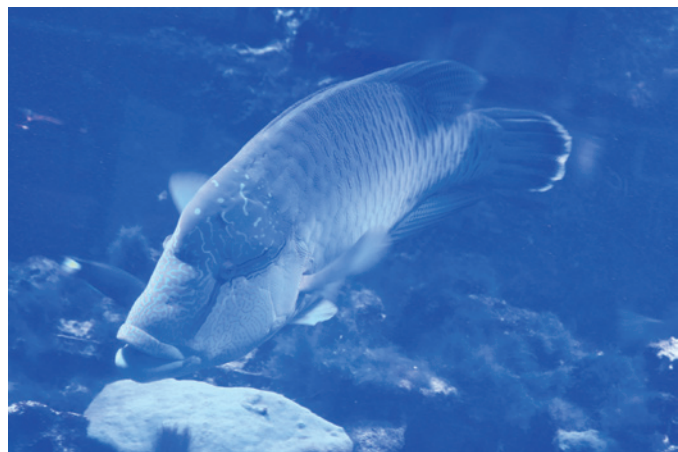
▲ 海洋中心的「鎮館之寶」，一隻威風凜凜的「龍王鯛」，它是世界上體型最大的珊瑚礁魚類。

在「潮境公園」的每個角落，近距離看腳下番仔澳灣周遭海岸地質及生態景觀，「海蝕平台」是一大特色。由於海岸的岩層在長期風浪的侵蝕下凹陷、崩塌，形成陡峭的「海蝕崖」，當高處崩落的巨石堆積在崖腳下，經年累月形成與海平面高度相差不多的平地，這就是「海蝕平台」。其實這些「海蝕平台」的表面一點也不平坦，因侵蝕作用形成像波浪般的規律起伏，因此又有「魔鬼洗衣板」之稱謂。