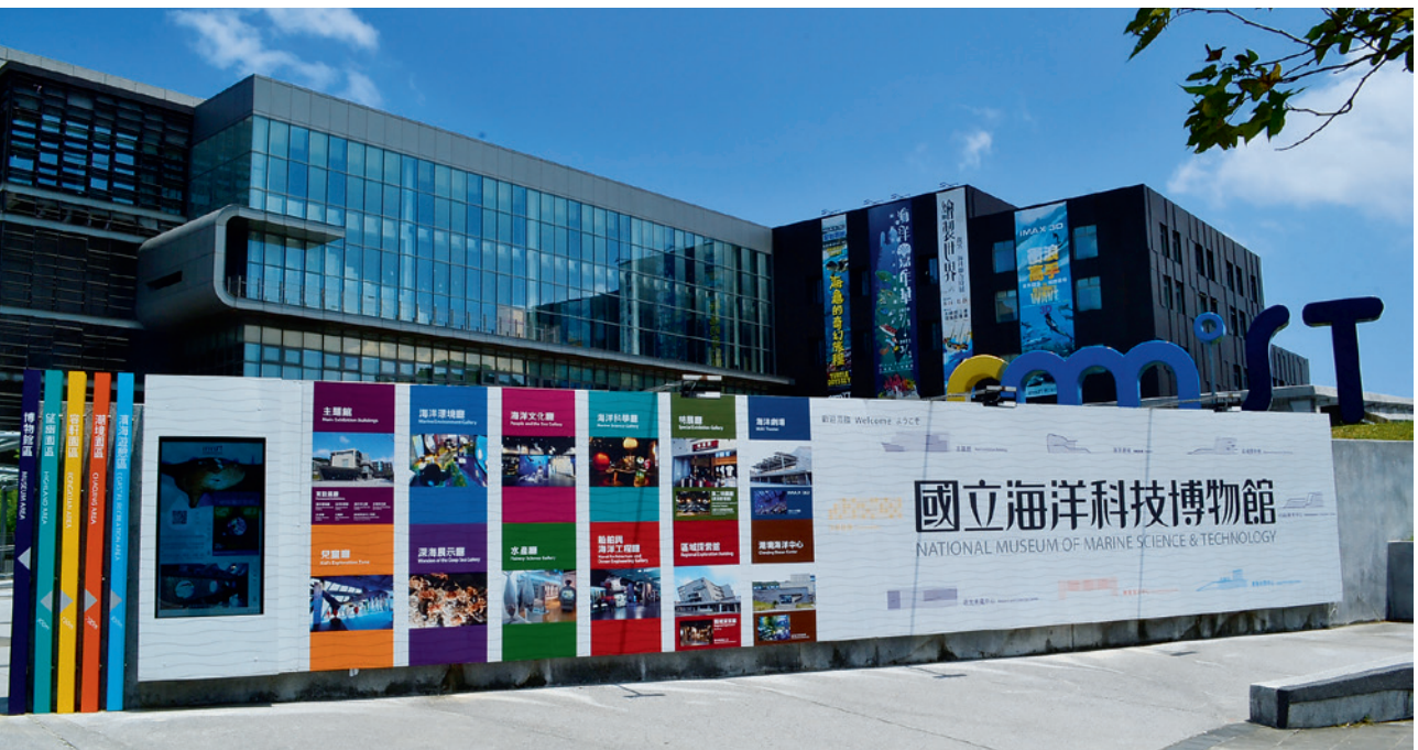
▲ 國立海洋科技博物館是一座兼具展示、教育、研究、蒐藏、休閒娛樂等多功能的海洋博物館，其使命就是喚起民衆「親近海洋、認識海洋、善待海洋」的意識，讓海洋得以永續發展。