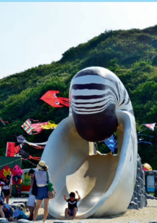
▲巨大的鸚鵡螺造型的溜滑梯是小朋友的最愛。