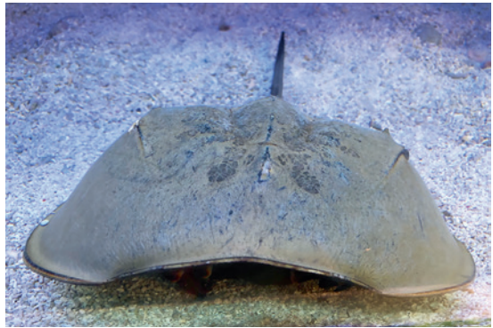
▲ 有「活化石」之稱的鸚，在臺灣本島海域已難覓蹤跡。

的潛水地圖，明確標示出可以潛水的安全水域，並規劃設置專屬潛水路線，引導健康安全且對海洋環境友善的潛水活動。未來還將制定保育區內相關遊憩活動（包括潛水、浮潛、自由潛水等）的管理辦法及納入總量管制的可行性，讓海上觀光休憩和海洋保育相輔相成獲得雙贏，促使這塊臺灣最小的保育區能有最大的成果。