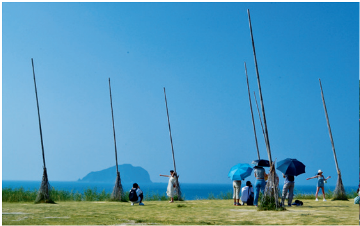
▲ 潮境公園最吸睛的地標是被網友戲稱為「飛天掃把」的裝置藝術，以浩瀚的太平洋和彷彿咫尺之遙的基隆嶼為背景，彷彿從天而降一般。