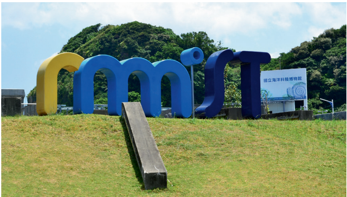
▲ 國立海洋科技博物館的巨大 LOGO，就矗立於漁港邊。

矗立於八斗子漁港邊的國立海洋科技博物館便是一個典範，這座兼具展示、教育、研究、蒐藏、休閒娛樂等多功能的海