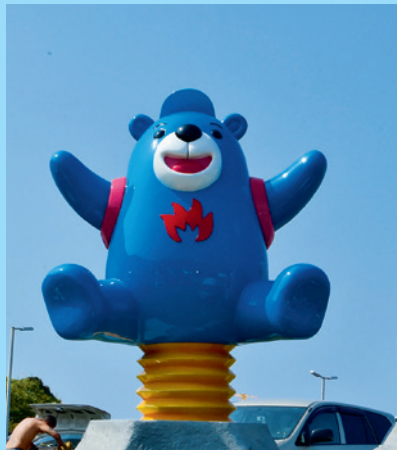
▲海科館帥帥又可愛的吉祥物「火熊」，站在潮境公園裡歡迎四方的遊客。