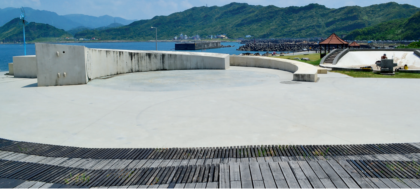
▲「潮境公園」的前身曾經是基隆市的水肥處理場和垃圾掩埋場。

極目遠眺，對岸的基隆山和半山上九份山城之風光清晰可辨，每到傍晚時分，則有迷人的夕陽將海天染成浪漫的戀愛色；入夜，基隆山旁星光熠熠的九份燈火如寶石般閃爍，更具唯美與迷人的魅力。