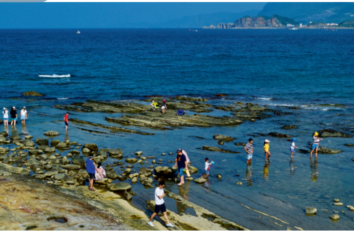
▲ 踩在「海蝕平台」上近距離觀察潮間帶生態，是一件很有趣的事，也是最好的親海教育。