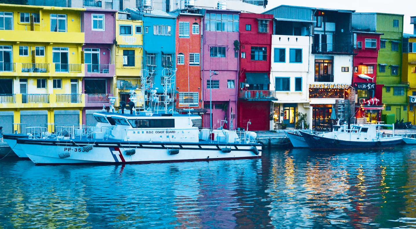
▲ 向晚時分，燈光如漁火般灑落海面，映襯出另一種靜謐的情調。

牙人與荷蘭人第三次爭奪福爾摩沙的古戰場，這場戰役以荷蘭人的獲勝號角而告終。歷史來到西元 1935 年，日本人為使和平島的交通更為便利，在有 300 多年歷史的古八尺門水道海峽上，興建了「基隆橋」（今「和平橋」的前身）。如今在社寮橋與和平橋中間的水道上，還留有一處海岸堤防，這座堤防是和平島東岸最早興建的海岸堤防，正是西元 1935 年闢建八尺門港時所興建，堤防上設有海事氣象站，在二戰時損毀，戰後重新修復，現在則是八尺門海峽最佳的觀景點。