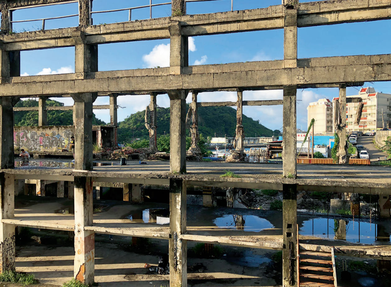
▲ 造船廠僅剩下建築的骨架樑柱，經過不斷的海風侵蝕，呈現出一種歲月滄桑、歷史痕跡的頹敗美感。

千百年來海水以她不變的節奏刻蝕著海岸線，為島嶼留下幻象萬千、足堪成為世界遺產的自然美景，也提供島民數百年來賴以生存的物華天寶。