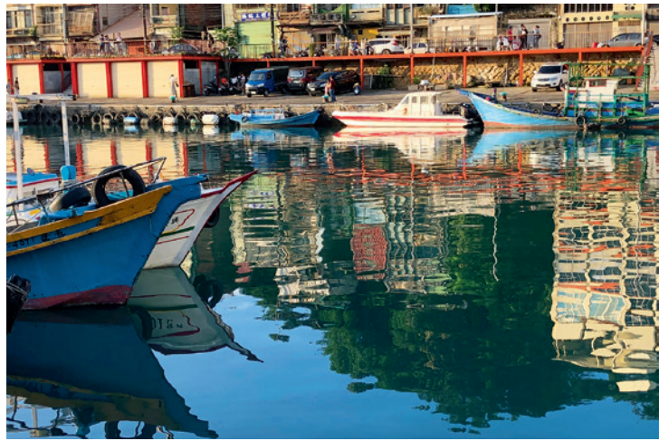
▲ 港灣內青山、色彩屋、船隻的倒影，果然水光激盪晴方好。

於是，基隆正濱漁港色彩屋計畫就成為這樣一種大膽新鮮的嘗試，同時也是一種對舊城改造的突破。根據在地的環境特色，將色彩融入到建築的外觀帶來視覺的衝擊效果，不用花大錢「拉皮」改造，也能成為地方新亮點。正是這種居民、景觀學者和學生共同參與的社區營造，讓以往只能出現在畫布上的視覺藝術與在地居民的日常生活融為一體，不但讓老漁港脫胎換骨，更成為漁港流動的「潮味」，當百年漁港變成「彩色版」，也成為行銷基隆的一張最佳名片。