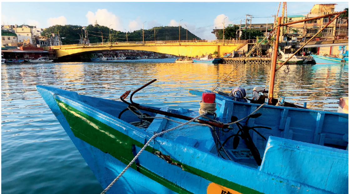
▲ 落日的餘暉把和平橋暈成了暖暖的金色。

此地的「身世」，原為曲折奇岩的嶙峋海岸。直到西元 1626 年，西班牙人在此興建聖路易斯堡 (St. Louis)，到了西元 1654 年至 1667 年間，荷蘭人趕走了西班牙人並在此興建愛騰爾堡 (Eltenburgh) 與諾貝爾堡 (Nobelburgh)。這裡曾是西班牙