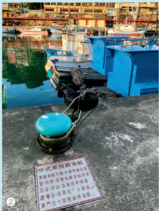
① 船身掛滿巨大的鹵素燈泡，這是很受遊客歡迎的夜釣船。