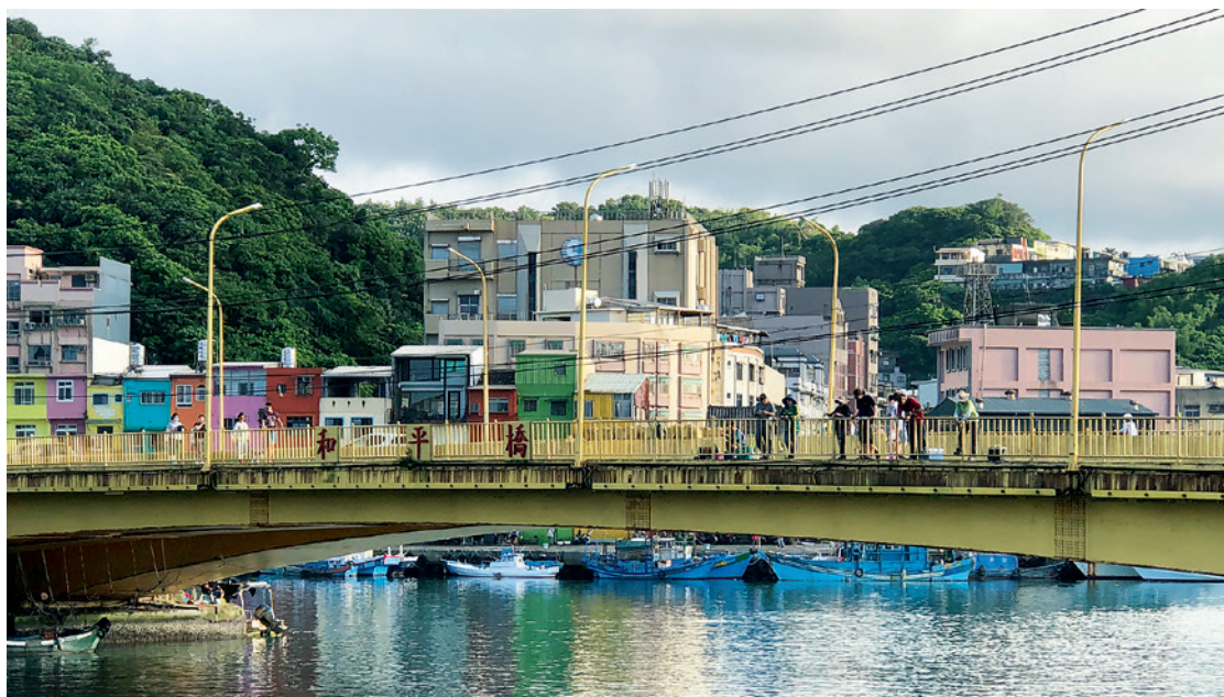
▲ 有臺灣第一座跨海大橋之稱的「和平橋」，長度僅 74 公尺，將臺灣本島與最近的一座離島和平島相連接。

港口，港口內泊滿大大小小的船隻；回頭四顧，山腰上還有寫著英文「KEELUNG」的地標看板。身後的這座山就是牛稠港山，正是閩南漁民最早踏足基隆的地方。在港口拍拍照跟隨著人潮湧往觀光客非去不可的基隆廟口夜市，才走不遠，就聞到了一股很濃厚的魚腥味，原來這裡有一條漁貨大街，騎樓下掛著生鏽的「崁仔頂街」牌子，基隆人都對這條街耳熟能詳，就是當年那些閩南漁民初來乍到基隆，上岸後逐漸發展起來的最早街市。因為靠近海口地緣的方便性，漁船可以藉港區運河通行至此，然後靠岸卸下漁獲，最初漁船與岸邊有很大的落差，漁民們便搬運來大石頭墊成石階，以方便下貨，石階在臺語中被稱