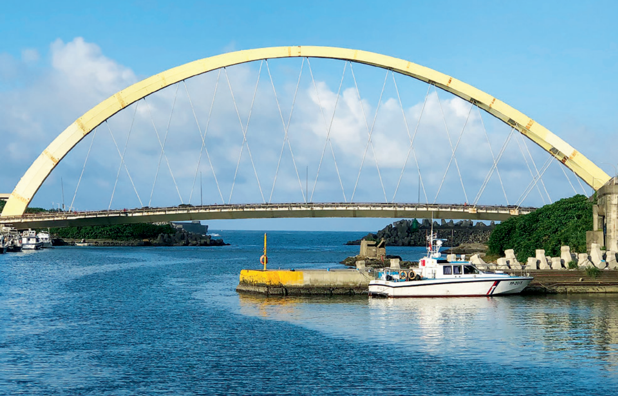
▲ 連接和平島的另一座跨海大橋「社寮橋」，橫跨八尺門海峽，拱形的金色橋身在碧海藍天下是另一道亮麗的光景。