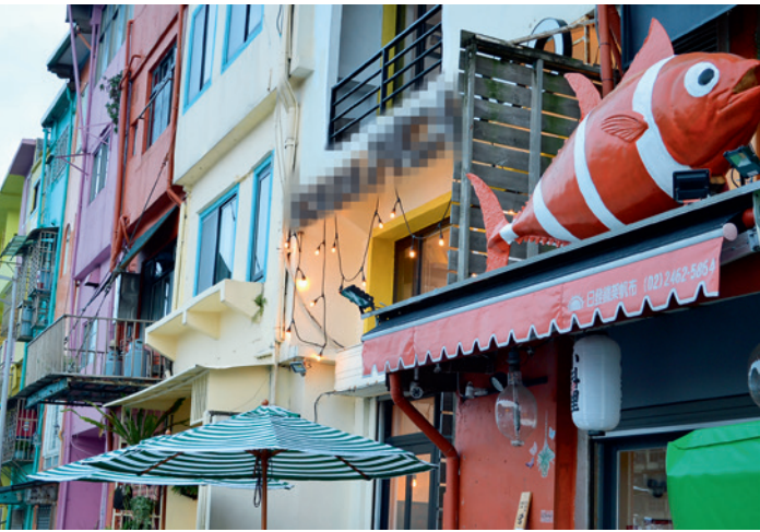
▲ 色彩屋店家門上可愛的裝飾。