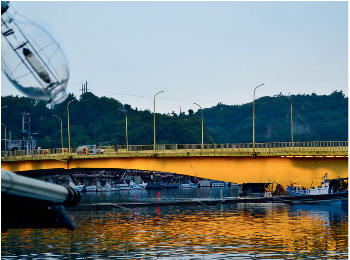
▲ 當夜幕降臨，和平橋的燈光則將海染成了橘紅色。

基隆由於東、西、南三面環山，與臺北的陸路交通幾乎都被高山阻隔，僅北面為出海口，依山傍海是基隆最大的資源。所以早期的移民幾乎都要憑藉海路進出，而和平島特殊的地形和地理位置使之成為進出基隆的「玄關」之地，當年西班牙殖民者在繞經臺灣島時也曾以和平島作為「經略臺灣」的基地，足見和平島地位之重要。而隨著漁港林立，漁船日夜穿梭，小小的和平島在一百多年前就已經發展成