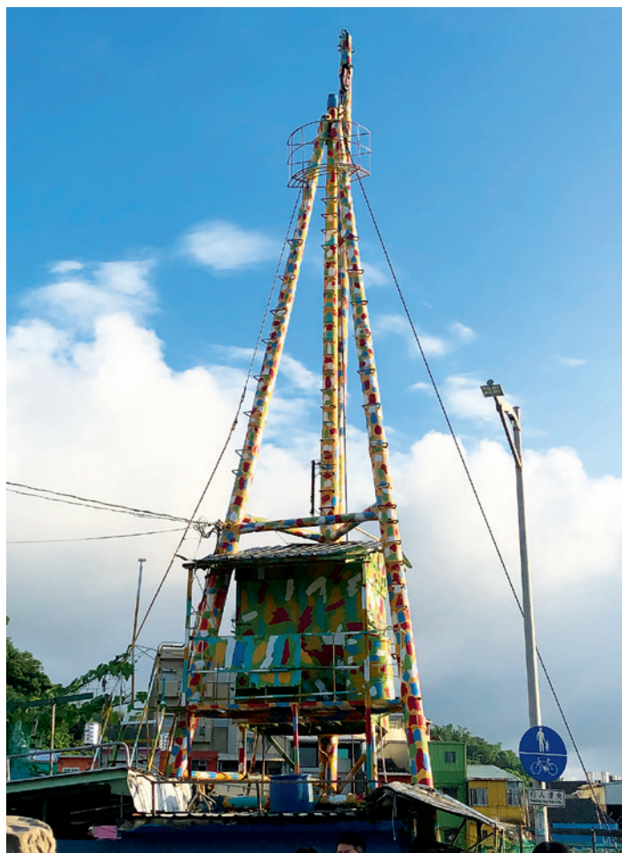
▲ 正濱漁港船桅造型的小屋，高高佇立於和平橋的橋頭。

在城市美學中，色彩無疑是最直觀也最能打動人心的元素。基隆靠海的得天獨厚地利雖然搶得了先機，卻也讓基隆的氣候變得多雨又潮濕，基隆向來有「雨都」之稱。一年中有將近兩百個日子籠罩在煙雨當中，多雨的天氣不但為住民的生活帶來不便，也讓城市建築顯得破舊單調。從以前到現在，基隆蓋房子首要的就是做好內外牆的防水，早期都塗柏油來防水，所