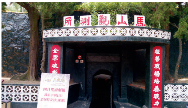
▲ 馬山觀測所成為電視劇拍攝場景。