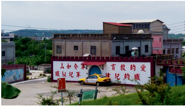
▲ 軍隊規條成為金門特殊景象。