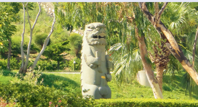
▲ 處處可見守護金門的風獅爺身影。