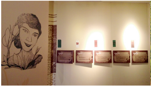
▲ 特約茶室內展示侍應生不同時期的票價表。

昔日曾在坑道內度過漫漫軍旅生涯的退伍弟兄，依然是鏗鏘有力地訴說著昔日坑道內的點點滴滴，留駐寶貴的坑道追想曲。