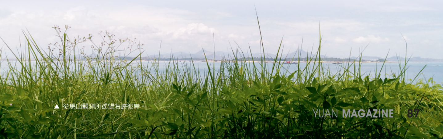
▲ 從馬山觀測所遙望海峽彼岸。