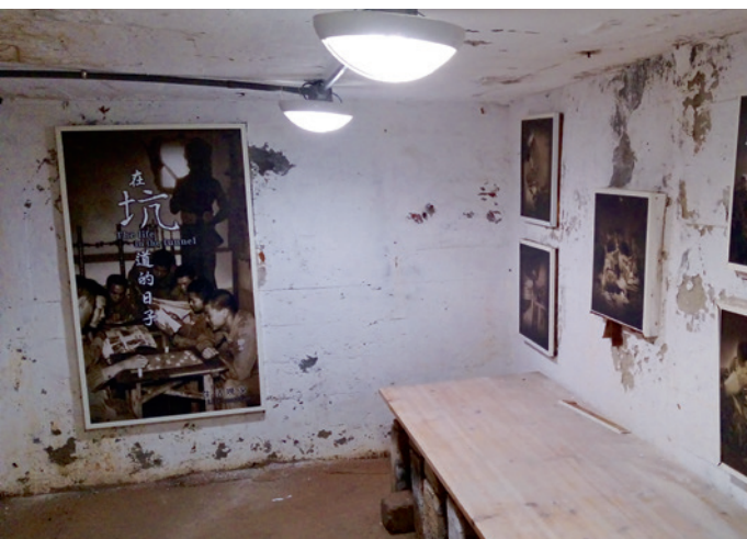
▲ 昔日隱密的坑道，今日已成觀光景點。