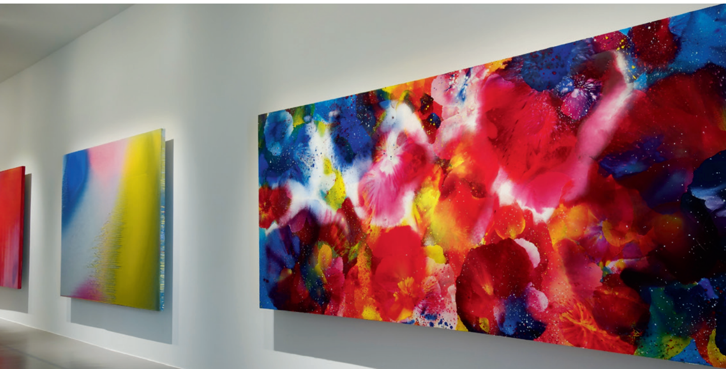
▲ 江賢二 〈比西里岸之夢 09-07〉（民國 98 年）油彩、絲綢。

以在臺東創作，真的非常幸福。」。他的幸福得早上 4、5 點就起床等天亮，迫不及待地走進畫室，揮下他的第一筆。