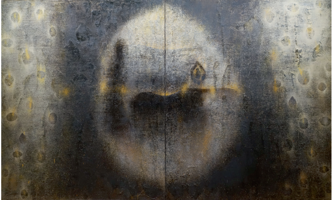
▲ 江賢二 〈百年廟 99-02〉（民國 88 年）油彩。

年後在紐約的〈淨化之夜〉（民國 76 年）所流洩的是如音樂旋律般的迴旋自如的樂章，在色與形，在線與面中，在藍色的深深淺淺、層層塗抹中，彷彿流淌出迂迴的白色線條的淨化獨白。