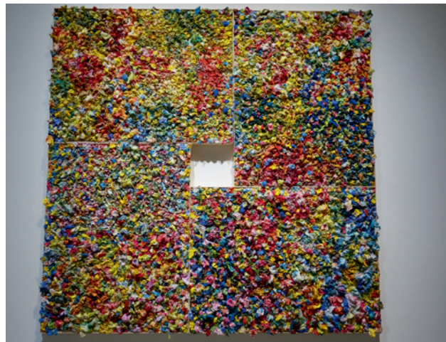
▲ 江賢二 〈金樽春〉(民國 108 年) 油彩、複合媒材。