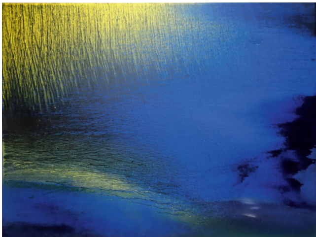
▲ 江賢二 〈比西里岸之夢 15-58〉(民國 104 年) 油彩、畫布。

臺東果真是江賢二靜心的好所在，大自然的藍天、日頭、白雲、大海、高山、植物等，日月星辰之光，山川湖海之美，季節更迭之態，不斷地向他傾吐。他不忘在每天作畫完畢，黃昏時靜靜地坐下來，靜觀彩霞滿天，聆聽光與彩的對話。當他臣服於大自然，大自然也餵養他的心靈，讓他盈滿充沛的能量，淨潔的靈思，激發他不止息地揮動彩筆。江賢二每每衷心讚