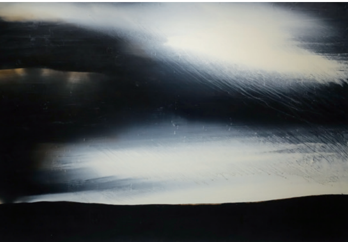
▲ 江賢二 〈銀湖 07-08〉（民國97年）油彩、畫布。

江賢二往返臺北與加州洛杉磯，展出〈加利福尼亞〉系列，而〈銀湖〉系列是他某日夜裡忽見住家附近，一個偌大的蓄水庫，水面上映著月光的清輝，莊嚴得如湖上的水月，令他悠然神往。許是那一夜沁涼如水的月光的纏綿，讓他蓄積了30多年的能量之水，大口傾吐而出，自民國96年起，創作了〈銀湖〉系列，那是他內在精神能量的核爆，沒有壯麗輝煌的顏色與線條，只是黑白的色調在湖的流淌中興起了漣漪的波光，白與黑虛實相生，相容相滲，層次豐富，凝塑了湖水的豐饒意象，有如馬勒第五號交響曲的柔版樂章，流洩出綿綿密密的溫柔。湖面如淨，月光如水，靜中寓動，波光粼粼，猶似化外之境，寧靜空靈，一股清淨的靈氣，彷彿由畫面盪