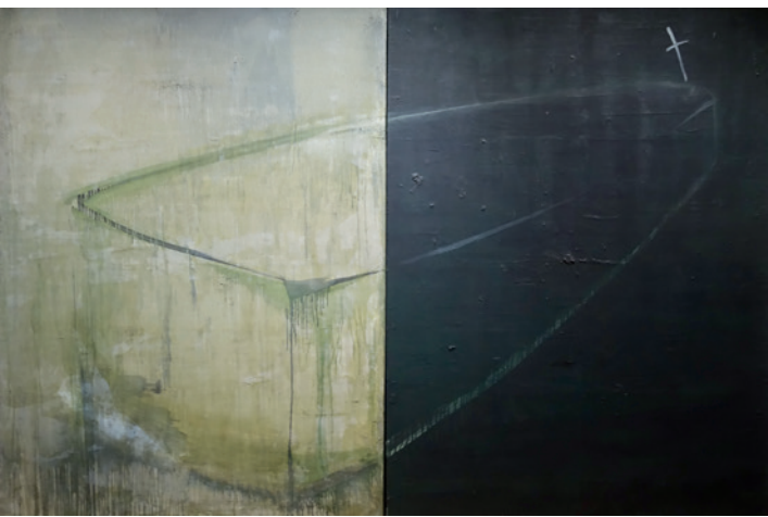
▲ 江賢二〈遠方之死 83-03〉(民國 71 年) 油彩、畫布。

也許在時光流轉的縫隙裡，江賢二的內心始終被壓抑的情緒所漲滿，就在他鎮日面對空白畫布的舉手投足的瞬間，內爆而出的虛筆實線從縫隙中汨汨流出，那是一種混融著孤獨感與荒謬感的情愫，往往淹沒了他的畫布，又凝止為幽黯玄冥的畫面，映現出生命中至簡至淨的靈光。就是那乍顯還滅的一縷靈光，若存若亡如游絲，穿越他的生命行旅。