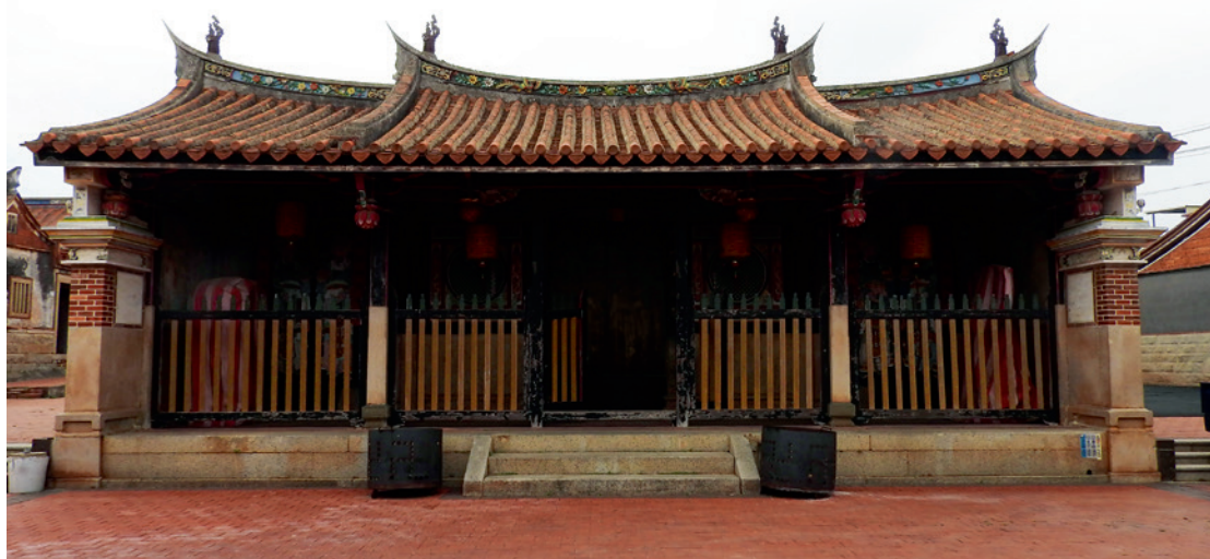
▲ 蔡氏家廟，看見蔡氏家族文武世家。