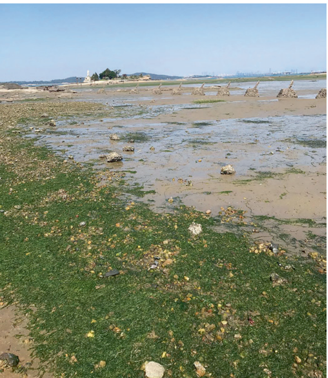
▲ 以石蓴、浒苔等為主的綠色藻類，展現蓬勃生機。

老師帶著孩子來觀察木棉花的生命歷程；更有媽媽帶著孩子來寫生，大膽的用色，卻那般自然的把木棉的嬌豔，從畫紙上，躍然而出。