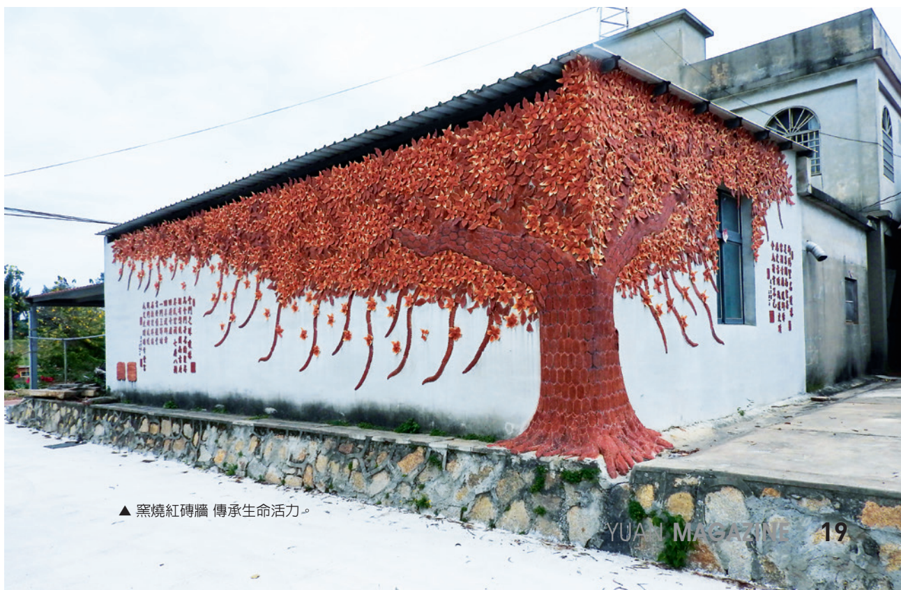
▲ 窯燒紅磚牆 傳承生命活力。

金門的四月，吹拂溫柔的風，陽光時而露臉，時而匿藏，但文化的馨香都在島上這一群善良的民衆身上傳承，栗喉蜂虎輕柔的鳴唱聲，繚繞在島嶼間，南方來的鳥朋友喜歡這一座島，歡迎喜歡金門的旅人慢遊金門，駐足親吻泥土的香氣，貼近土地，讓心醉在自然的金門，重新體驗金門人的熱情，與對文化傳承的堅持，誠懇的對待土地，和大自然一起水乳交融。源