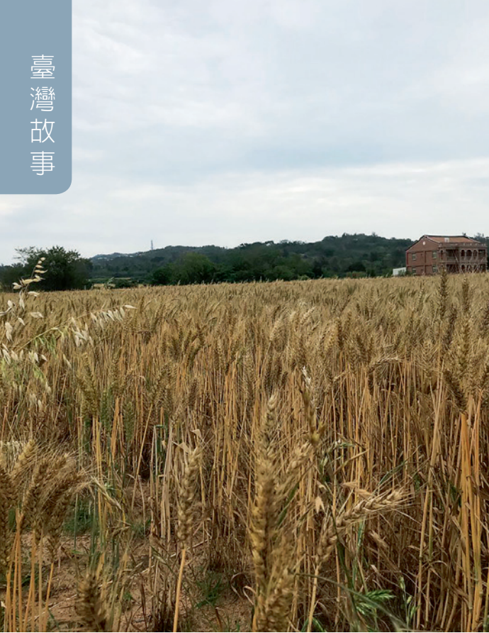
▲ 垂下腰桿的麥浪，讓人學習謙遜之禮。

好舒服！據說棉絮拿來做成枕頭心，非常的適合，因為溫度恰好，不會睡得昏沉沉的，是彈棉被的熟手說的。