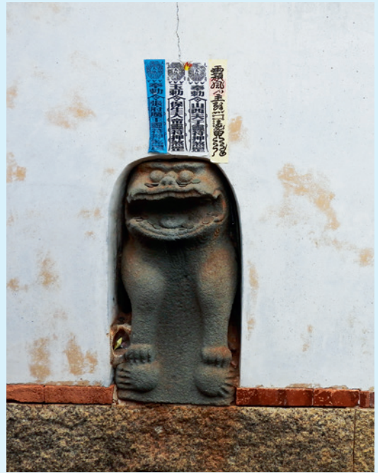
▲ 鎮風防煞的牆上風獅爺。

在「蔡氏家廟」的後壁上，鑲嵌有一尊風獅爺，因其前面為巷道，為防路衝而設置，主要功能即針對巷道以防衝煞，村民也常會來祭拜，據說小兒有時「臭嘴角」（現在稱為「鵝口瘡」），都會帶餅干來拜，並以祭拜過的餅干在小兒的嘴角擦拭。