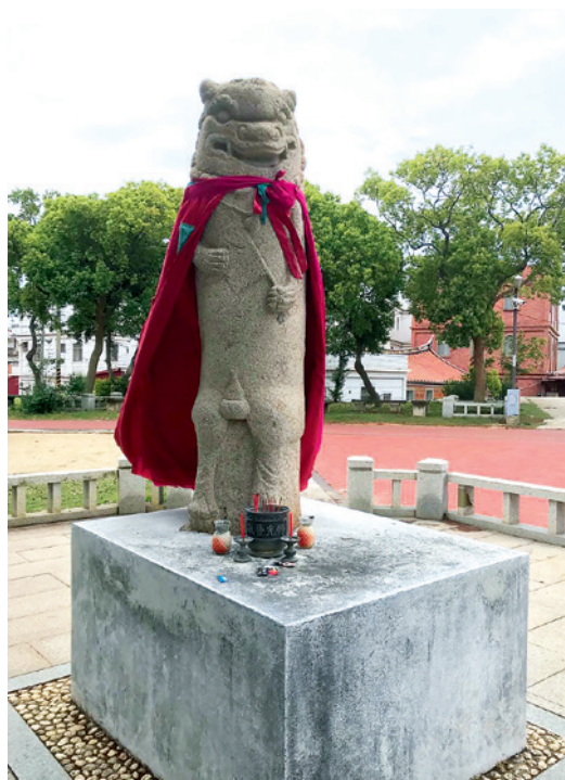
▲ 東北風獅爺象徵守護聚落。

金門早期因為風沙危害，所以許多村落在東北方向，常會豎立風獅爺鎮守以防風害。瓊林聚落在村的角落、水邊或巷衝也設立了風獅爺，在東北處設有一尊風獅