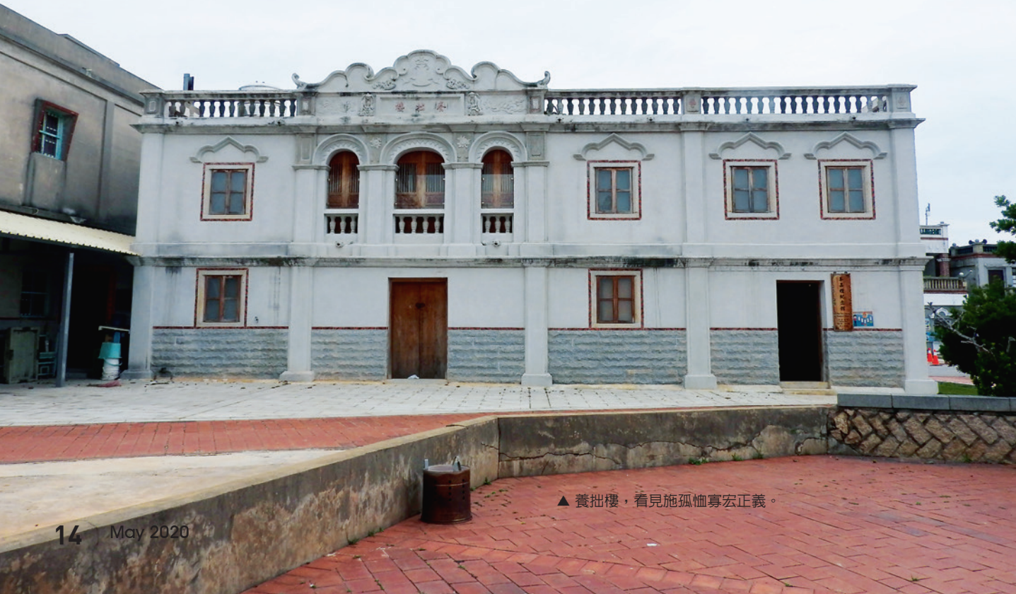
▲ 養拙樓，看見施孤恤寡宏正義。