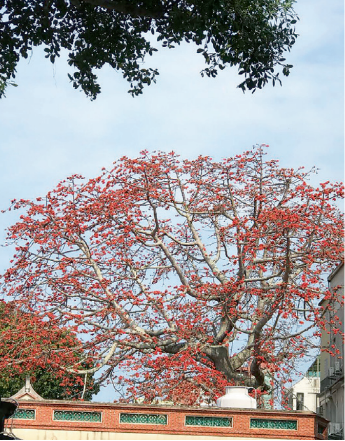
▲ 燦爛木棉，點綴金門的天空。