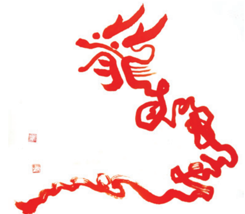
▲ 廖燦誠 〈龍成帝影(影帝成龍)〉。

例如民國 102 年蛇年，廖燦誠一人分飾法海和尚、青蛇、白蛇角色，表演〈白蛇傳〉，之後再揮毫。民國 103 年馬年，他表演唐三藏取經，完成後再抓著抹布，在鋪著宣紙的地板上揮寫，他左手抹，右手抹，抹來抹去，終於抹出以如意兩字為主，含涉龍馬意象的〈如意龍馬〉。民國 105 年猴年，他先以雙節棍舞出一段太極舞，舞畢他右手握三隻筆，左手摸著紙的位置，順勢在地板上揮寫出含藏著孫悟空的臉，右手握著如意棒，如畫如字的〈申猴王〉。民國 106 年雞年，他先表演一段聞雞起舞太極劍後，再一筆揮出蘊含著龍意象的〈世界之光〉。