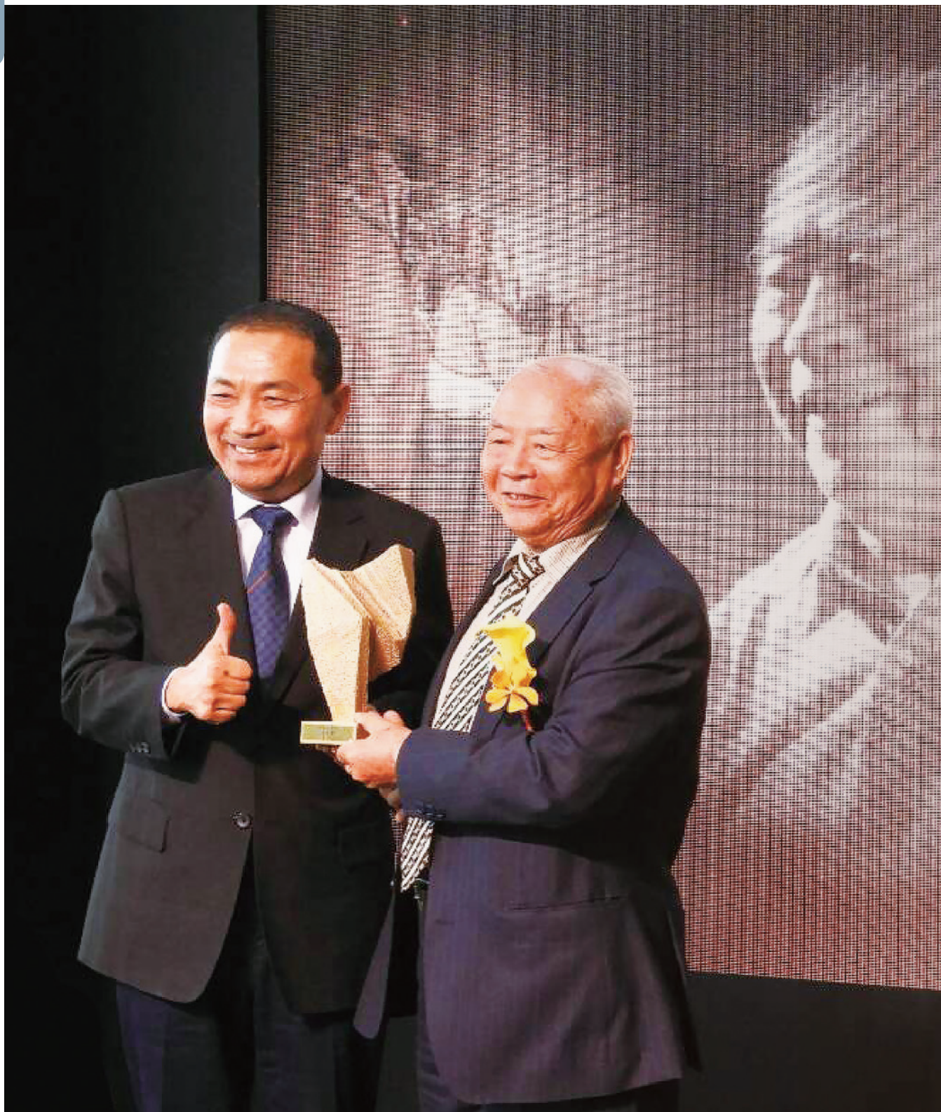
▲ 民國 108 年新北市文化貢獻獎頒獎典禮，莊武男大師與新北市長侯友宜合影。