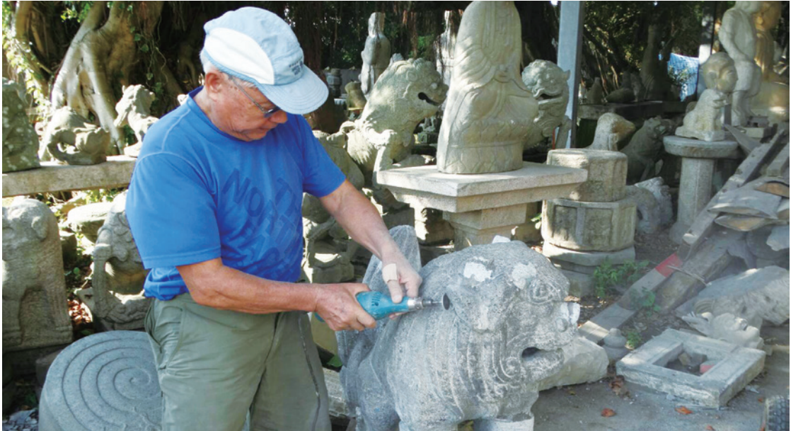
▲ 以電鑽為珍藏的石獅作品進行修復。

類別大致分為三大類。一為「北式」：顏色以紅、藍、綠三色為大宗，圖騰則多為龍、鳳，用色簡約大方，展現尊榮華貴之氣，舊時代的北方宮殿建築尤為代表。二為「南式」：跳脫傳統彩繪窠臼，色彩明亮、花樣豐富，圖騰多為人物、花鳥等，取材多元、畫風精巧華美，筆觸嚴謹細膩，令人目不暇給。另有一派為「蘇式」：可以說是「南式」的延伸，色彩鮮明活潑、構圖新穎，層次更多元，工法也更為繁複。