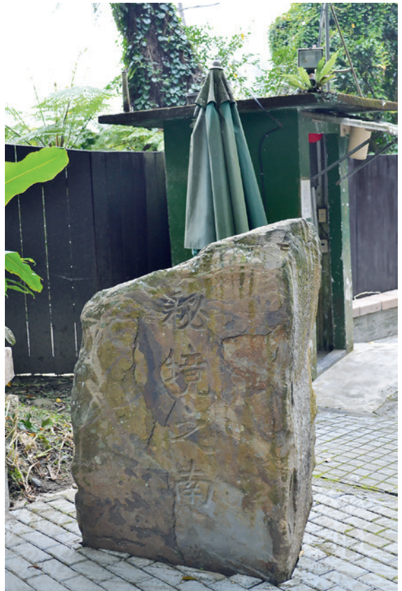
▲ 入口的「秘境之南」大石，平添了幾分文學氣息。

這時，有人問為何還不見後慈湖？導覽志工說過了前面的慈湖橋就是了，只見一座布滿青苔的小石橋與路面齊高，橋的一側刻著「慈湖橋」和「中華民國五十一年十一月」字樣，顯見此橋年代的久遠。橋頭還立有一塊螢火蟲復育區的牌子，導覽志工說這裡因水質純淨入夏以後是螢火蟲的天堂，所以園區也會在夏季開辦賞螢行程。