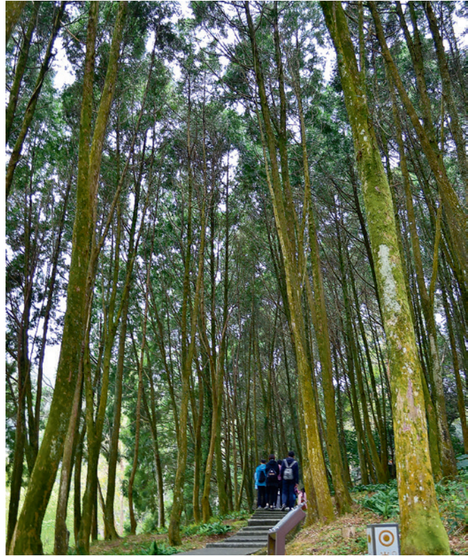
▲ 肖楠森林是後慈湖的另一處秘境，生長在 1 號辦公室和 2 號辦公室之間的山坡地。