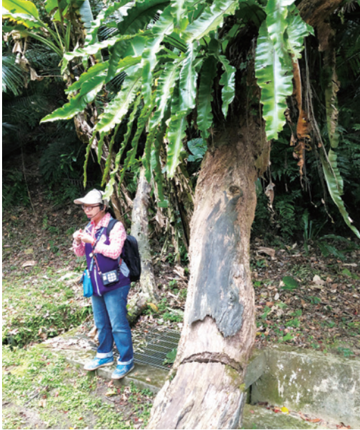
▲ 頹倒的大木在園區內隨處可見，但經過時間的累積已變成其他植物的搖籃。