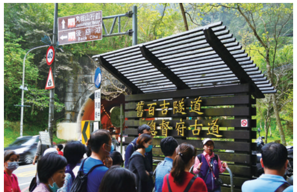
▲ 北橫公路的百吉隧道口旁就是進入後慈湖的步道入口。

我們沿著隧道上方的木棧道進入百吉林蔭步道，這條林蔭步道最早叫做「石龜坑古道」，臺語稱其「蹦孔歧」，全長約 3 公里，是一條 O 字環狀路線。古道的最