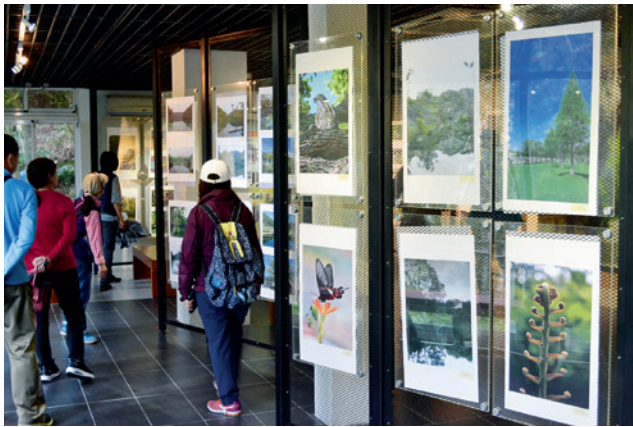
▲ 這是由 5 號辦公室改成的後慈湖生態藝廊。