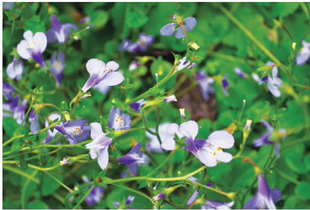
▲ 開著淡紫色小花名為「通泉草」的被子植物也遍布整個園區。

苔蘚般的植被，呈現灰白、暗綠，甚至淡黃、鮮紅等各種色彩，導覽志工說這叫「地衣」，是真菌和綠藻的混合體。由於「地衣」對二氧化硫相當的敏感，所以生態學上，「地衣」被當成是一種空氣品質的指標。