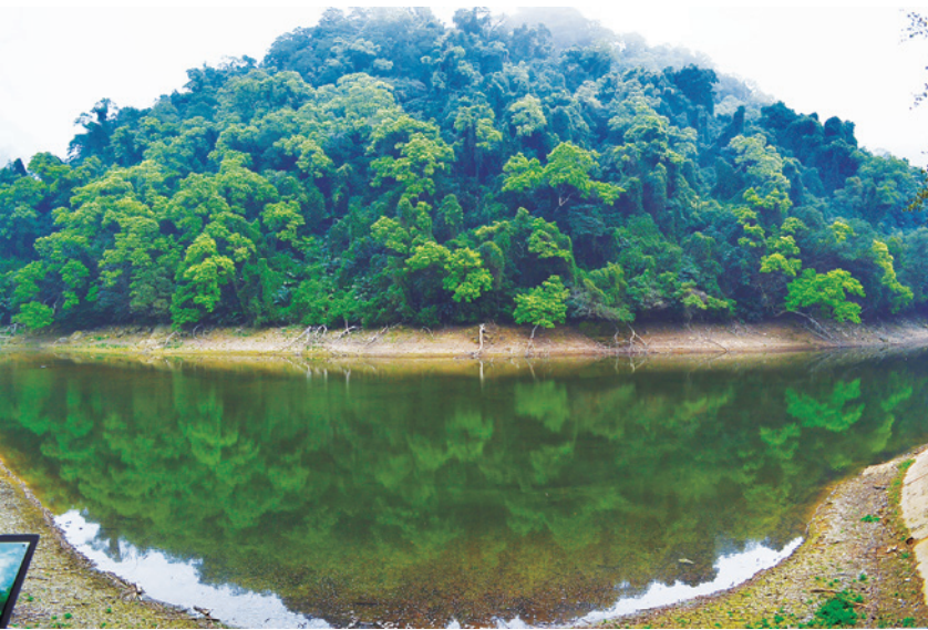
▲ 令攝影愛好者趨之若鶩的「後慈湖之眼」，據說在滿水位的晨昏或雨後，拍下湖面倒映的山色天光，就像是一幅以丹青描繪的眼眸。

後慈湖畔還種植了很多檸檬桉，這種原產自澳洲的樹會散發出一種令蚊蟲不敢靠近的芳香氣味，據說也是為了蔣夫人而種。眼前的檸檬桉樹幹直且高大，表面光滑而白皙，狀極優雅，有人說它是陸地上的「美人腿」。