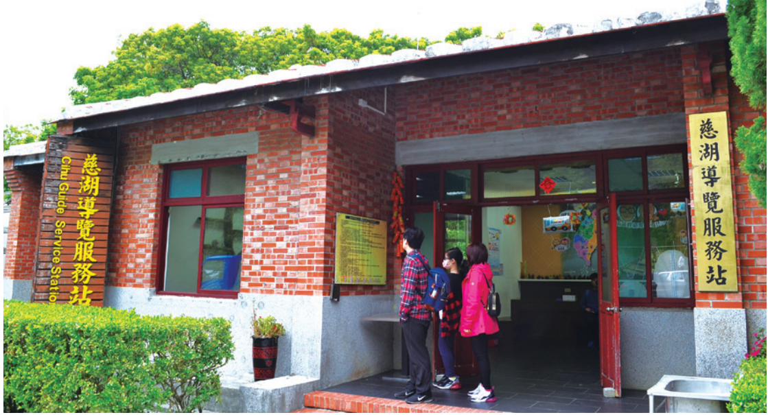
▲ 慈湖風景區專門設置了「慈湖導覽服務站」，為參觀後慈湖園區的遊客提供導覽服務。

這是徐志摩筆下的〈我所知道的康橋〉。然而這段關於「春天」的描繪、這份與大自然和諧共處的美好感受，在我走進後慈湖秘境的那一刻，竟也真實地呈現在我的眼前。