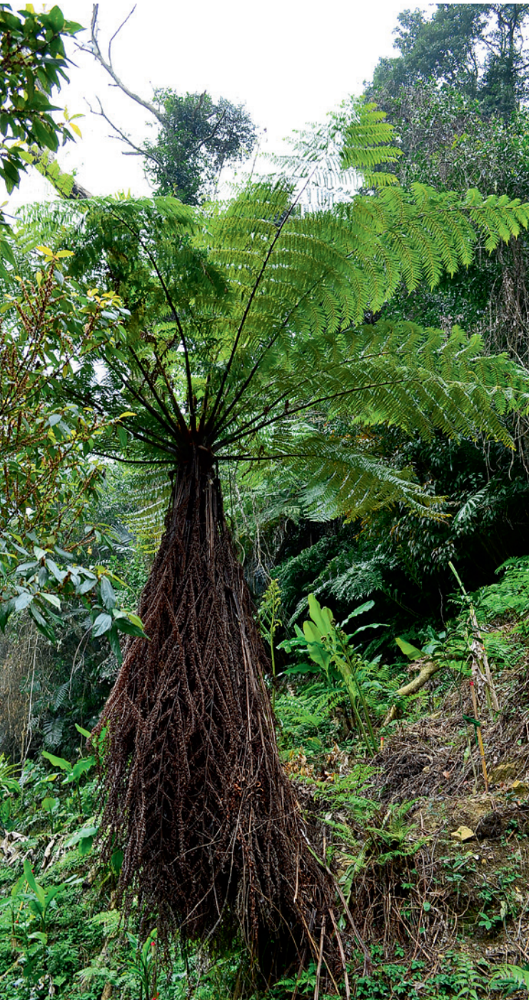
▲ 有「活化石」之稱的臺灣桫欏，臺灣人習慣稱它「筆筒樹」。

路旁有幾株高大的筆筒樹映入眼簾，它就是有「活化石」之稱的臺灣桫欏，近年由於氣候和環境的變化，筆筒樹在臺灣山野的分布數量已愈來愈少，已引起大眾關注，目前屬於臺灣珍稀瀕危植物。