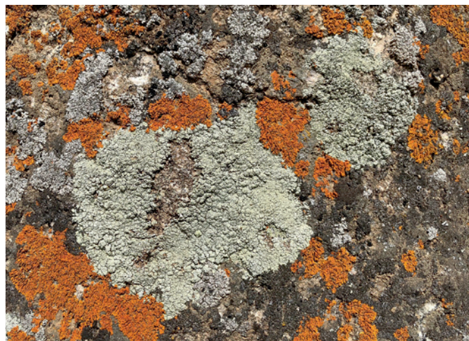
▲ 在裸露的岩石表面出現各種色彩有如苔蘚的植被，叫做「地衣」，是真菌和綠藻的混合體，被當成是一種空氣品質的指標。