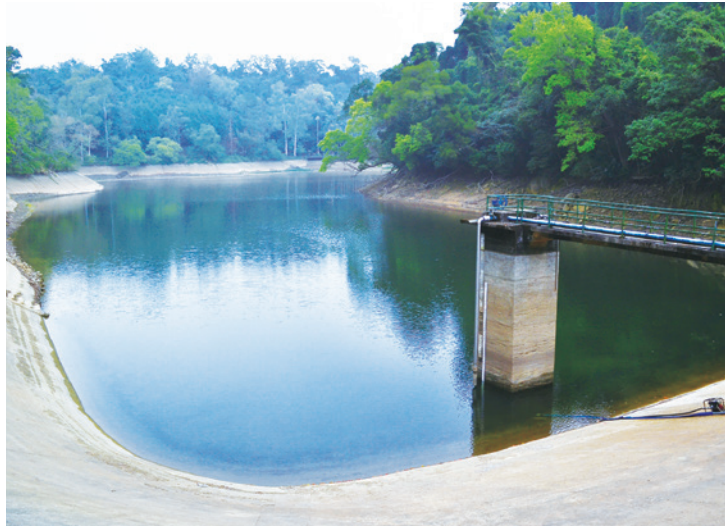
▲ 後慈湖最初是因灌溉之需，築壩而形成南北長約 400 公尺、最寬約 80 公尺的新月形狀埤塘。

高點崙頂叫做「高台」，是昔日輕便車的休息站，在日治時期叫「宮之台」，為紀念當時的日本親王秩父宮殿下而命名，所以這條古道才有「總督府古道」之名。