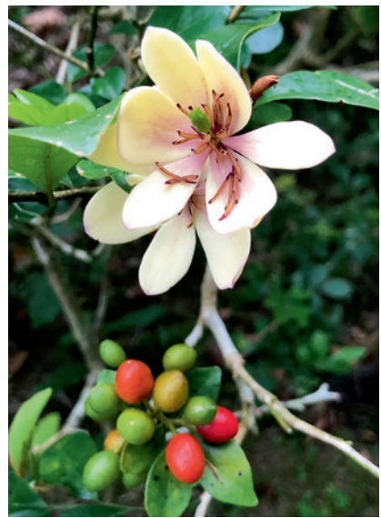
▲ 湖畔邊矮灌叢的含笑花正值花期，白色的花瓣在綠叢中若隱若現，傳來陣陣有如哈密瓜般的香氣、甜甜的。