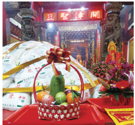
▲ 保安宮開漳聖王是野柳地區重要的宮廟之一。