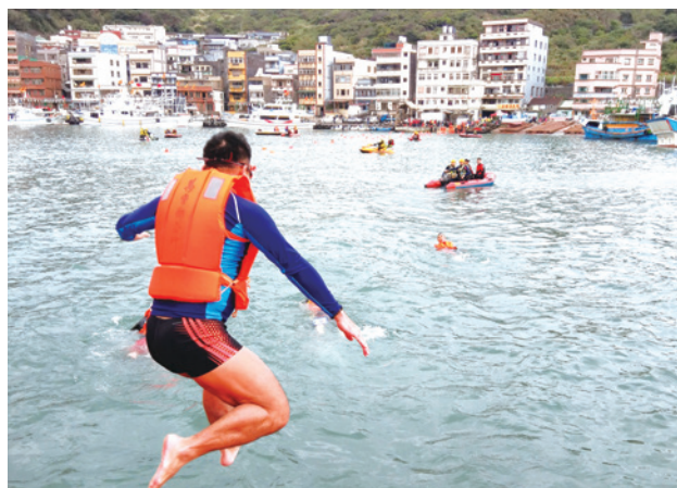
▲ 充滿活力的跳港勇士。