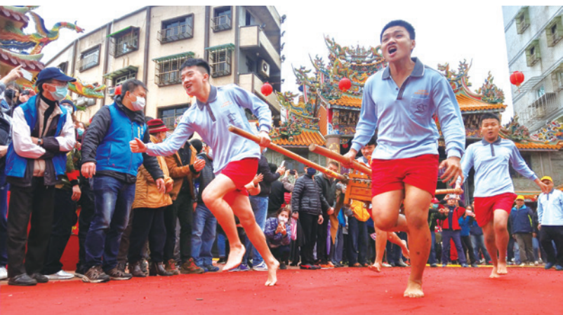
▲ 神明執事人扛著轎子奮力往野柳港前去。