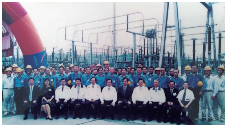
▲ 陳水扁總統主持南北第三路超高壓輸電線，嘉民－龍崎段竣工通電典禮，象徵臺灣進入穩定供電時代。

要整體的檢討並強化穩固，台電在 729 停電事件後，採用了輸電線路交叉設置的想法，將原先興達發電廠送往龍崎超高壓變電所的龍崎北第一、二迴路與送往龍崎南第三、四迴路交叉設置，變成一座鐵塔有送往南北各一迴路的方式，效法「雞蛋不放在同個籃子裡」的概念，降低一座鐵塔倒下引發全島電力系統崩潰的機率。