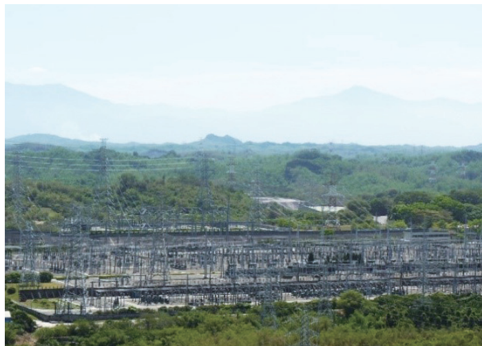
▲ 龍崎超高壓變電所全景，左半邊最上層臺地為東開關場，中間為 345 千伏西開關場最下層為 161 千伏開關場。

龍崎超高壓變電所原先規劃時，用地面積就足足有 39 甲這麼龐大，不過在 345 千伏以及後續的 161 千伏輸變電設備相繼到位後，仍有大量的閒置土地，究竟能多作何用途？原來，在 345 千伏之上，曾經台電還打算朝架設超超高壓輸電線路的計畫前進，惟終究超超高壓只存在於理念階段未能實現，從而多出許多閒置土地，而