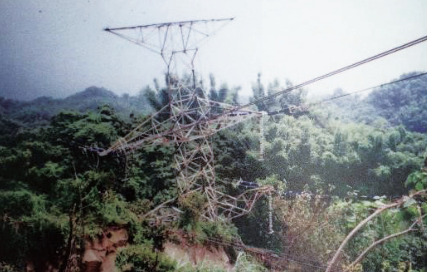
▲ 民國 88 年 7 月 29 日引發大停電事件的天輪—龍崎山海線第 326 號鐵塔。

變電所商借滑草場來舉辦團康活動，更做好敦親睦鄰工作拉近鄉里關係。龍耕隊與滑草場是在時代背景下誕生出跳脫變電所經營框架的獨特創意，為早年偏遠山區苦悶的值班維修生涯增添不少生活色彩。可惜同樣在時代變遷的過程中，龍崎超高壓變電所自動化程度增加、人員逐步精簡、交通日益發達，眷屬不必再就近居住，輸變電設備的增加壓迫到本來就不是本業的農耕用地，最終龍耕隊與滑草場仍舊成為歷史上的文獻紀錄，只能透過老照片與資深同仁的口述回憶當年的盛況。