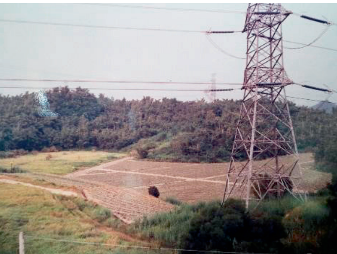
▲ 由超高壓輸電鐵塔守望的「龍耕隊」鳳梨田，為早年台電公司增加收益。