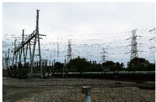
▲ 龍崎超高壓變電所 161 千伏開關設備一景，坐落在變電所三階臺地中的最下層。

壓變電所在內的南部地區發電廠與輸電系統勉強維持正常運轉，中北部系統則全面崩潰。同一年間，因接連兩次的大規模電力系統崩潰事件，凸顯出臺灣電網系統需