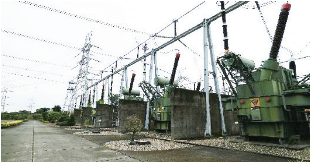
▲ 龍崎超高壓變電所 345 千伏自耦變壓器一景，已為臺灣電力貢獻近 40 年的機組仍保持良好機能持續運轉中。

大規模連鎖效應，中北部各大型發電廠因保護機制觸發，發電機組紛紛跳脫，造成全臺除南部以外的地區停電的災難，此次大停電事件就是後人俗稱的 729 大停電事件。