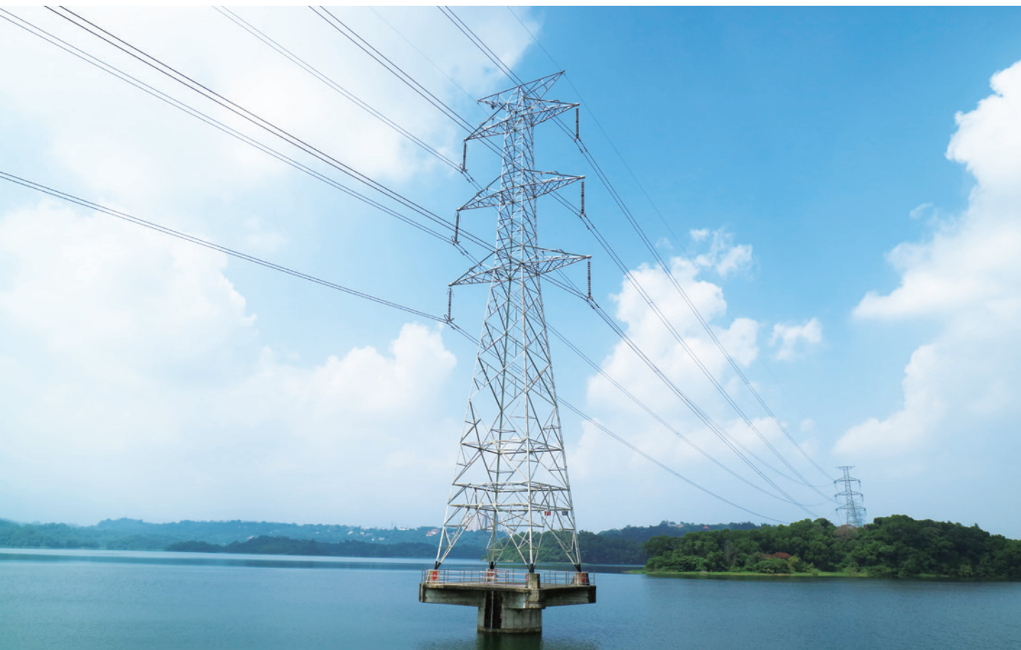
▲ 豎立在嘉義仁義潭水庫的第一路超高壓輸電線，天輪—龍崎線第 260 號鐵塔，起初為天輪—高港線，後因龍崎超高壓變電所民國 70 年 12 月落成，才改為天輪—龍崎線。

快速攀升，再加上眾多大型火力發電廠相繼建設完成，空有電廠卻沒有足夠的線路能夠輸送電源的狀況日漸窘迫。既有的南北縱貫 154 千伏系統無法再乘載更大量的電力，備感危機的台電，不斷研議及再三討論下，345 千伏遂一舉成為臺灣電壓等級最高的輸電系統。