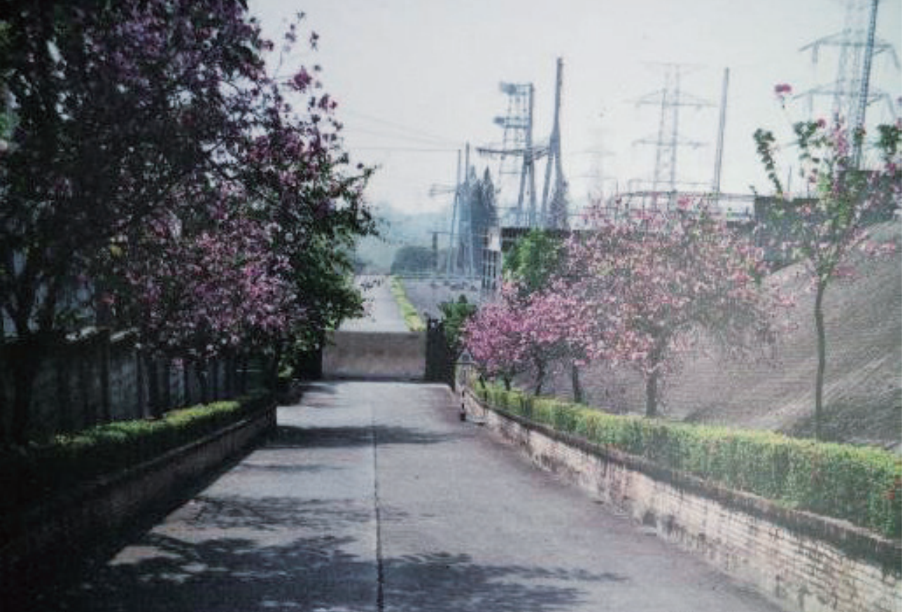
▲ 龍崎超高壓變電所大門兩旁盛開的印度櫻花 ( 又稱羊蹄甲或美人樹 ) ，是變電所綠美化的優良成果。

同仁眷屬，逐漸形成獨樹一格的龍崎超高壓變電所小社區。有人，就必須有電有水，龍崎早期未有自來水管線延伸時，只能仰賴打鑿在所內的深水井與小型淨化設施，作為簡易自來水來源。相同的，變電所周圍居民也都無水可用，因此秉持著互助的精神，變電所方面主動將管線延伸，分享水源給鄰近住戶使用。