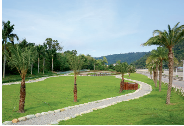
▲ 位於知本溪中游左岸高灘地的知本圳沉砂池，勇男橋與沉砂池之間的這塊地就是日治時期知本發電所的預定廠址。