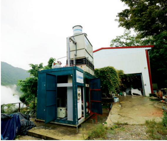
▲ 裝置容量 30KW 的熱發電機組，代表臺灣地熱發電往前邁進的里程碑。