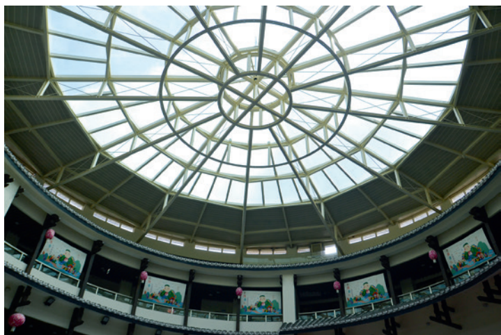
▲ 圓樓頂部巨大的採光玻璃將藍天白雲映成一幅天然帷幕。

我環繞著客家圓樓走一圈，在藍天的背景下，大面積的景觀水塘如拱月般將圓樓建築映襯得美輪美奐。水塘內水質清澈、