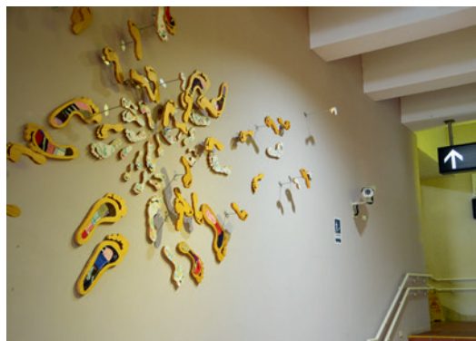
▲ 臺鐵豐富車站內的這件公共藝術「佇足」，期望遊子與旅人無論方向在哪，都能帶著初心朝目標勇敢前進。