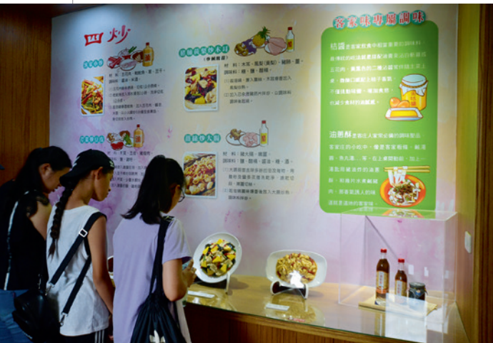
▲ 客家美食是苗栗縣政府近年積極推動及輔導結合客家文化創意之地方深度特色體驗遊程。