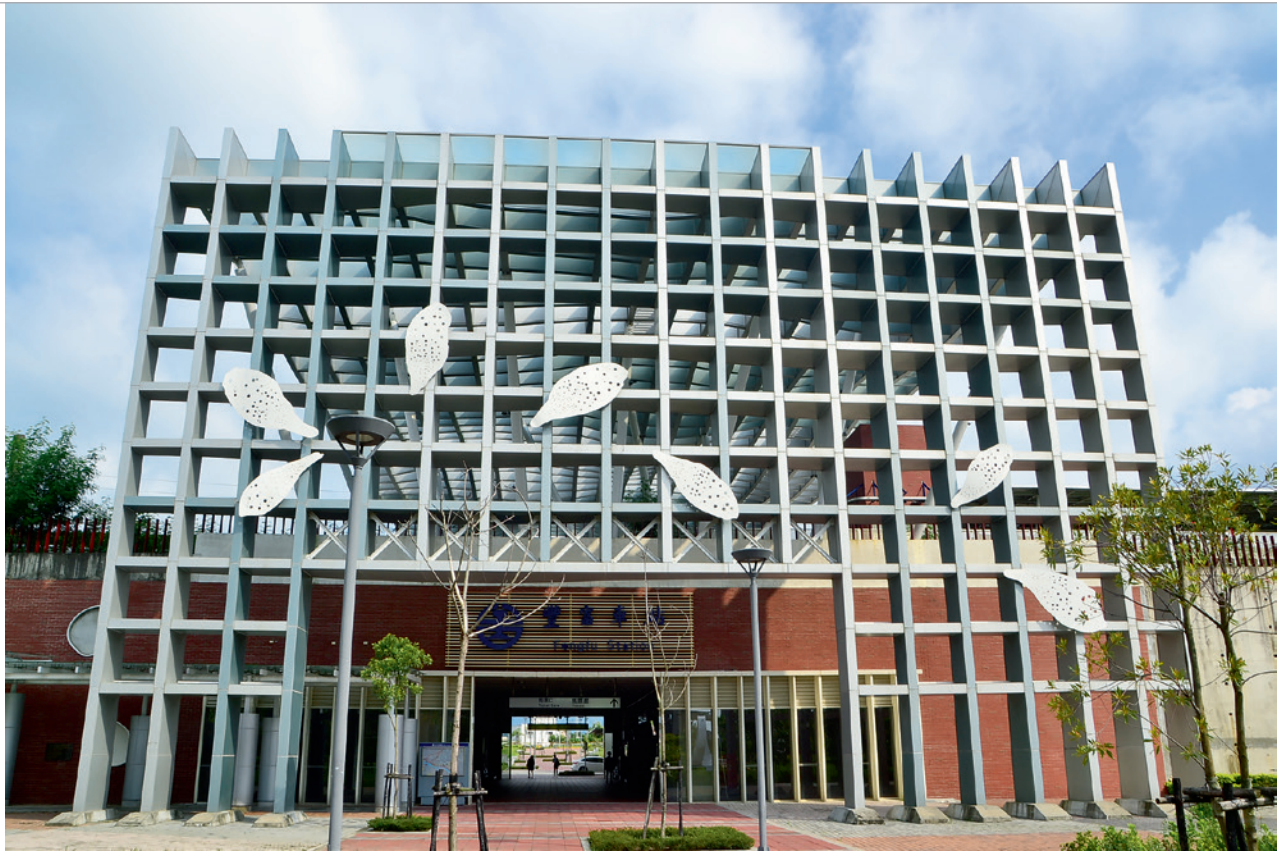
▲ 臺鐵豐富車站以挑高的簡單幾何的金屬框架，傳達輕量簡明的現代感，也象徵客家人的簡樸精神。

驛」。西元 1922 年因海線鐵路通車於後龍聚落增設「後龍驛」，遂將此站改名為「北勢驛」。西元 1971 年，臺鐵再衡酌其位處後龍溪以北、明德水庫以西之土質肥沃的農業區，將站名改為豐富站，取其物產豐富居苗栗縣後龍鎮之冠之意。