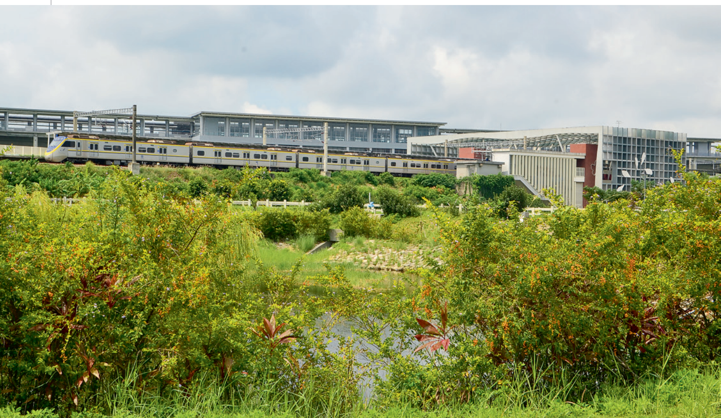
▲ 臺鐵列車駛過豐富站，背景就是高鐵苗栗站。

我正沉浸在這些大大小小的足印中，思索著足印的主人會有怎樣的人生故事，耳畔突然傳來轟隆隆的巨響，劃破寧靜的天空。只見一列純白色的高鐵列車如一道閃電在眼前 忽而過，緊接著，另一道橘色的光又從另外一邊飛馳而過，臺鐵的自強