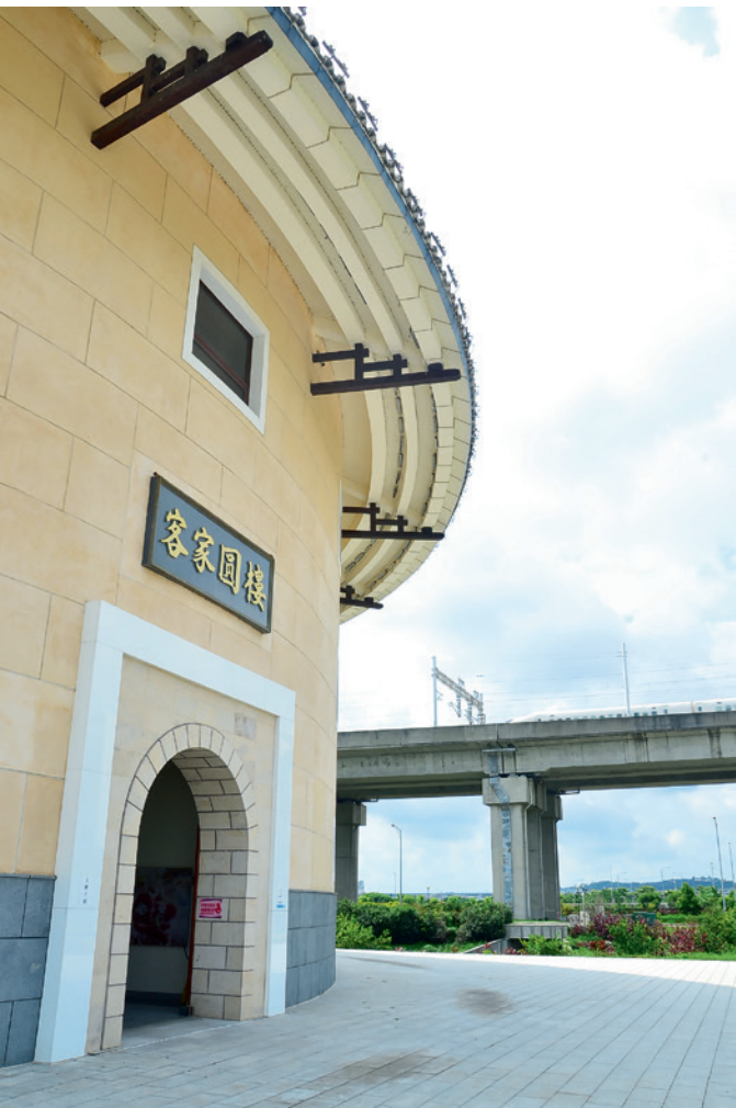
▲ 仔細看，在客家圓樓的另一面捕捉到臺灣高鐵呼嘯而過的畫面。

號正以過站不停的速度向南疾去。腳下的土地隨之震動，為臺灣帶來空間革命的兩條鐵路在這裡以如此近距離擦身而過，而鐵路橋下的幾隻白鷺鷥卻絲毫不為所動，它們依舊悠哉的理著羽翼，這些喜歡風平浪靜的鳥兒早已處變不驚了。