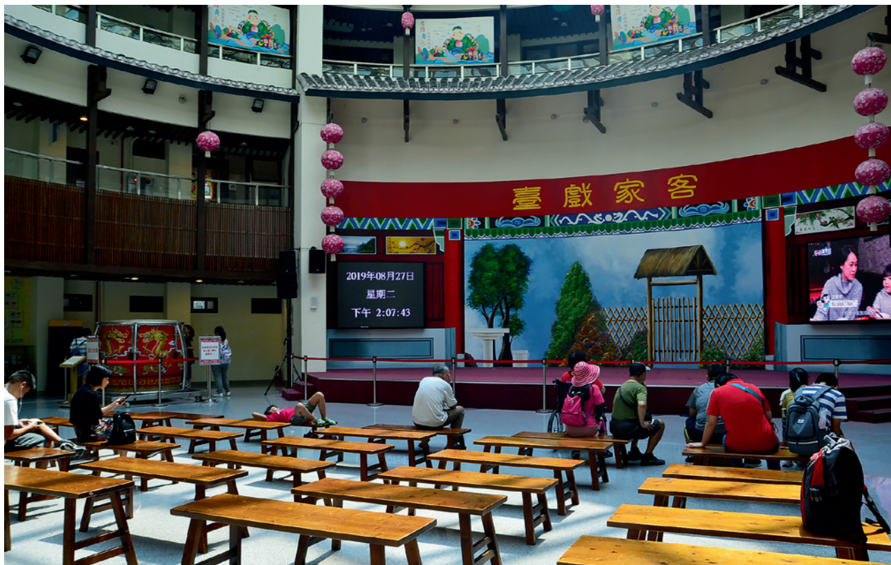
▲ 客家圓樓的一樓是客家戲臺。

拾步上二樓，環形的室內展廳呈現客家農事趣和客家飲食趣，想知道美味的客家料理是如何產生？又與那些客家節慶有關？在這裡都可以得到解答。據館內工作