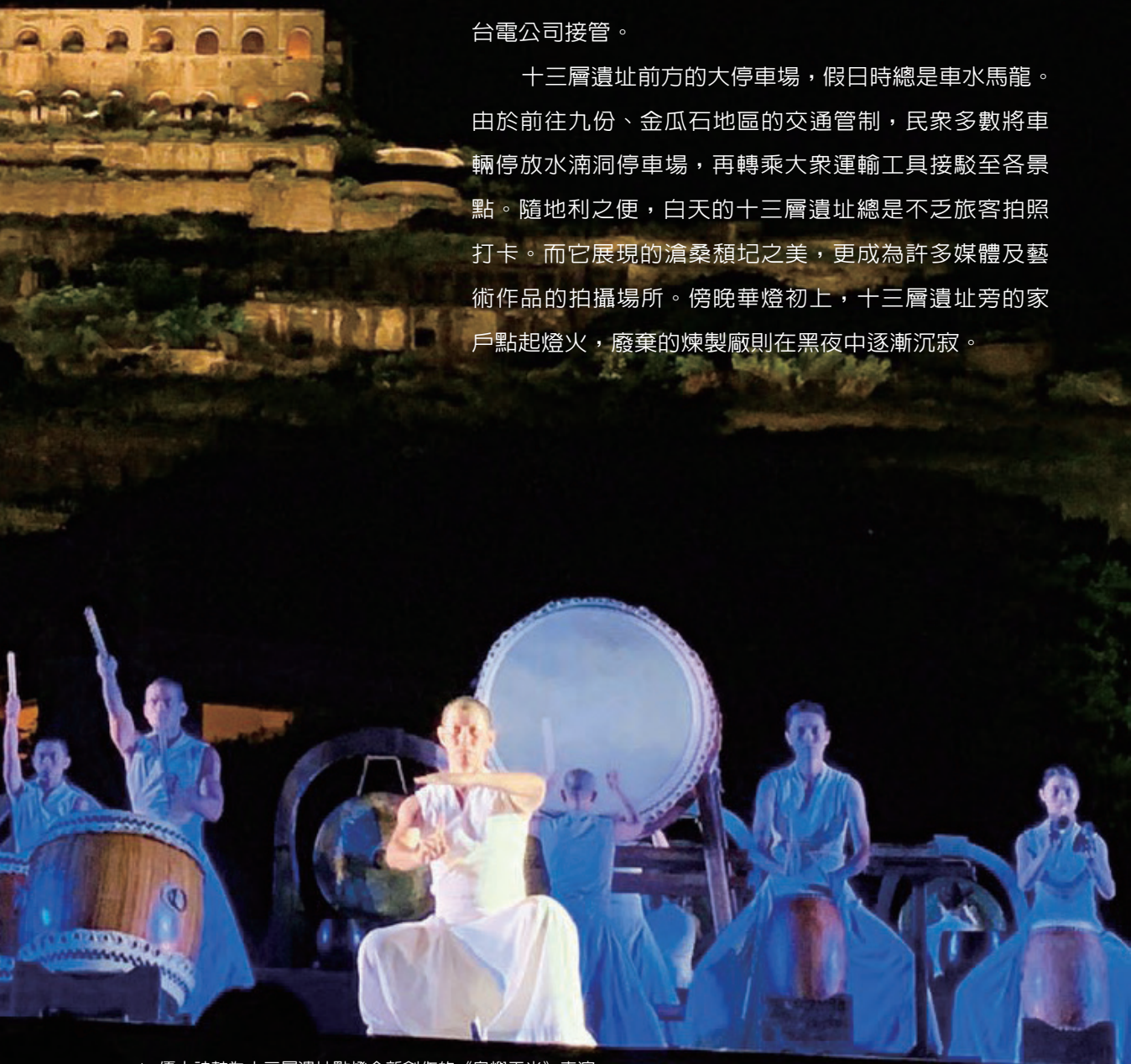
▲ 優人神鼓為十三層遺址點燈全新創作的《島嶼天光》表演。

十三層遺址前方的大停車場，假日時總是車水馬龍。由於前往九份、金瓜石地區的交通管制，民衆多數將車輛停放水湳洞停車場，再轉乘大眾運輸工具接駁至各景點。隨地利之便，白天的十三層遺址總是不乏旅客拍照打卡。而它展現的滄桑頹圯之美，更成為許多媒體及藝術作品的拍攝場所。傍晚華燈初上，十三層遺址旁的家戶點起燈火，廢棄的煉製廠則在黑夜中逐漸沉寂。