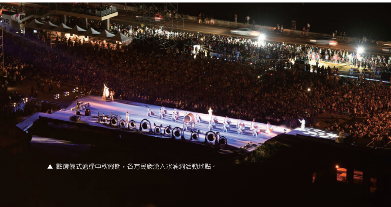
▲ 點燈儀式適逢中秋假期，各方民衆湧入水湳洞活動地點。