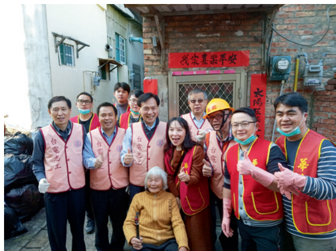
▲ 台電咁仔店志工今(108)年2月時，協助鄭奶奶清理住家環境。

年2月及7月，「台電咁仔店」透過華山基金會，協助兩位弱勢老奶奶更新家中電器設備，讓長輩安心度過晚年。