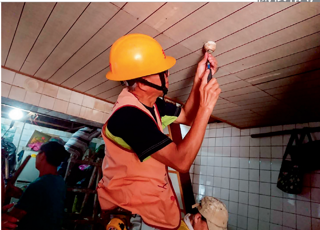
▲ 台電同仁協助清寒、弱勢家庭，免費更換屋內線路老舊耗材。

電咁仔店」通報後，立即安排志工完成田宅老舊屋內線開關、燈具換新工程，順利達成田老爺爺返家居住的願望，讓田老爺爺感動不已。