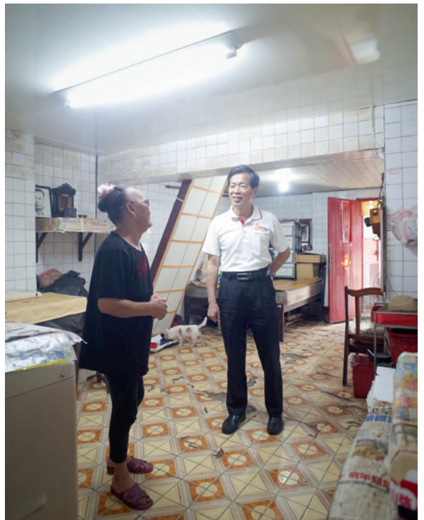
▲ 經過台電咁仔店志工一番整修，周奶奶家中顯得明亮乾淨。