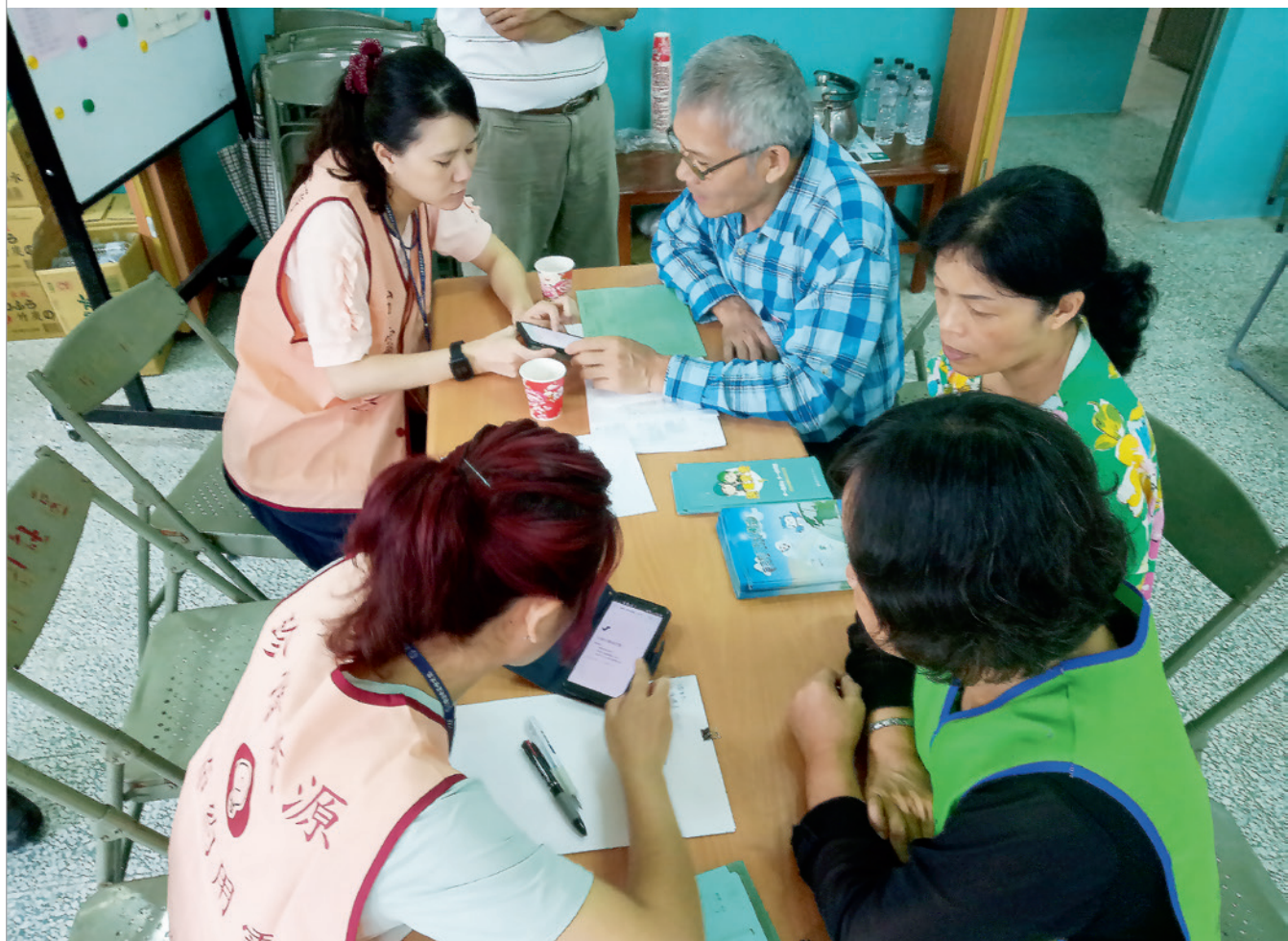
▲ 苗栗區處台電咁仔店志工到大湖鄉新開社區教上網情形。