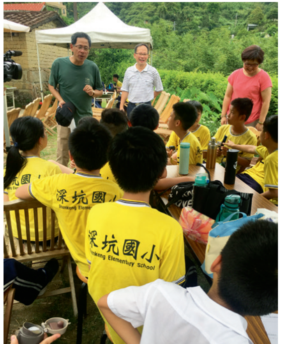
▲ 深坑國小學生與劉克襄對話。