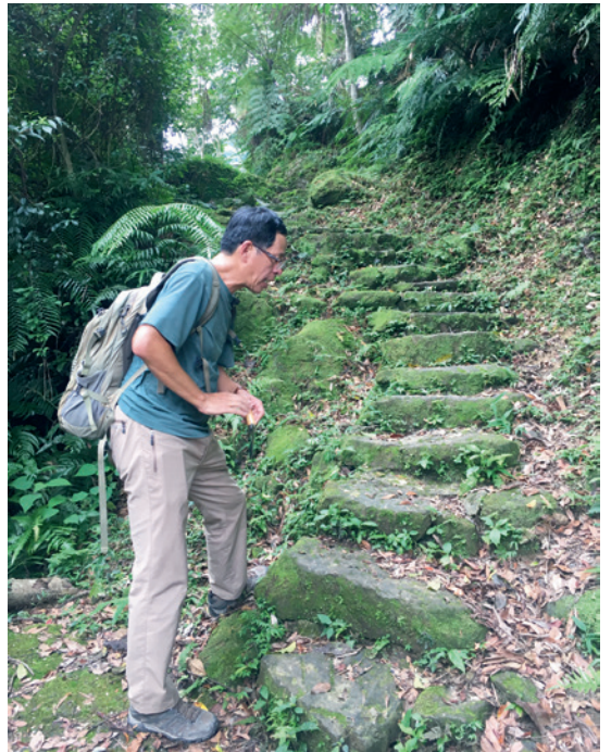
▲ 劉克襄講解錯落有致的步道石階故事。

恭喜劉克襄先生榮獲「第六屆聯合報文學大獎」，獲獎實至名歸。回顧劉先生 80 年代於本刊連載之「友情大地」專欄，溫潤樸實又詼諧的描述在地故事，讓臺灣的郊野變得活潑可親，感謝劉先生對臺灣土地及《源》雜誌的愛護及付出。