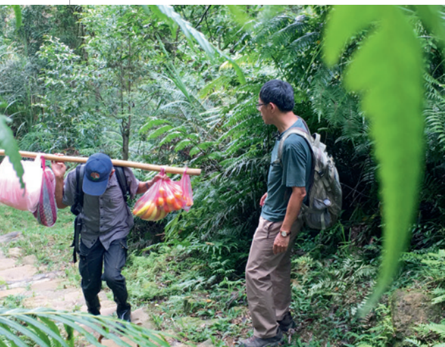
▲ 巧遇住戶徒步送物資上山。