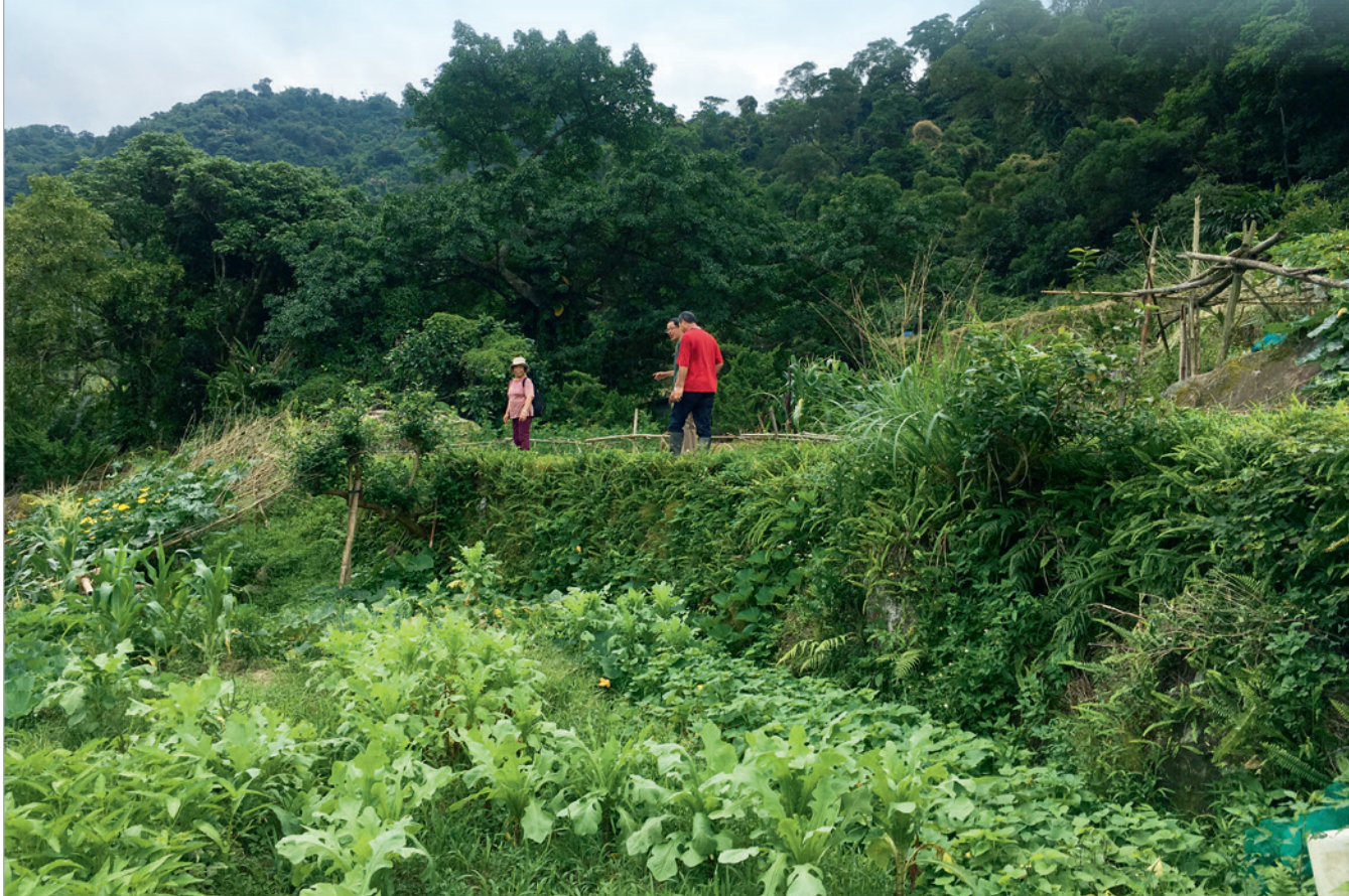
▲ 茶山古道與農家共生。

就在劉克襄七月榮獲「聯合報文學大獎」前不久，有幸跟隨腳步至新北市深坑，感受他近年來以社區參與的方式實踐自然關懷的真誠與踏實。