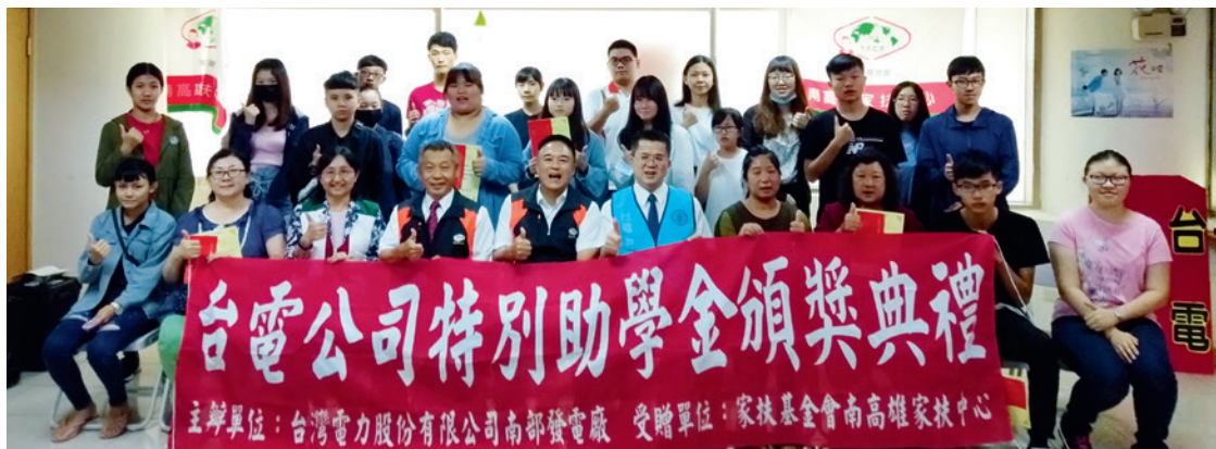
▲ 特別助學金的頒發是台電回饋社會、協助弱勢家庭的重要實踐。