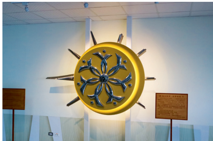
▲ 大林發電廠舊機組拆除紀錄。