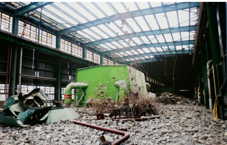
▲ 大林發電廠舊機組拆除紀錄。