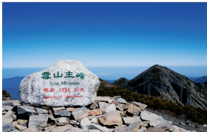
▲ 標高 3,886 公尺的雪山主峰大石。

沿著北稜角的岩壁攀繩下到鞍部，距離主峰還有 300 多公尺，緩坡而上，主峰上有一座用岩石堆砌的平台，台上安置一顆大石，上面用中英文書寫「雪山，標高 3,886 公尺」，上一次拜訪他時並沒有這一石座，不曉得那大石是如何運上來的？