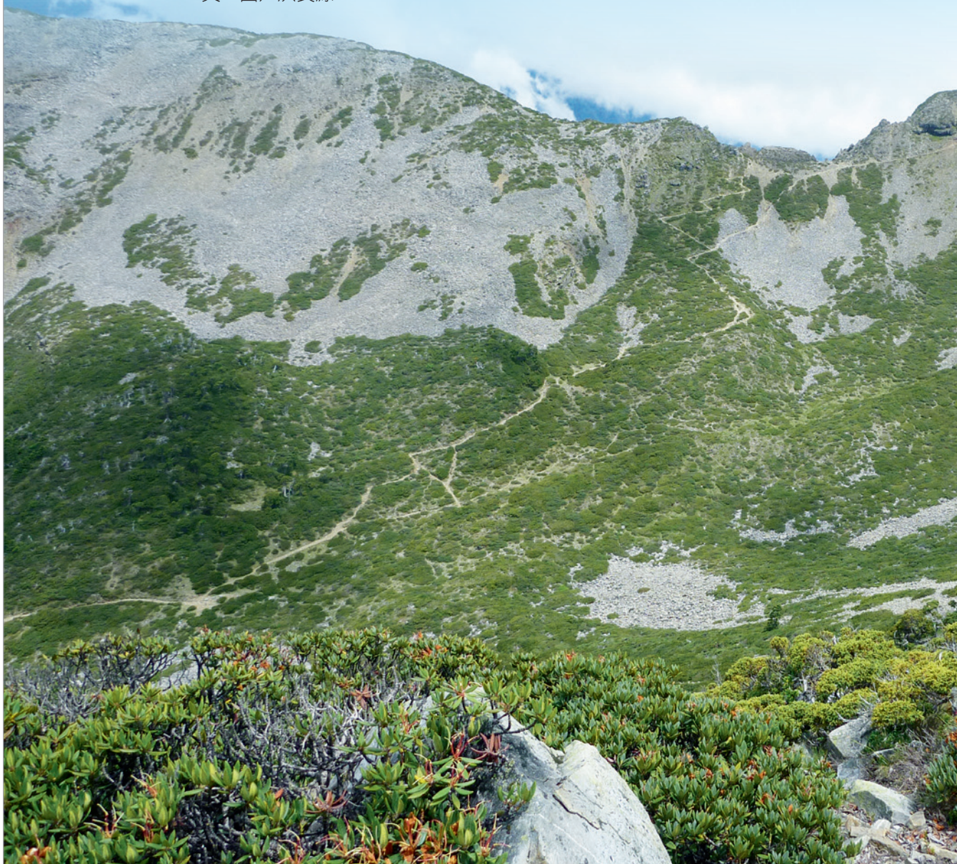
▲ 位於雪山主峰與北稜角下的一號圈谷。