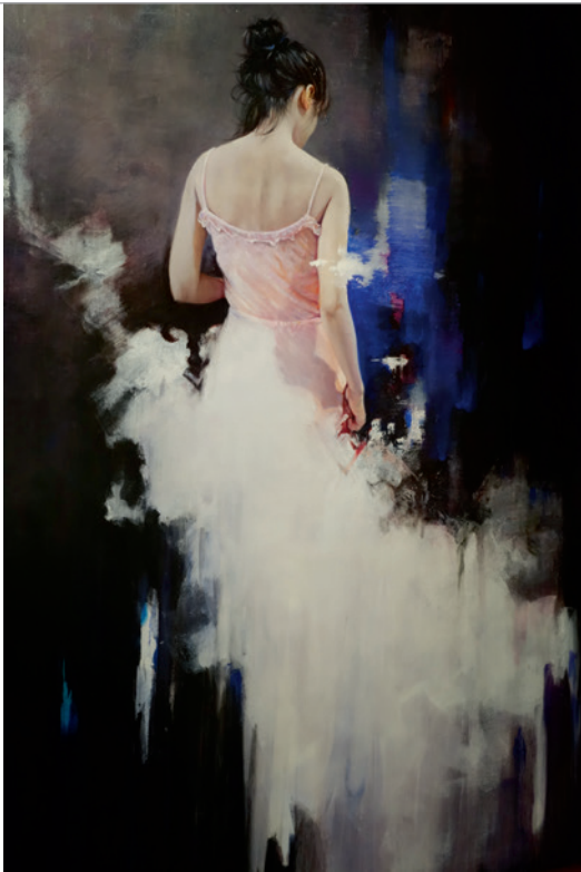
▲ 梁君午 璇 西元 2016 年 油畫 120x90cm。

這位作品充滿人道主義，透顯著感悟，智慧的文學家塞拉，他以如詩般的文字形容梁君午的繪畫：梁君午用濡染著光和影的鳥的羽毛素描、繪畫、思考，用他東方的原鄉最柔和纖細也最堅定的色調作畫，如此奧秘，如此深沉。