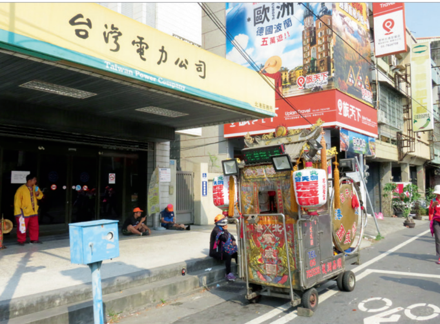
▲ 台電公司北港服務所，正好位於白沙屯媽祖進香至朝天宮廟的最後一哩路上。