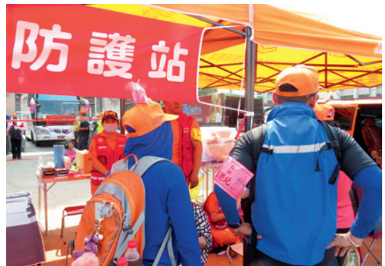
▲ 徒步行走累了、受傷了，一旁熱情的民衆及防護站，都能給予及時的補給及協助。

出門在外，跟著媽祖一起走過臺灣，看到大家的熱情，真的很難不愛這款臺灣味。無私的施與受，無怪乎許多老外來到臺灣參加了媽祖繞境 / 進香的活動後，就深深的愛上這塊土地上的人、事、物。而這項特殊的民俗活動，確實抓住了臺灣在地精髓。儘管活動結束之後，所有人都要回歸到自己的生活，但 10 天的漫步隨行，體驗隨遇而安、受人恩惠的不同人生，才是文化活動最難得且可貴之處。🍵