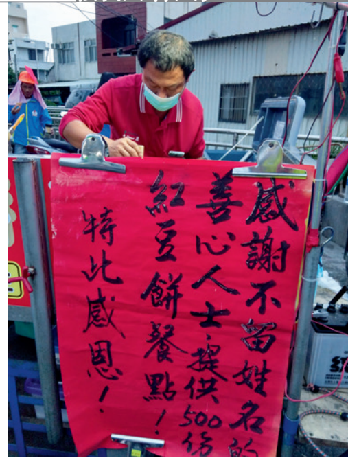
▲ 不具名的善心人士，請攤商免費提供民眾紅豆餅作為路程上的補給。

辦單位能通盤運用，無論是在行動補給或耗材上，都能夠彈性的使用，為路上的每位香燈腳們加油打氣。