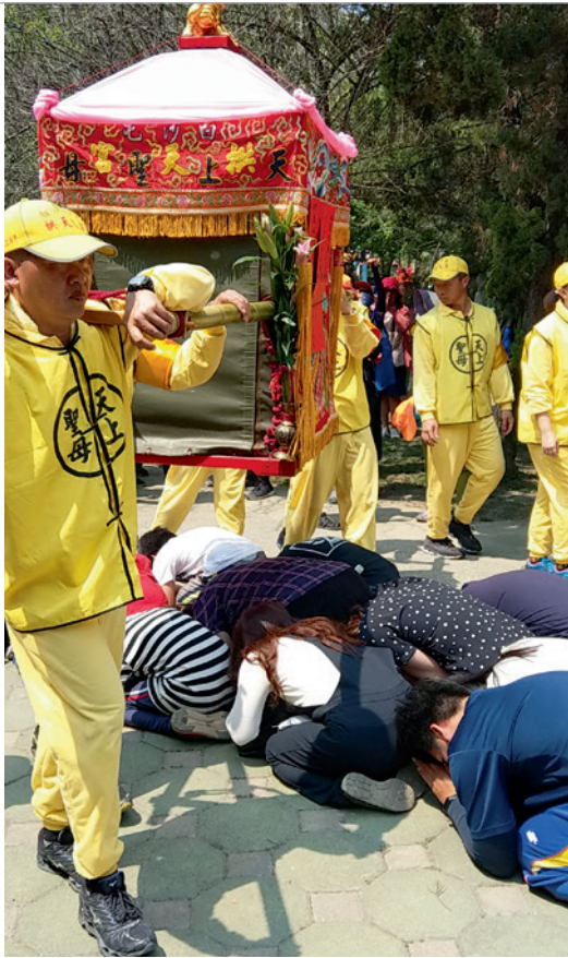
▲ 繞境 / 進香活動中，常見民衆鑽轎腳祈求媽祖保佑。

神轎到達之前，站定位置等待媽祖的前來，其實白沙屯媽祖的路線中，從北港保定派出所經過華勝路，進入北港朝天宮前的這一段路程，可能是白沙屯媽祖進香全程唯一一條固定路線。媽祖預定進到北港朝天宮的時辰是上午 11 時。不到 9 點時刻，北港的華勝路上，早已湧入許多民衆。大家頂著烈日，就為了等待白沙屯媽祖的粉紅超跑出現（白沙屯媽祖進香的神轎，是由 4 人所扛、方便移動的轎子，而神轎外粉紅色的頂帳及快速移動的速度，因此有民衆將神轎別稱為粉紅超跑）。