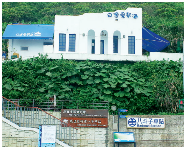
▲ 深澳鐵路自行車站就位於八斗子車站旁。

深澳鐵道是早期運送煤礦的鐵道支線，從基隆火車站延伸至現在的瑞芳水滴洞地區，但瑞芳金瓜石地區的礦產銳減，深澳支線營運不敷成本，後雖經改建，仍不及公路運輸之競爭，因此全面停駛，僅保留至深澳電廠部分供運煤使用。民國96年，深澳電廠停止發電，運煤鐵路也於該年劃下句點，支線停擺至民國103年，才因八斗子地區海科館的開張，重新啟動深澳支線的運作。目前的深澳支線起自八斗子，經過瑞芳、侯硐、十分、平溪等山線景點，以菁桐車站為終點站，串聯起基隆及瑞芳、平溪等地的旅遊景點。八斗子至深澳路段，則改建為鐵道自行車軌道，接軌基隆、新北的海線旅遊。