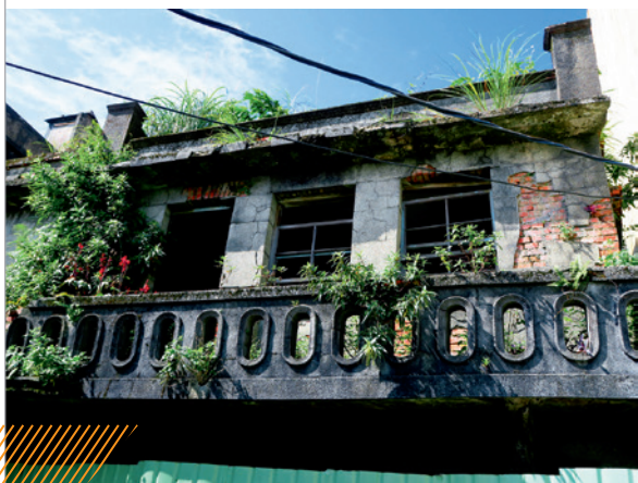
▲ 樓仔厝古厝，岌岌可危。