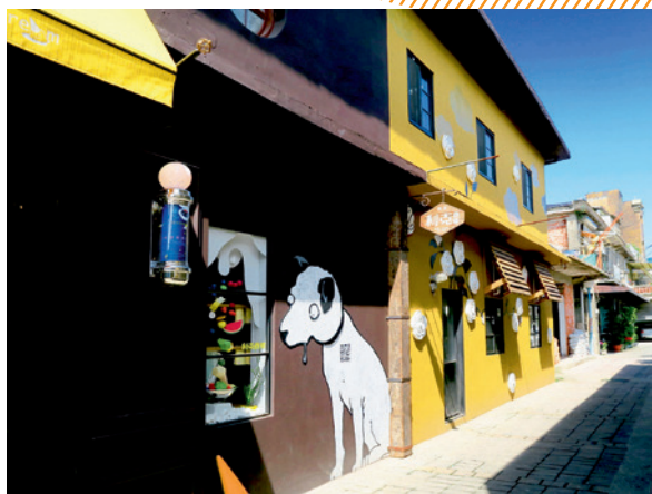
▲ 後站附近由老房子改建的冰淇淋專賣店。