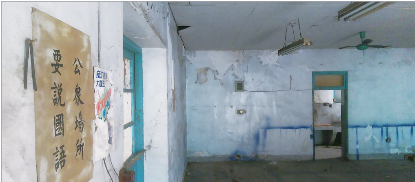
▲ 復古吊扇與垂吊燈具別具風情。

的榮華。冬日的陽光細緻而溫柔，被空氣中的浮塵折射成七彩稜光，灑落在石牆上，靜謐如詩。有風吹過，純淨而澄澈，挾帶著悠遠的訊息，彷彿是上世紀的語調，在耳畔婉轉訴說著昔時的風采。在北儲，我看到陳舊與現代並置的美麗與奇妙。