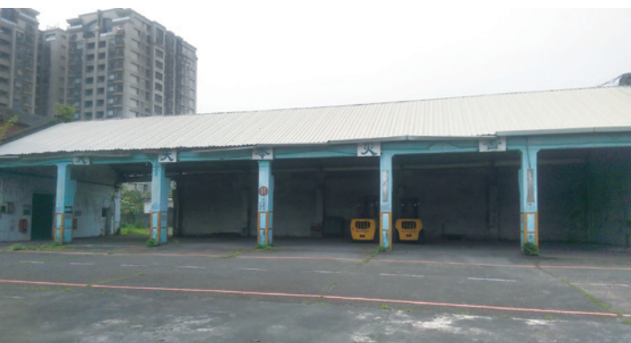
▲ 放置機具的鐵皮庫區。

台電公司北部儲運中心已於民國 103 年遷移至桃園市觀音區，鄰近大潭發電廠。舊址則為臺北市公辦都更試辦點，期能融入地方元素，活化南港地區產業發展。