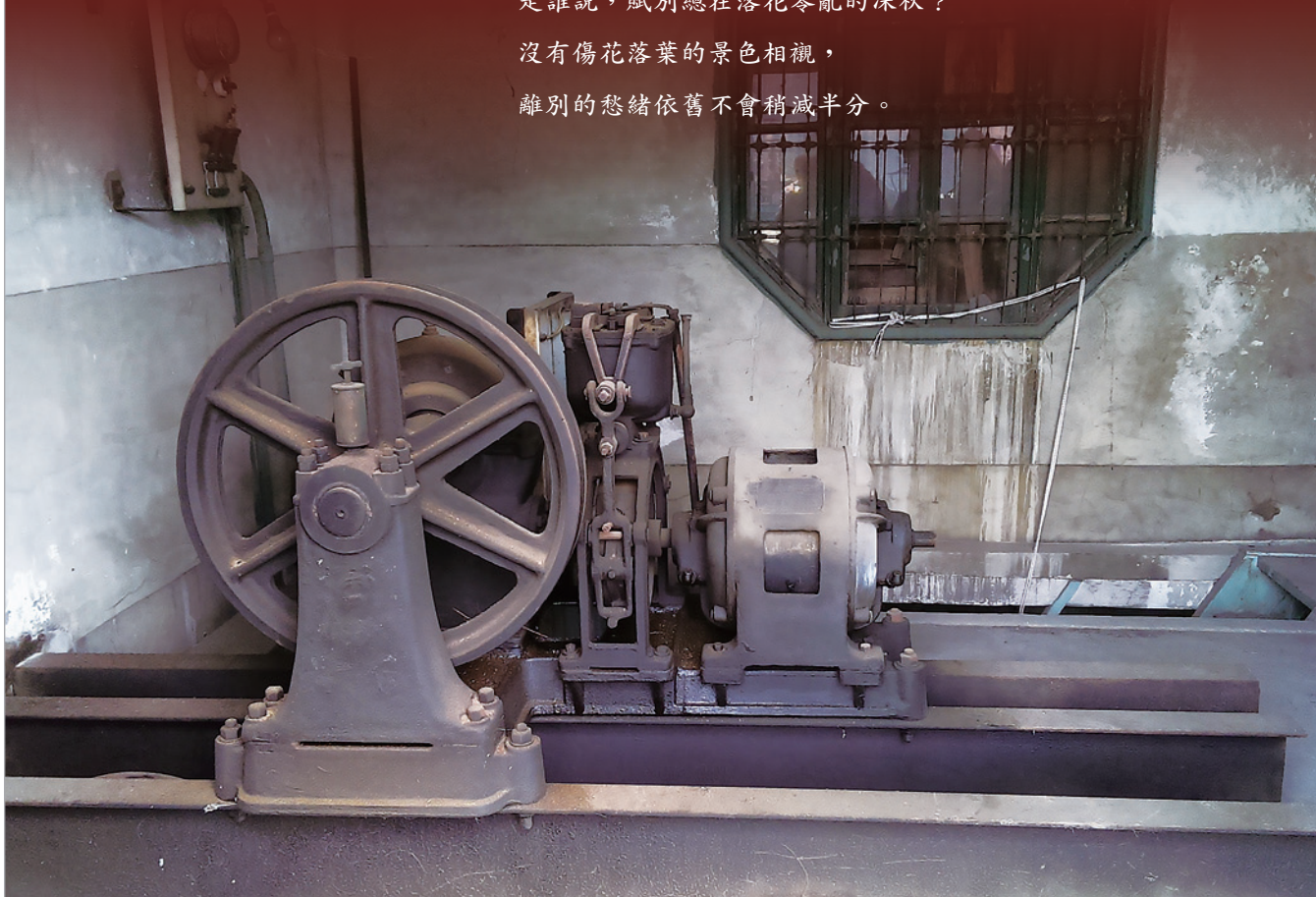
▲ 傳統電梯與八角窗櫺風緻嫣然。