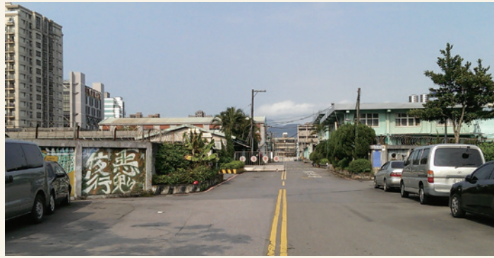
▲ 座落於市區中心的北儲。

塗上色彩濃烈的彩繪，復古而純樸，別具時代風情。一道圍牆，挽住了時光的步調，外側是熙攘紅塵；內側則是無爭歲月。她安穩的座落於車水馬龍的市區中心，與旁邊的高樓大廈氛圍截然不同，彷彿超然獨立般格格不入，卻又像是順勢而為般的自然而然。大門左側是郁郁青青的龍柏，高潔秀逸，右側是廣袤蒼涼的露天庫區，物料排列整齊劃一，盡展管理人員的嚴謹細膩。庫旁小徑曲折蜿蜒，或見萋萋卉木，或見雜草叢生，每處轉角，都是不同的風景，處處驚奇。沿著柏油路前行，兩旁佇立的是一棟棟年代悠久的倉庫，內置的傳統電梯與八角窗櫺風致嫣然，散溢出陳舊韶華的韻味。長路盡處是一道紅磚圍牆，日耀清輝下，我見到一朵花蕊，清秀而嫵媚，她綻開恬靜的枝葉，於圍籬上伸展蔓延，悄然隱沒於另一側的繁華世界，像是跨越了新與舊的時空，連結了往昔與現今