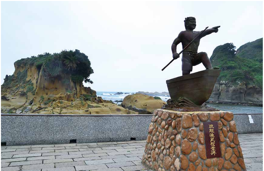
▲ 島上立有一尊「琉球漁民慰靈碑」，記述了琉球人與和平島居民和諧相處的一段史實。

的海蝕洞，其中一個頗為規則的洞口十分醒目，上方還有模模糊糊的字樣，導覽老師說那個洞叫「蕃字洞」。17世紀時荷蘭人到此，曾在洞內躲避，在深約20公尺的海蝕洞里刻了荷蘭文，於是當地人稱其為「蕃字洞」。300多年過去了，洞裡的文字早已被海風海浪侵蝕殆盡，無法辨識了。