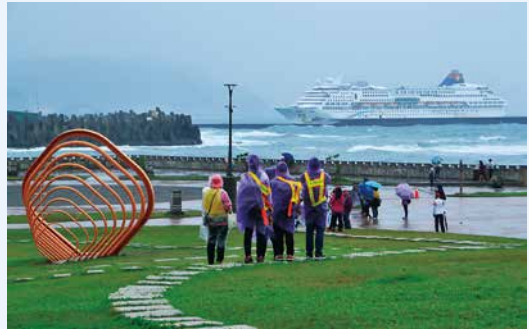
▲ 和平島因位於基隆港進出的港鑰地帶，大船入港的畫面皆從這裡開始，和平島也持續見證基隆港歲月風華流轉。

治及戰後國民政府各個時期築港計畫，基隆港於日治時期崛起，民國 5 年超越淡水港，躍升為對日本、中國大陸和南洋航運線的中心港口，也是各地旅客進出臺灣的重要門戶。然二戰末期，港口遭盟軍轟炸成廢墟，戰後修復並逐漸擴建港埠設施，在民國 73 年成為世界第七大貨櫃港，海運網遍達全球。民國 79 年起，受港埠腹地狹小與中國大陸沿海港口興起及八里臺北港建造的影響，基隆港營運不若以往。近年靠郵輪經濟注入新的動能，而和平島也持續見證歲月風華流轉。