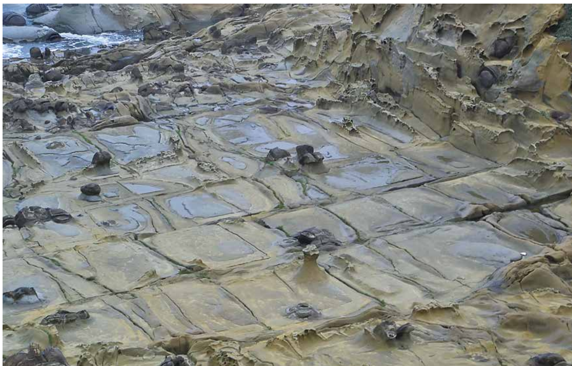
▲ 海蝕平台上分布著受到大自然擠壓及侵蝕的「豆腐岩」，當地還有一個俗稱叫做「千疊敷」。

漫步其上，可以發現這些大片而平整的岩層上，出現筆直且細長的切割線，這些互相交錯的線條，間距居然還差不多，把巨大的岩石表面劃得好像切割豆腐般整齊，因此被稱作「豆腐岩」。導覽老師說，海蝕平台上分布著這些遼闊的大豆腐岩還有一個俗稱，叫做「千疊敷」。原來在日治時期，日本人見其外型，大小就像榻榻