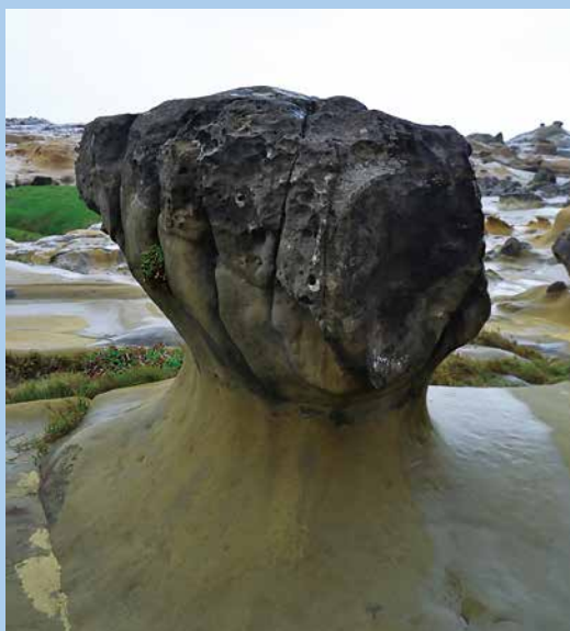
▲ 「蘑菇頭」抗侵蝕力較脖子強，在大自然「欺軟怕硬」的差異侵蝕下，進入粗頸期。