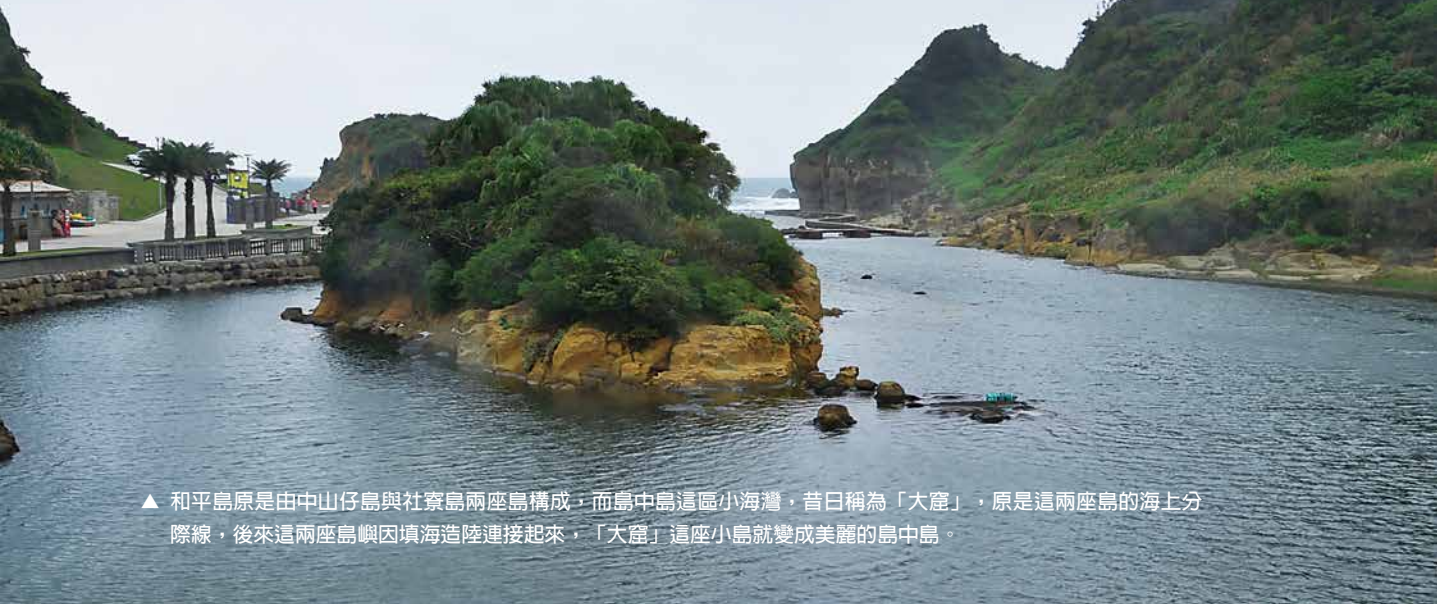
▲ 和平島原是由中山仔島與社寮島兩座島構成，而島中島這區小海灣，昔日稱為「大窟」，原是這兩座島的海上分際線，後來這兩座島嶼因填海造陸連接起來，「大窟」這座小島就變成美麗的島中島。

和平島雖是一個面積僅 66 公頃的小島，但島上還有一座島中島，由此亦可一窺和平島的前世今生。和平島原是由中山仔島與社寮島兩座島構成，而島中島這區小海灣，昔日稱為「大窟」，原是這兩座島的海上分際線，後來這兩座島嶼因填海造陸連接起來，