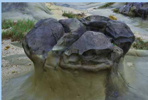
▲ 這是「薑狀岩」的無頸期。

在這裡，可以看到「萬頭攢動」之景。導覽老師如是說，當成千成百的薑狀岩從海蝕平台上冒出頭來，那景象就像是一群站立在海邊，因此這樣的地景也被稱作