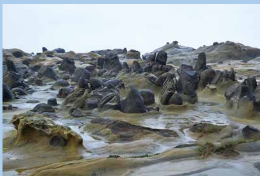
▲ 薑狀岩爭先恐後地從沉積岩中冒出頭來，在海蝕平台上形成萬頭攢動的畫面。