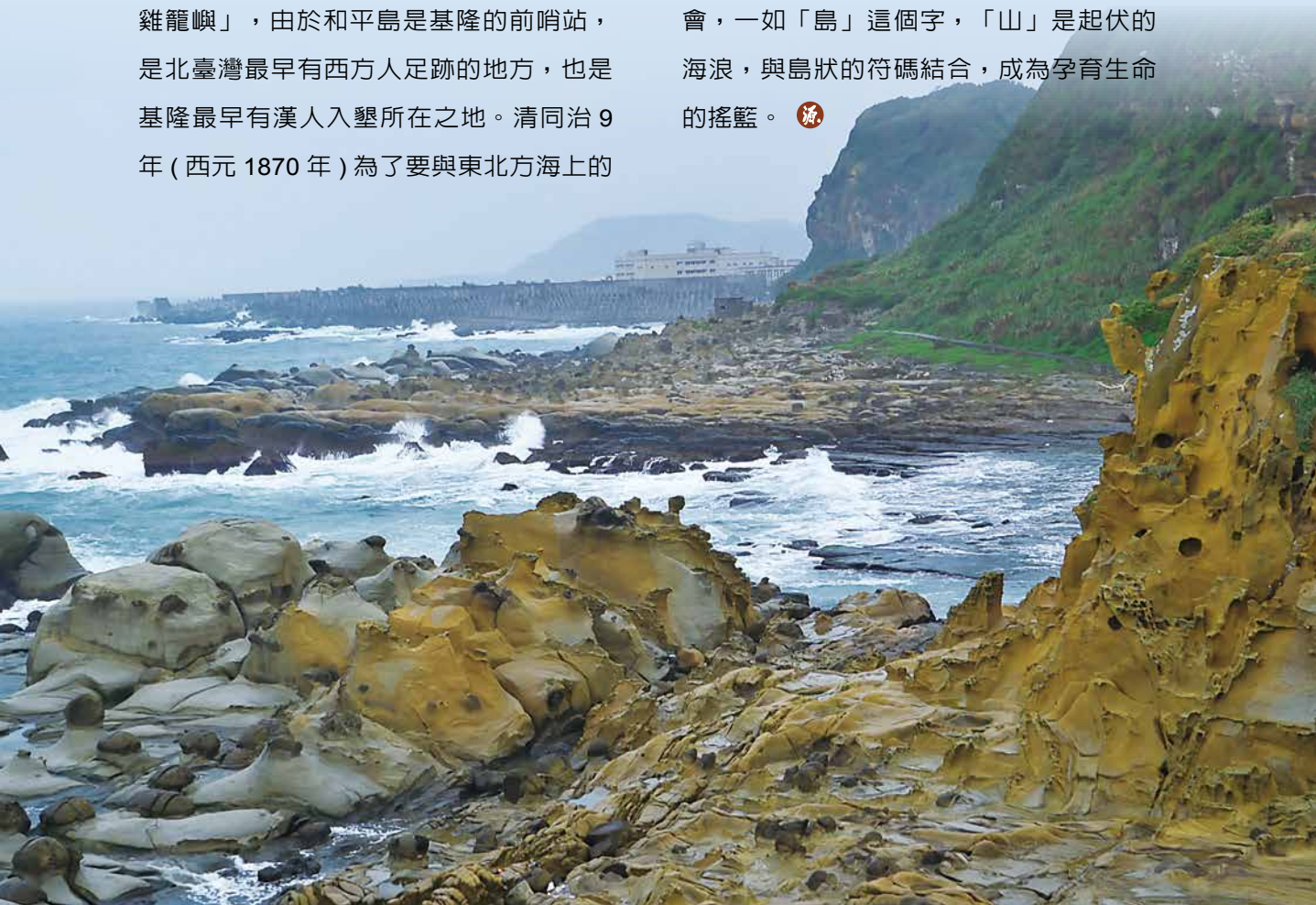
▲ 這裡就是獲選全球最美 21 個日出觀賞點之一，被稱為世界秘境的阿拉寶灣。