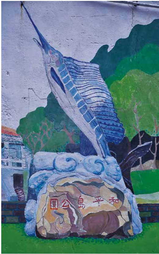
▲ 和平國小學童彩繪的海洋美景，和平島上的奇石與美麗的海洋生物是這些彩繪的主要元素，凸顯出幼小心靈對蔚藍大海的嚮往。

前掛著巨大浮球切割而成的信箱和花盆，浮球是討海人海上謀生的必備，雖然島上的漁業已經逐漸沒落、退守，但落土扎根的認同仍從這些過往的漁具上移植延伸出來，代代的基隆人在這裡學會和山與海共存，在山海之間，找到棲居的方式，山、海、漁的生活環境依然在島上流動著。