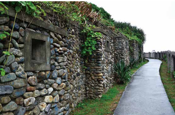
▲ 在登山步道岩壁的一側，布滿石砌的軍事設施，見證早年這裡曾是臺灣島的防禦要塞。