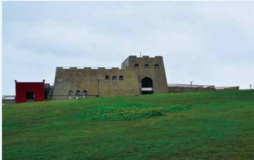
▲ 遊客服務中心的建築是仿 17 世紀西班牙人登上和平島所建的堡壘樣式。