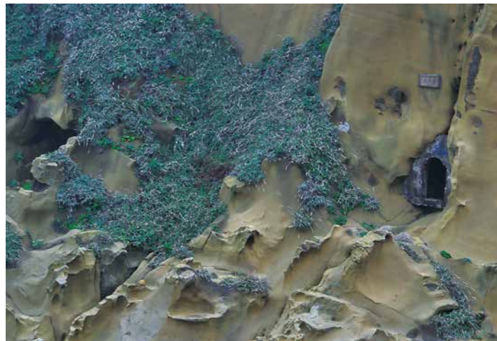
▲ 這個海蝕洞被稱為「蕃字洞」，相傳是 17 世紀時荷蘭人到此，曾在洞內躲避，在洞里刻了荷蘭文，於是當地人稱其為「蕃字洞」。