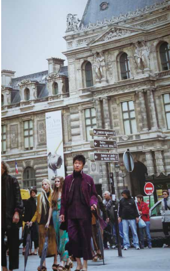
▲ 巴黎皇家宮殿柯萊特廣場上，一場時尚美學展演，猶如一幅動態的風景畫。