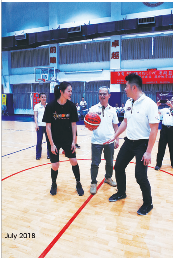
▼ 籃球夏令營每年球隊交流示範賽，今年加入台電女籃及台電嘉賓的對戰組合。

「籃球活動的樂趣，在於上籃進球得到的快樂與成就感，所以希望每位學員，在學習基本動作、進階訓練後，都一定要能夠完成上籃的動作，將來才有可能在籃球場上與他人持續互動。」