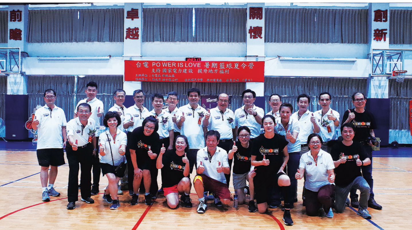
▲ 為期 6 天的籃球營，希望能為參加的同學注入暑期假期的活力。