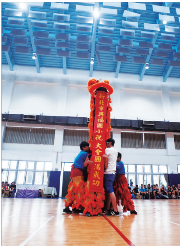
▲ 興福國小醒獅隊為開幕典禮暖身。