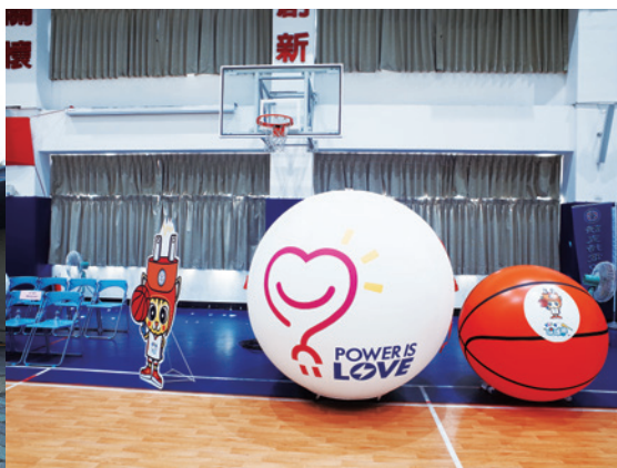
▲ 台電公司舉辦的籃球夏令營，今年已邁入。