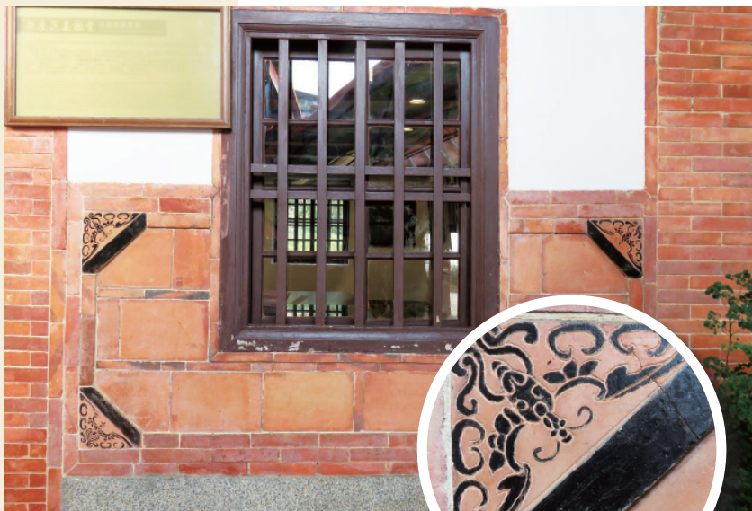
▲ 已有 160 多年歷史的窗框、磚牆，是珍貴的文化資產，更是鄰近大學建築系師生眼中的建築瑰寶