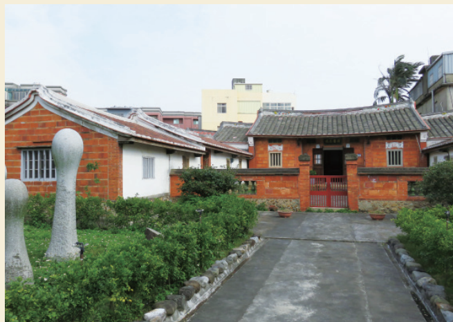
▲ 門牌 6 號的第四棟古厝，庭園內的柱型創作，出自雕塑家范姜明道之手。

不失華美細緻；緊鄰祖堂的第四棟古厝清幽風雅，正門兩側楹聯「陶穴肇基光輝甲第，涓璜徵瑞彩煥寅階」，之中的「甲第」、「寅階」暗藏「甲寅」年份之寓意，可推算出古厝建造時年約莫在咸豐 4 年（西元 1853 年），歲次甲寅之際。窗戶上方以卷軸樣式設計成的窗飾，寫著「竹苞」、「松茂」的字樣，散發濃厚的書香氣息。屋脊上的精緻雕飾更顯示出族人的品味。前院裡的藝術創作則出自知名雕塑家范姜明道之手，呈現中西融合、傳統與現代並陳的特有景致。