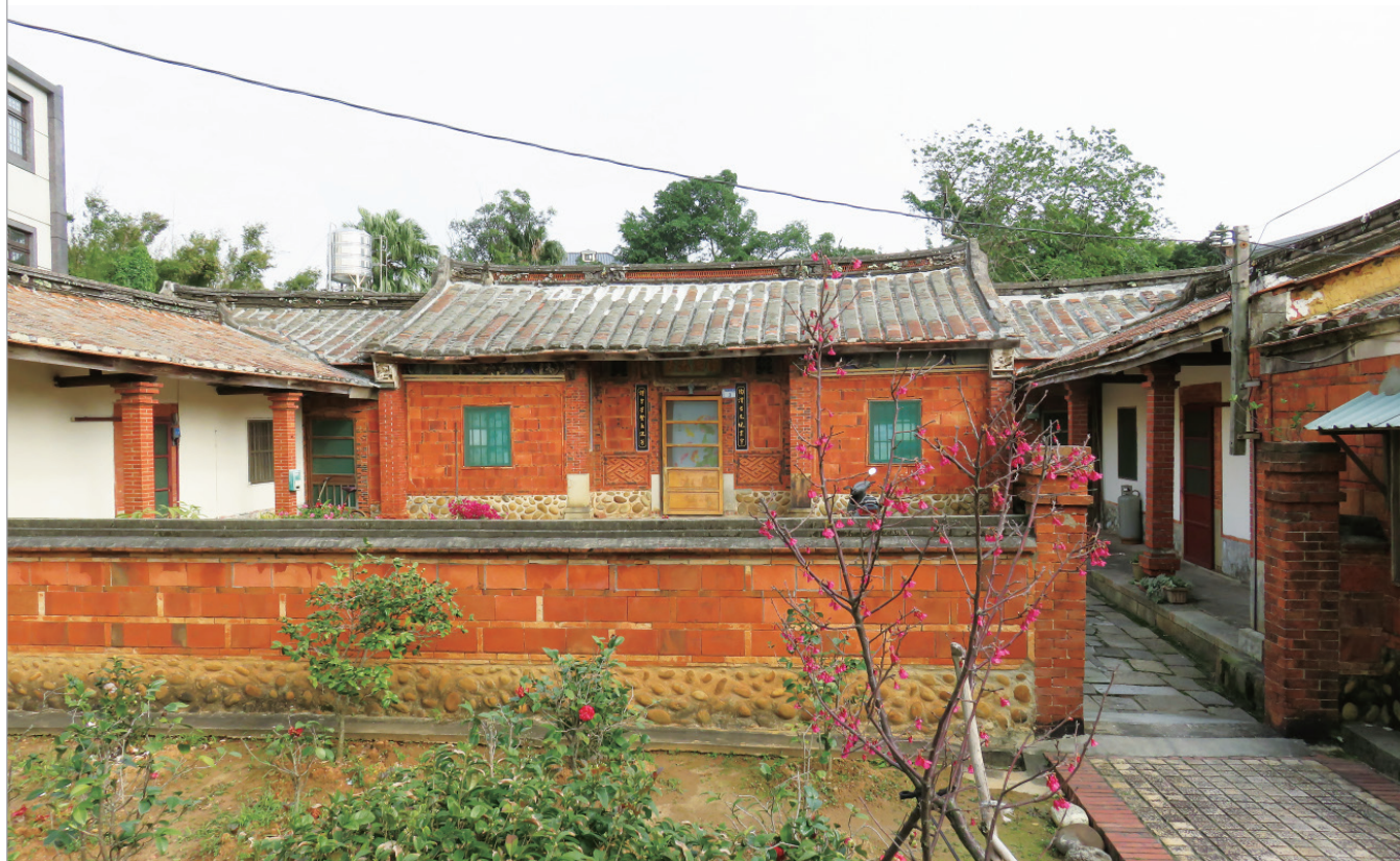
▲ 沉穩內斂的第三棟古厝。

譬如第二棟古厝，灰白色的外牆是以卵石及瓦片砌成，展現客家式的建築氛圍；左右橫屋牆面上的紅磚，又接近當時的日式建築特色，可說混合了臺閩、客家及日式等多重建築風貌；第三棟古厝正門門楣上「陶渭流芳」的門匾及外牆下方皆以稀有的交趾陶燒貼而成，中庭及兩側橫屋則保留青石磚鋪設的概念，在沉穩內斂中仍