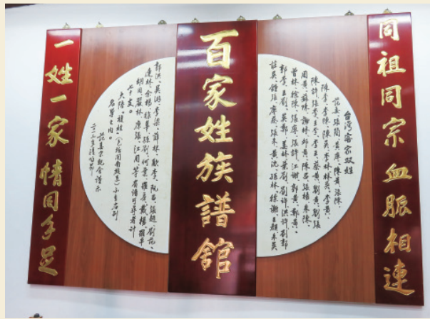
▲ 范姜人不僅對自家姓氏源流知之甚詳，祖堂內亦設有「百家姓族譜」供外界參觀