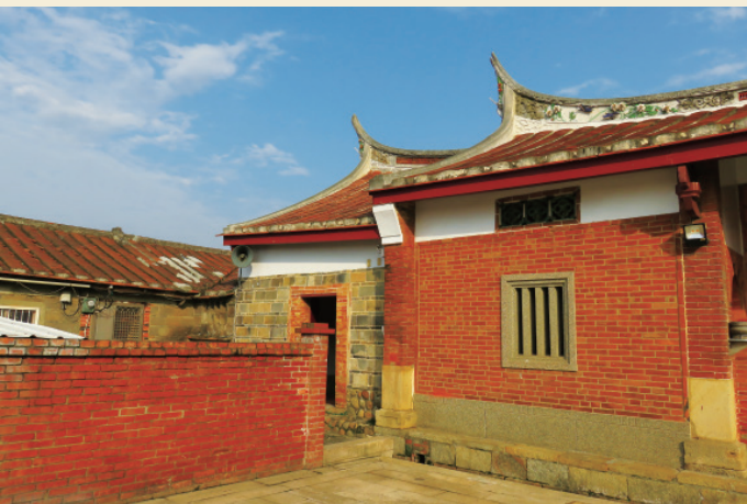
▲ 為達充分運用的功能性，祖堂橫屋的空間規劃已積極進行之中。