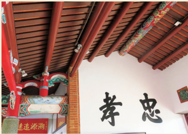
▲ 一進門就能看到的忠孝二字，彰顯祖先強調的忠孝節義精神。