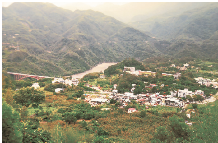
▲ 今日的羅浮部落，位於大漢溪中游，因河流繞行山腳下蜿蜒流動，形成典型的「掘鑿曲流」景觀。

那裡是南投縣北港溪的流域，為烏溪的主流上游，北港溪向西南西流至經翠巒、紅香、溪門，於馬家附近匯集瑞岩溪，續流至瑞岩。此一流域的泰雅族人被民族學家歸為 Squaliq（賽考列克群），其中的紅香部落在泰雅族語裡是「深山裡的部落」之意。相傳約 9 至 12 個世代之前，賽考列克群的頭目 KmButaKrahu 帶領族眾，自紅香部落等發祥地遷來此地，與原居當地的 Skhmayun 群體發生多次激烈衝突，最終泰雅族人獲勝，自此北遷的泰雅族人在大漢溪流域繁衍生息，各個家族團體，很快占有大漢溪中上游各高河階臺地，開展親族加上地域要素的聚落生活。故從清領到日治之初活動於大漢溪中、上游之族人，被史學家粗分為 Gogan（卡奧灣群）與 Msbtunux（大崙崙群）兩支，他們同屬 Squaliq（賽考列克群），亦均追溯