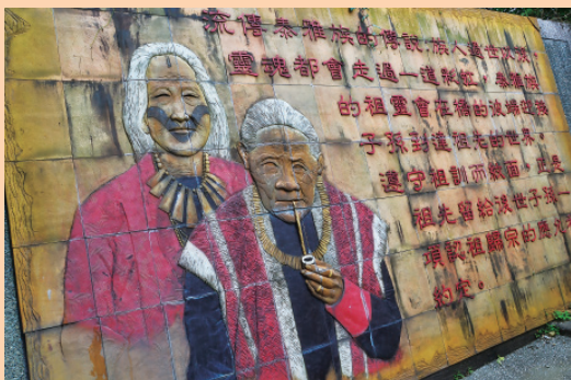
▲ 館外的陶板畫描繪了泰雅族的文面傳統。