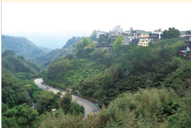
▲ 桃園市復興區舊稱角板山，乃因此地山峰如「角」，河階平坦如「板」，成為復興區最早的地名由來。