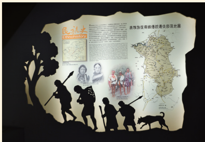
▲ 復興區泰雅族的民族史就是一部壯闊的部落遷徙史。