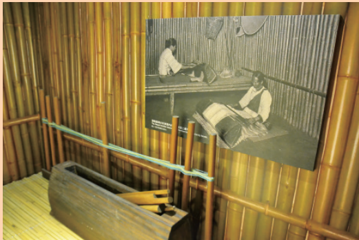
▲ 家屋內陳列的泰雅族婦女傳統織布器具。