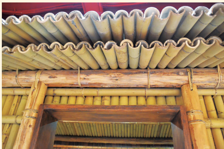
▲ 泰雅族的家屋屋頂是將竹子對半剖開，下層剖面朝上、上層剖面朝下，剛好環環相扣形成類似屋瓦的形狀，以達到不漏水的功用。