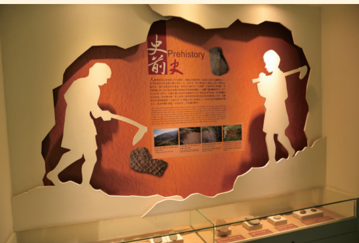
▲ 文化館以在地的考古發現講述泰雅族人的史觀。