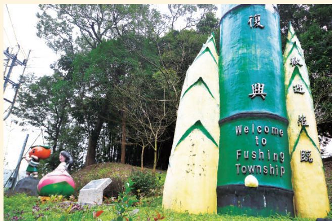
▲ 復興區的入口，有當地特有作物綠竹筍、水蜜桃和柑橘的可愛意象。

至 Pinsbkan，然各自部落以及部落跨區同盟等之認同甚強，成就出顯著的地方社會意識。最後遷抵的 Mncyaq（大豹社）族人，因難以判定歸屬何方，循此，亦有主張其為大漢溪的第三群。雖然，今日族人對各自屬群多能辨識，有清楚執著的我群「小歷史」意識；不過，基本上對源自 Pinsbkan 的「大歷史」思維，大家亦很堅持。