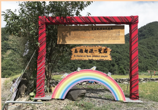
▲ 南投瑞岩泰雅族北遷的源頭 - 南投瑞岩的聖石。