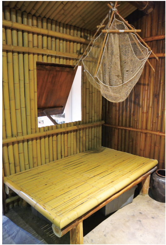
▲ 家屋內的陳設也都是以竹子製成。

以前泰雅族的居住和遷徙，部分跟家中的長輩過世有關，在泰雅族傳統的家屋中，床是隨時都可以移動的，如果家中有長輩或是家人過世，就會在床位下挖掘一個洞穴，將過世的親人埋葬進去，埋葬過後，還在世的家人就必須要搬走，將支撐房子的柱子取走，剩下的牆面就留在原地，搬遷到別的地方居住。泰雅族的家屋採平地式基地，除梁柱結構用木材外，牆面、屋頂均採用竹子、茅草構造，自周遭取料，從砍竹到編織牆面，只需要 7 到 10 天就可以蓋好。泰雅族的家屋屋頂是將竹子對半剖開，下層剖面朝上、上層剖面朝下，剛好環環相扣形成類似屋瓦的形狀，這樣鋪設的功用一來可以防水，二來竹子有毀壞時可以個別抽換，這種特殊的兩層竹瓦設