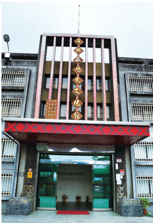
▲ 復興區歷史文化館，多年來致力於耆老傳統知識與智慧記錄計畫。