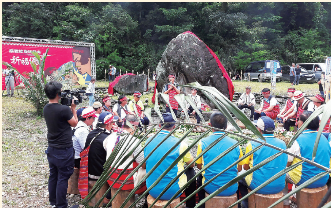
▲ 復興區泰雅族人舉辦歲時祭儀暨發源地尋根活動，會場中央為泰雅族北遷的源頭 - 南投瑞岩的聖石。