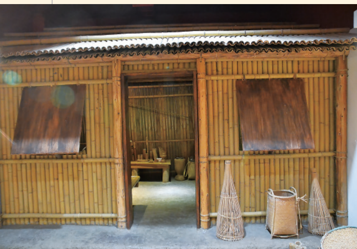
▲ 大漢溪流域泰雅族的傳統家屋，幾乎全以竹子搭建。

在臺灣所有的原住民族中，泰雅族的遷徙史是民族史中的重要一環，南部的其它各族並沒有遷徙史，當泰雅族從南投向北遷徙，越向北，移動的地點越多，只有知道遷徙歷史的耆老，才有辦法吟唱。