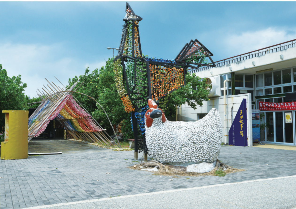
▲ 王功故事館前以上千個蚵殼組成的福氣雞裝置藝術。

喜歡作丹頂鶴這種野鳥，牠具有吉祥、忠貞、長壽、清高的寓意。來到王功以後，因余季老師作了〈福氣雞〉，他也喜歡上雞了。蚵藝文化協會在雞年時以「新雞創新機」特展打響名號，王功蚵藝協會用上千個蚵殼做成高 30 公尺的大型福氣雞裝置藝術，因為芳苑是全國重要的雞蛋產地，也希望用蚵藝來行銷在地產業。