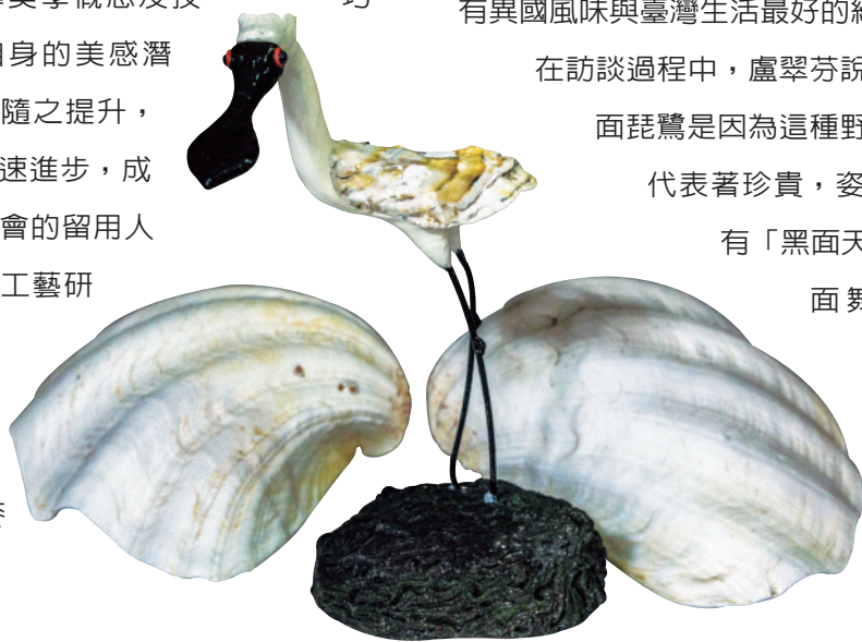
▲ 盧翠芬作品：黑面琵鷺。

在訪談過程中，盧翠芬說：喜歡做黑面琵鷺是因為這種野鳥稀少，是代表著珍貴，姿態優雅，又有「黑面天使」和「黑面舞者」的雅稱，是受保護的野鳥，另外他也