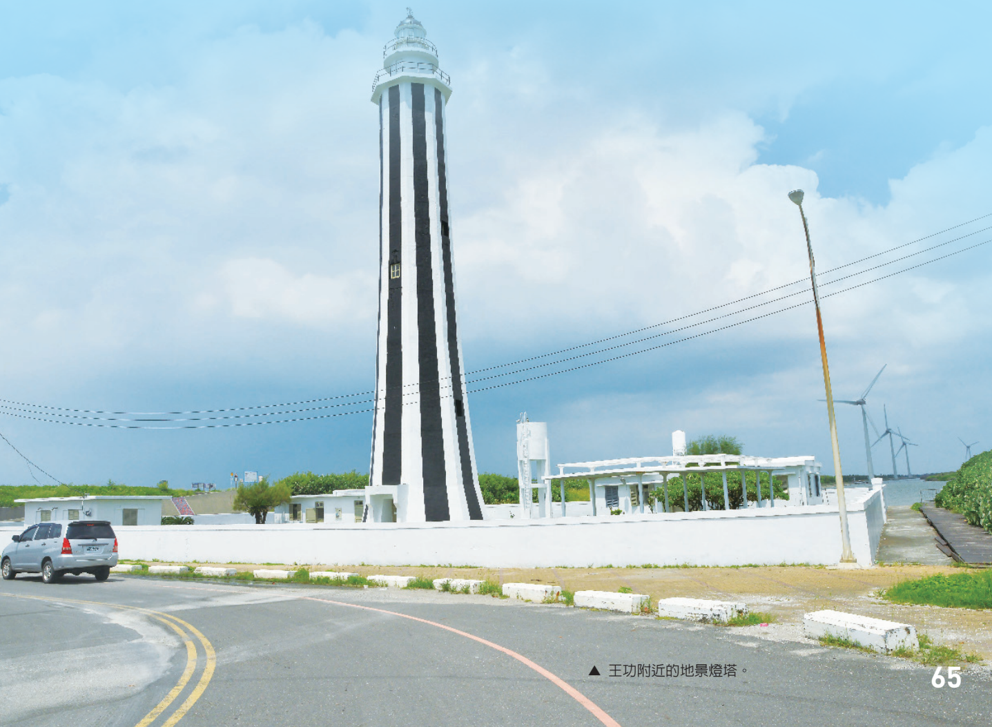
▲ 王功附近的地景燈塔。