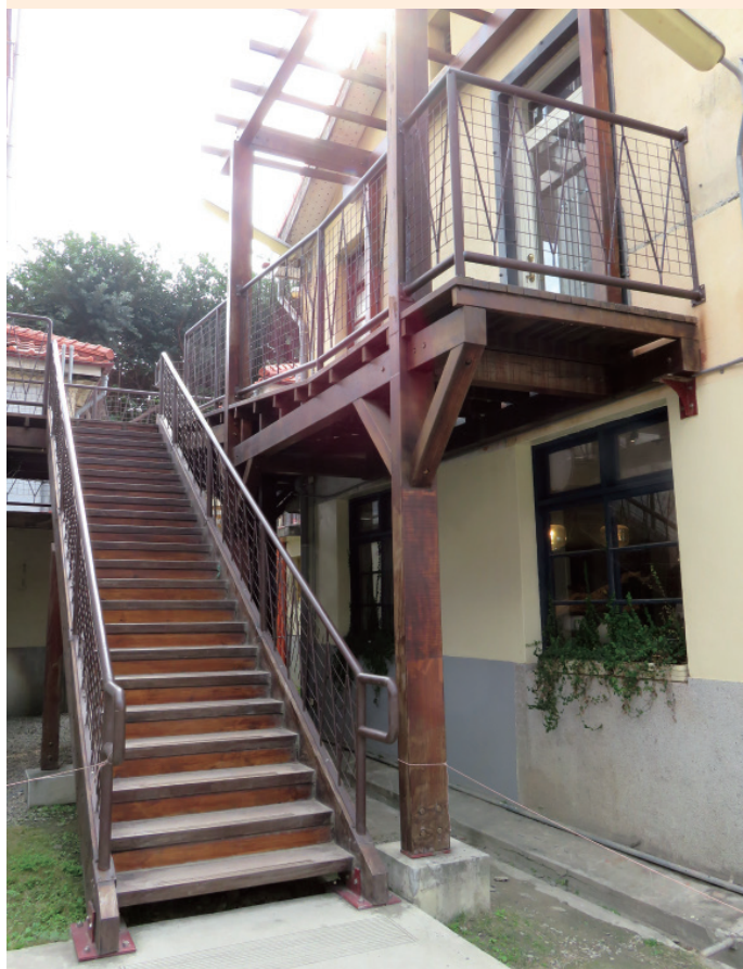
▲ 復古樓梯與棧道，維繫著鄰里間的情感連結。

以黑鐵為材料，使用焊接、彎折等工法，鐵花窗有著傳統工藝裡淬鍊堅韌的特性，但隨著時代演進，現在已沒人在做鐵花窗了。她們因為喜愛鐵花窗為建物營造出來的美感與復古氣息，因此保留原始細膩的工法，將原本鏽蝕的鐵花窗演繹成生活用品，重新詮釋這些物件。譬如來自傳統鐵花窗「鉚接轉折」處的靈感，將材質轉換到瓷土上，並以釉料繪製仿鐵花窗生鏽的韻味，創作出新的物件「筷架」(快嫁)，成了最受歡迎的婚禮小物。又譬如展覽作品「紙雕鐵花窗」，以暖色調的線材，雕琢出優雅細緻的光影。