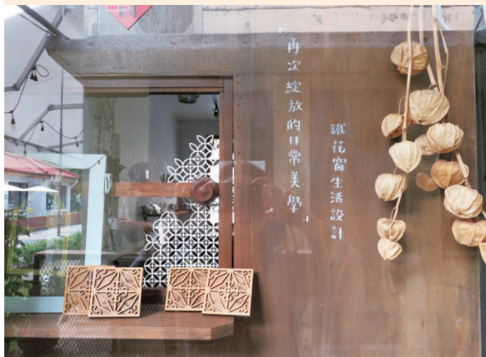
▲ 創業思維獨特的設計小店，每個細節都具巧思。