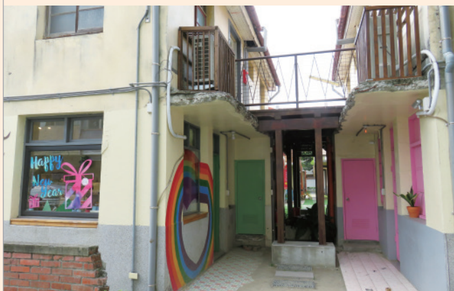
▲ 保留原始建物主體結構，更能凸顯老屋的優點及特色。