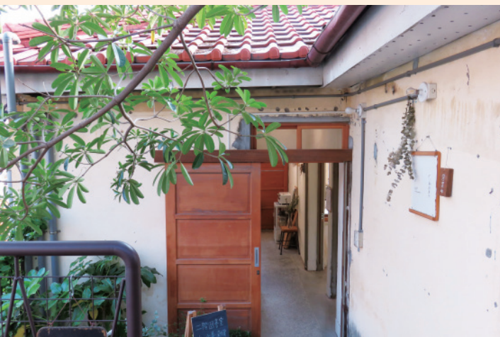
▲ 花木扶疏、綠意盎然的園區景致。

雖然執行長強調，計畫必須逐步推動、隨時調整，目前才剛起步而已，但園區的知名度已快速竄升。走一圈園區，發現好多獨有業別的小店都很引人注意：以廢棄木料回收後再創作的「刻刻」；專賣復古文具小物的「二階圖書室」；以「抗議」為主題的文創公仔…；別出心裁的作品，值得走進來細細品味、觀賞。最後介紹兩