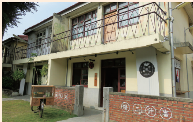
▲ 馬路旁的古早味杏仁茶坊，營造懷舊氛圍。

觀點植入園區，以「新舊傳承」的精神，落實「大手牽小手」的核心價值；除了引進國內標竿品牌與業者，並協助「摘星計畫」成員創業的屬性與經營，創造出一個全新的「審計學苑，綠意新村」。