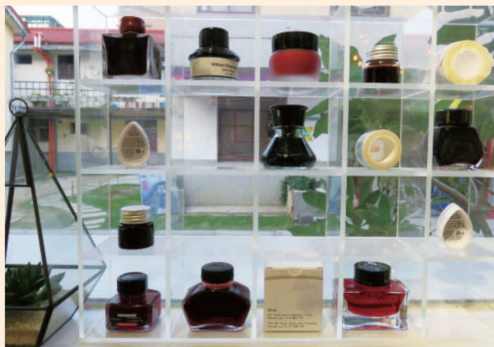
▲ 各種顏色的鋼筆墨水，彷如香水瓶般引人注目。