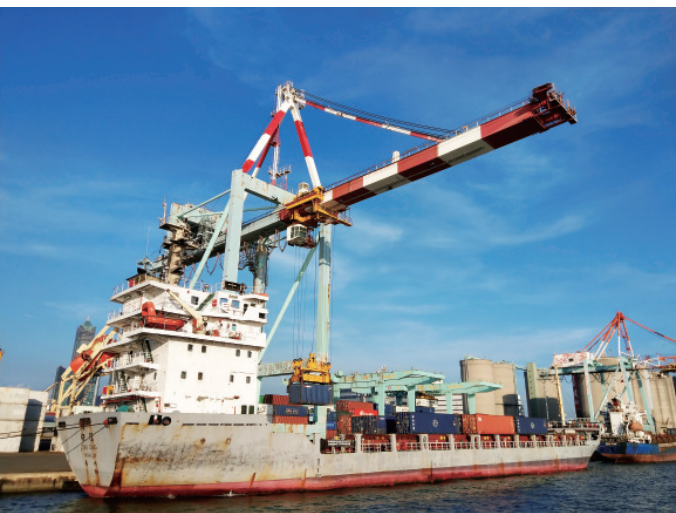
▲ 負責港區裝卸貨櫃的橋式起重機。