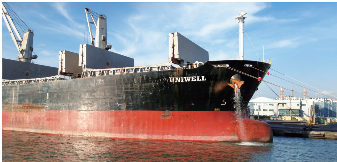
▲ 透過船舷排出大量的海水。