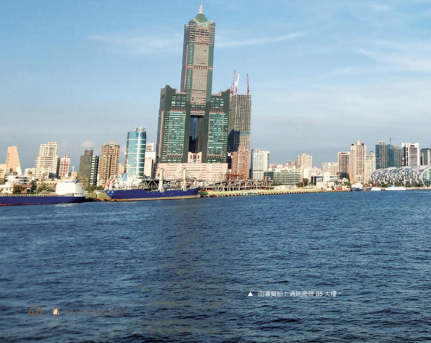
▲ 由導覽船上遠眺高雄 85 大樓。