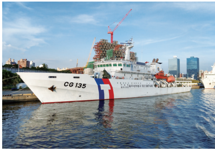
▲ 捍衛臺灣南部海域及南中國海區的高雄艦。

一旁的海巡署 3000 噸級巡防救難艦——高雄艦，更顯得霸氣而新穎。巡防救難艦主要用於專屬經濟區執行巡防護漁及救難任務，高雄艦主要負責臺灣南部海域及南中國海區部分，而他的同胞兄弟宜蘭艦，