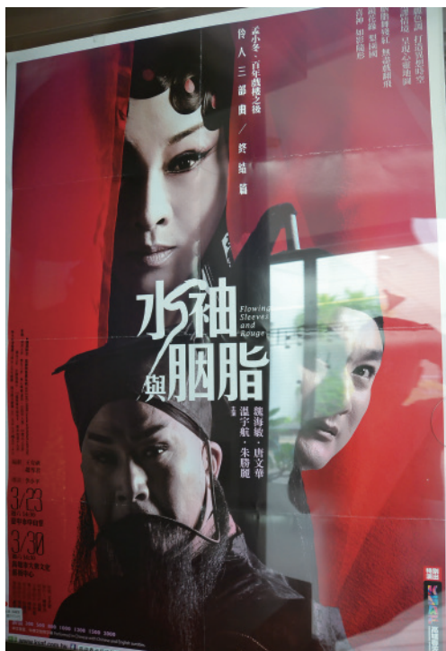
▲ 3樓的「海報與節目單典藏區」很另類。