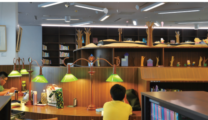
▲ 室內照明以晝光色和日光色交替，營造出極為舒適的閱讀氛圍。