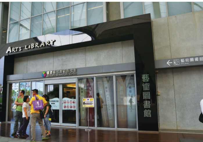
▲ 走進這道藝術之門，似也意味著走進了藝術的殿堂。

穿過流通服務櫃台，就是兒童及青少年基礎藝術專區，圖書館的吉祥物「藝小圖」和「鳳小青」就站在入口處歡喜迎客。「藝小圖」命名的涵意當然不言而喻，那