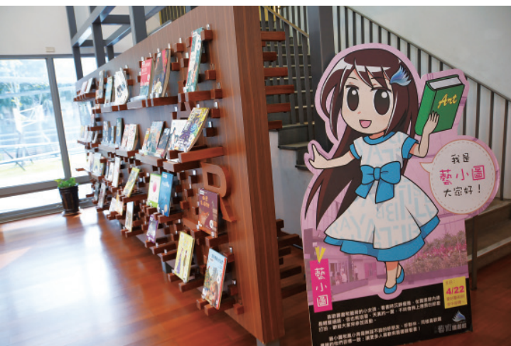
▲ 圖書館的吉祥物「藝小圖」，命名的含義不言而喻。

由於館內各樓層的空間高度並不高，所以書架的陳列，一般成人伸手就可拿到最上層的書，深褐色的木質書架有著圓潤的曲線，觸摸起來十分舒服。書架的間距並不大，因為書架的設計是兩面開放式的，剛好容納兩本書的寬度，所以一目了然。靠窗的閱讀空間除了小型的沙發，所有的椅子都是類似明清家具的圈椅，一道圓潤的曲線，即可擁入入懷，符合「人體工程學」。炎夏，雙臂倚在圈椅上，腋下