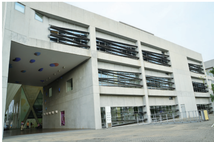
▲ 圖書館外牆的大片玻璃窗加裝了Z字形斜階的外框，既有防風的安全功能，也起到遮陽防曬的作用。