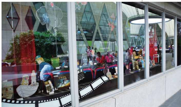
▲ 圖書館窗戶映出的風景就像是一幅色彩斑斕的抽象畫。

及捷運紅線、橘線藝文路網的重要據點。未來藉由高雄捷運與各大文化網絡的串聯，營造大東文化藝術中心、衛武營藝術文化中心、高雄市文化中心為鏈結的藝文