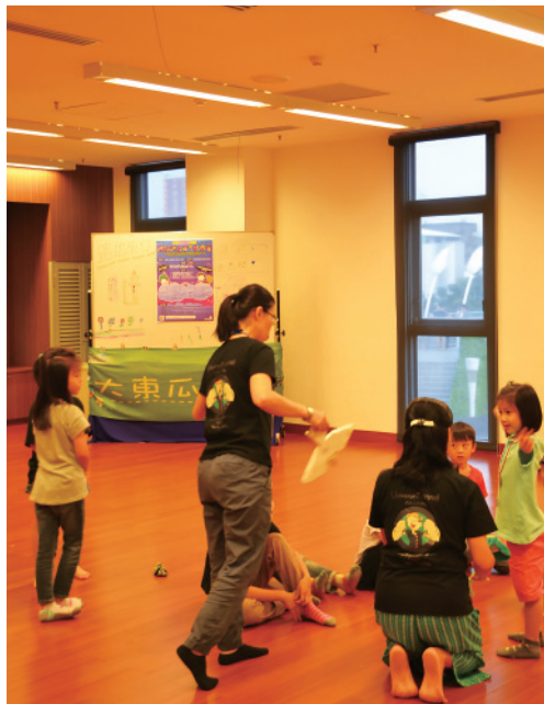
▲ 做為親子活動的重要場所也是圖書館所扮演的重要角色。

自得生風、涼意習習。明末文人文震亨在其《長物誌》中津津有味的寫著關於書房的規則：宜明淨，不可太敞；明淨可爽心神，太敞則費目力。我看大東藝術圖書館也頗符合古人對書房的要求，閱讀空間不求大，只求舒適而不受外界的干擾。