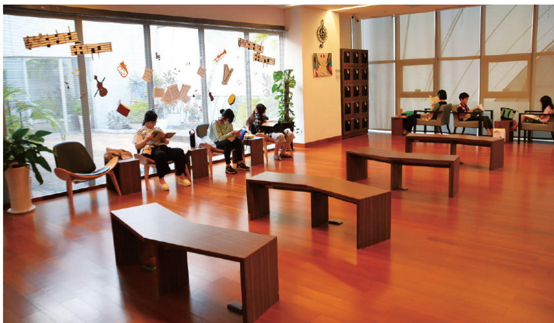
▲ 大面積落地窗搭配戶外景觀，讓閱讀變得很享受。