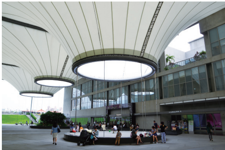
▲ 大東藝術圖書館是臺灣首座以藝術為取向的主題圖書館。

月建成啓用，是一融合生活藝術與在地文化特色的 合性文化中心。整體設計意象強調自然元素，以半戶外建築空間與週遭生態系統結合，引入自然風的流動、錯落的光影、及雨水與鳳山溪等水資源，營造出東方禪學之美。