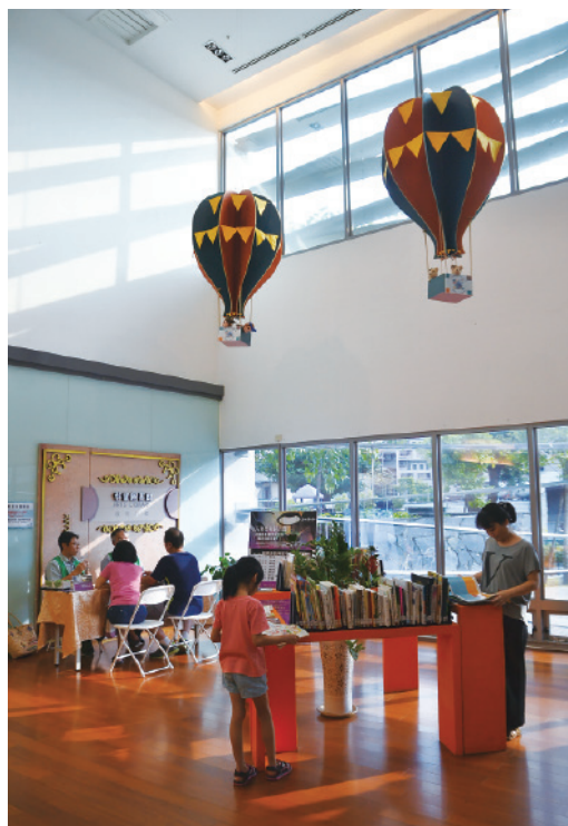
▲ 空中懸浮著熱氣球的裝置藝術，帶給讀者飛躍的靈感。

藝術圖書館的入口仿書店櫥窗的模式，黑色的巨型邊框上書寫著中英文「藝術圖書館 ARTS LIBRARY」字樣，「櫥窗」裡展示了 12 本巨書，正好是館藏 12 大類藝術主題的書籍，包含文化藝術、音樂、雕塑、繪畫、建築、舞蹈、戲劇、電影、工藝（金石）、攝影、書法及動漫。而這些清透的玻璃既可以透視室內，也能反射