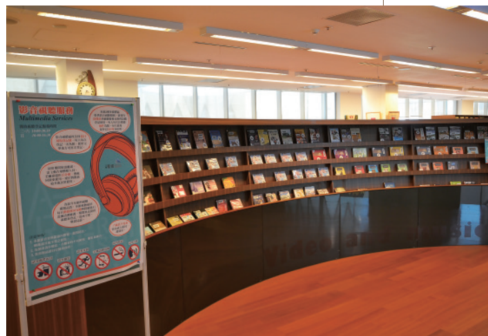
▲ 2樓提供影音多媒體資訊服務。