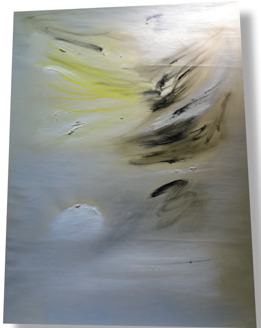
▲ 百花春至為誰開 西元 1958 年 油彩、畫布。