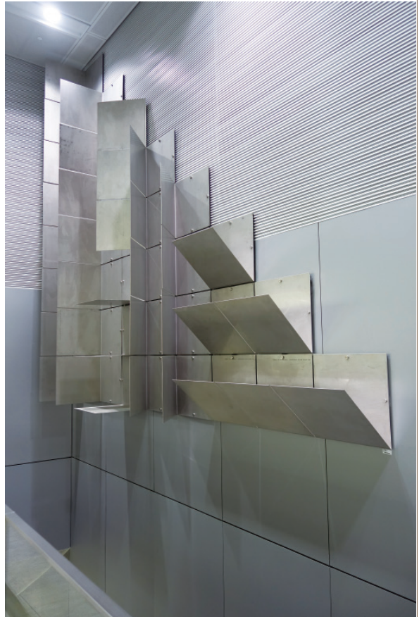
▲ 宇田 公共藝術 機場捷運北門站。

6 歲時林壽宇卻被父親送至臺北的旭小學就讀（今東門國小），寄宿在日本官宦家庭裡，他頓時由不可一世的富少爺跌入人間地獄。在寄宿家庭裡他不但要為日