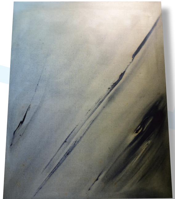
▲ 岩 西元 1958 年 油彩、畫布。