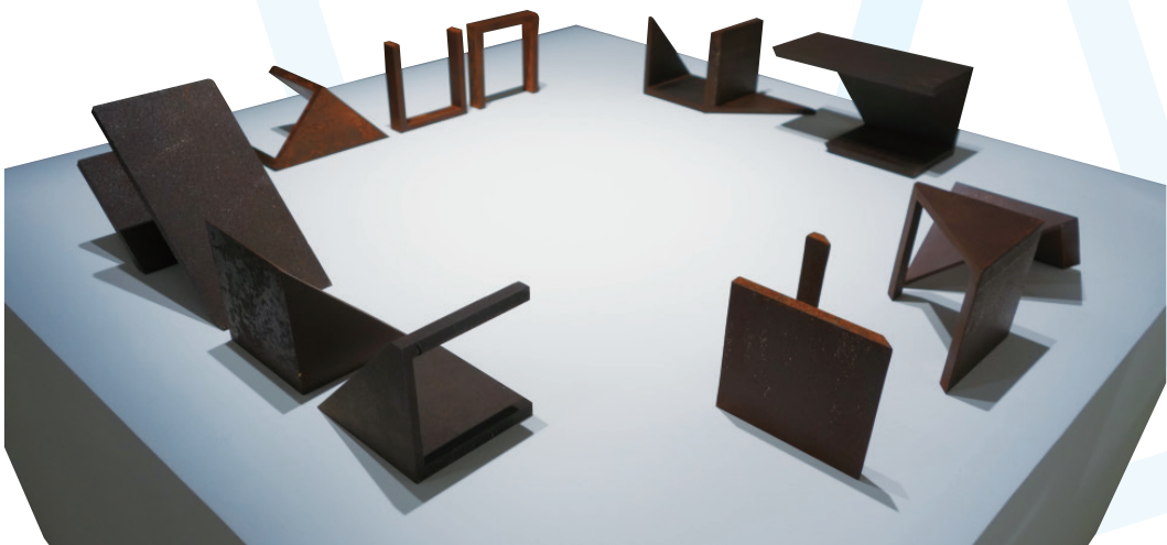
▲ 林壽宇立體造型作品《存在與變化》西元 1984 年。

原是含著金湯匙出生的林壽宇，從不知窮為何物，西元 1958 年他自建築系畢業後生活十分拮据，不得不拾起畫筆塗塗抹抹，希望賣畫為生。他，一個富甲一方的霧峰林家子弟，在異國倫敦街頭，沿著畫廊一家家地推薦自己的畫作，每家畫廊的負責人一看到這位東方面孔的年輕人，連畫都沒看一眼，就說：「我們畫廊的畫家已經滿了，你到別家看看吧！」走到最後一家他正黯然神傷，瀕臨棄絕，忽聽得畫廊負責人說：「把作品留下來賣賣看。」