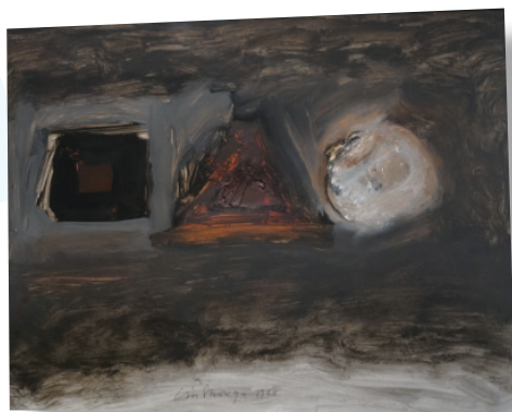
▲ 正方形、圓、三角形 西元 1958 年 油彩、紙。

此後林壽宇返回英國，也許是第二任英國太太異國婚姻的衝突，自 70 年代中期與馬勃羅畫廊的解約等種種因素，使他